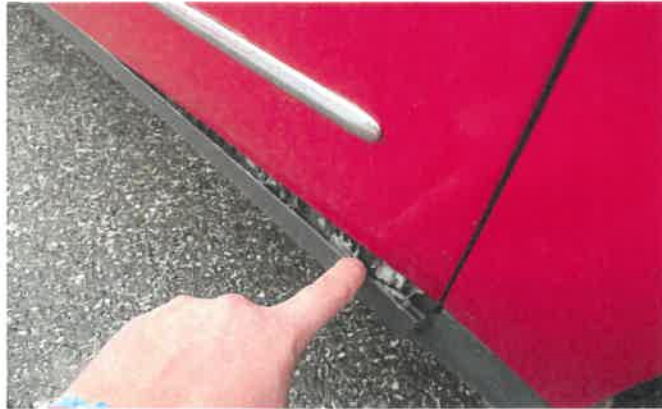
Türleiste re.vo. unten