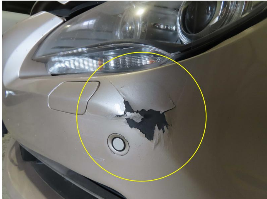
Stoßfänger vorne links beschädigt