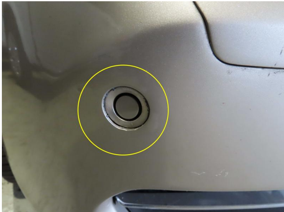
PDC-Sensor vorne rechts außen lose