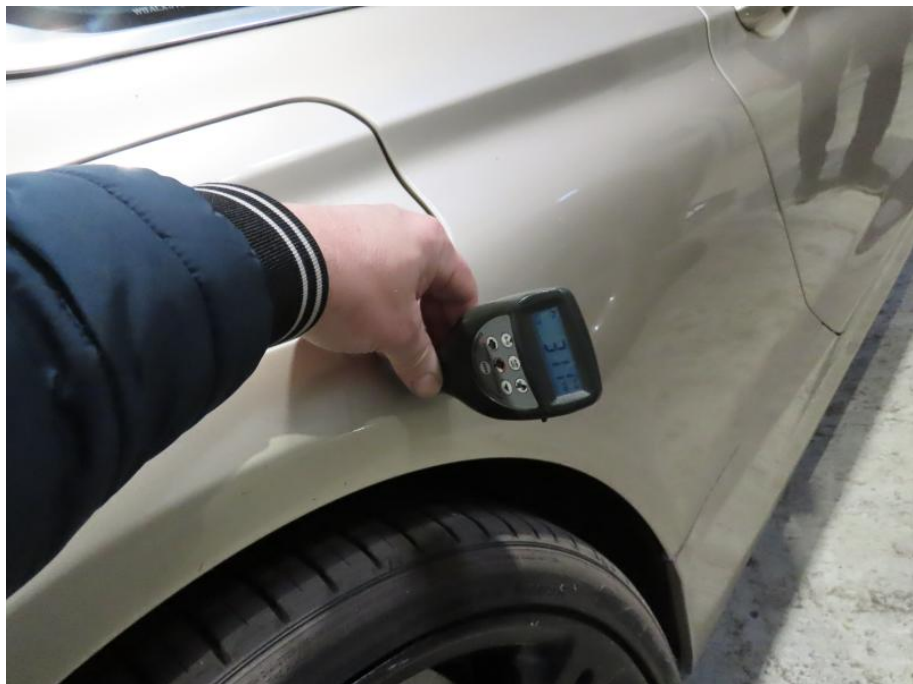
Seitenwand hinten rechts erhöhte Lackschichtstärke