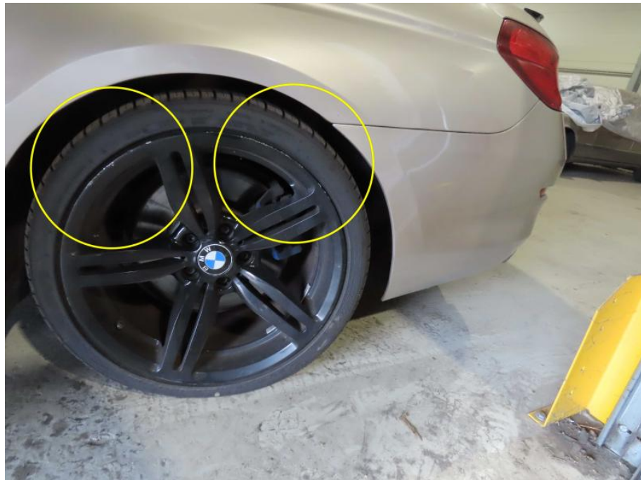
Felge hinten links beschädigt