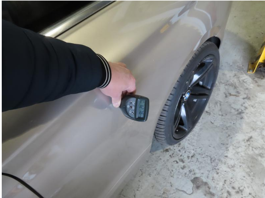
Seitenwand hinten links erhöhte Lackschichtstärke