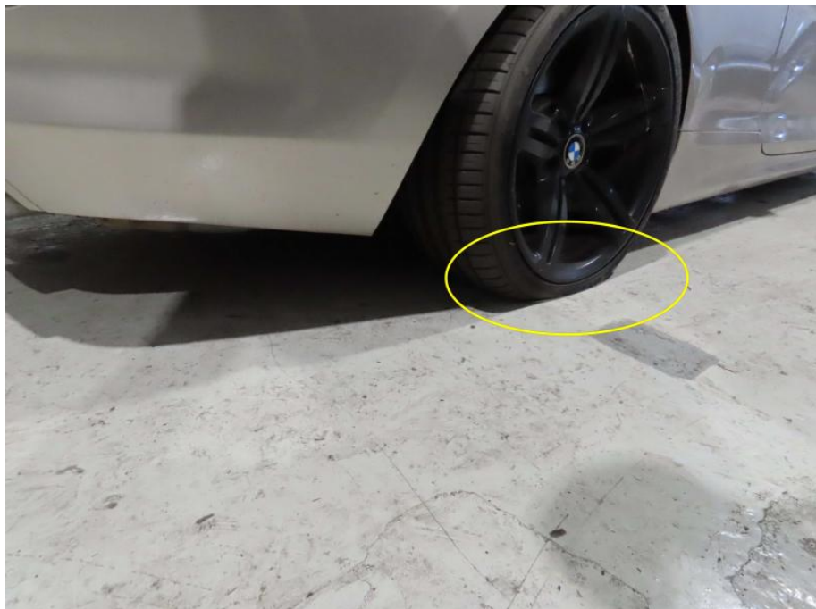
Reifendruckverlust hinten rechts