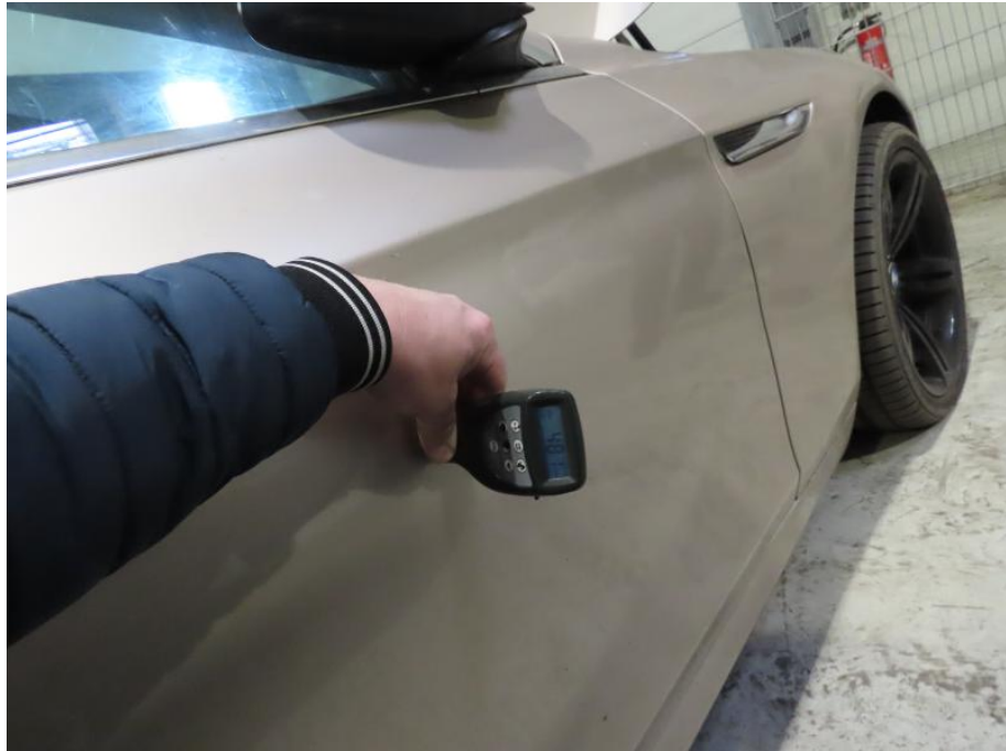
Tür rechts erhöhte Lackschichtstärke