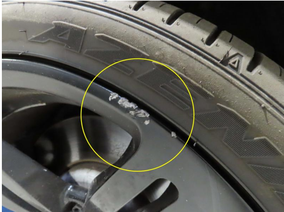
Felge vorne rechts beschädigt