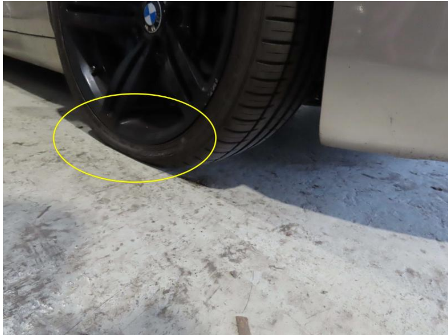
Reifendruckverlust vorne rechts