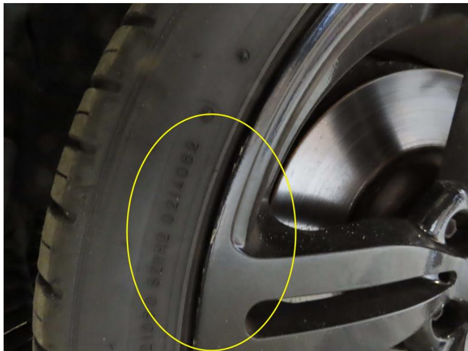
Felge vorne links beschädigt