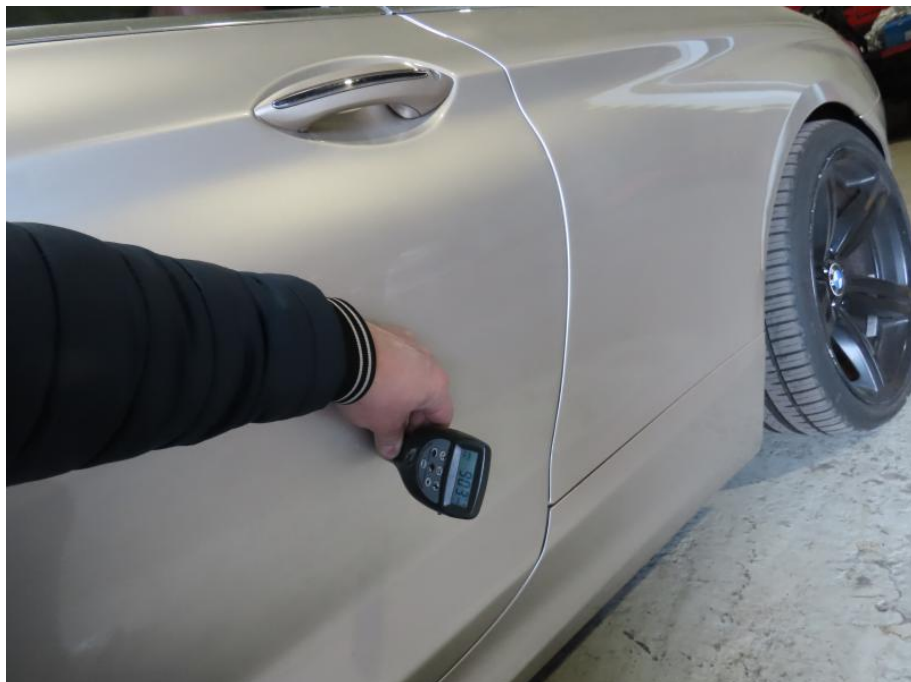
Tür links erhöhte Lackschichtstärke