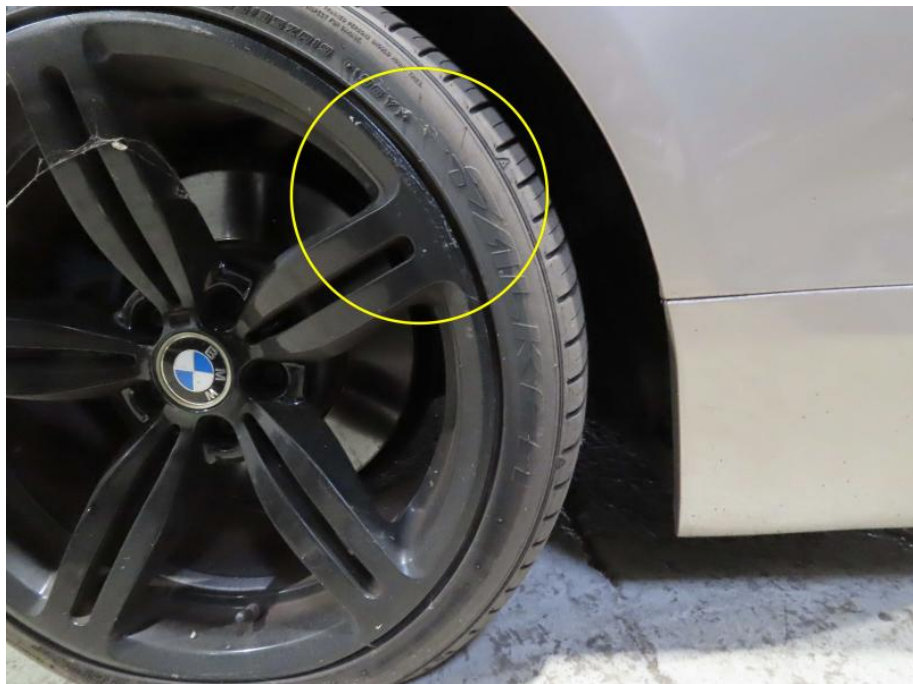
Felge hinten rechts beschädigt