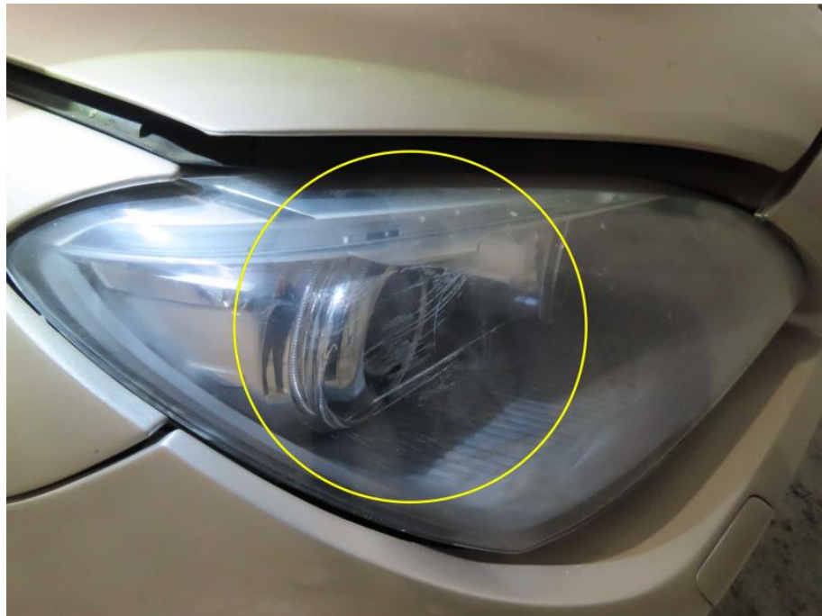
Scheinwerfer vorne rechts verschrammt