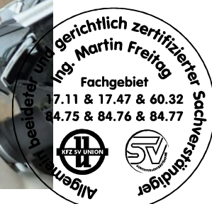
Fahrzeug Foto 2 von 18