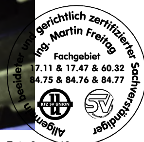
Fahrzeug Foto 8 von 18