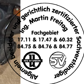
Fahrzeug Foto 4 von 18