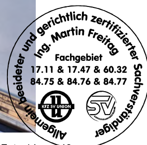
Fahrzeug Foto 14 von 48