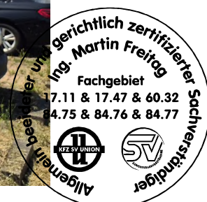
Fahrzeug Foto 32 von 48