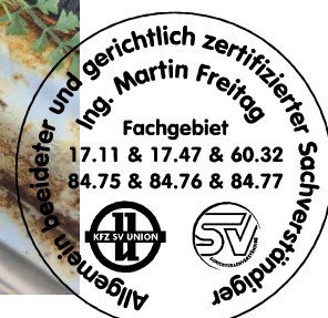
Fahrzeug Foto 20 von 48