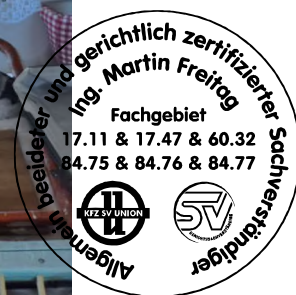
Fahrzeug Foto 46 von 48