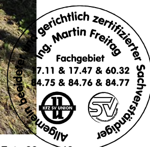
Fahrzeug Foto 38 von 48