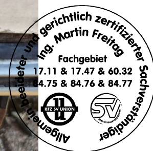
Fahrzeug Foto 12 von 48