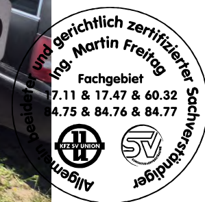
Fahrzeug Foto 28 von 48