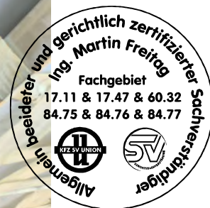
Fahrzeug Foto 40 von 48