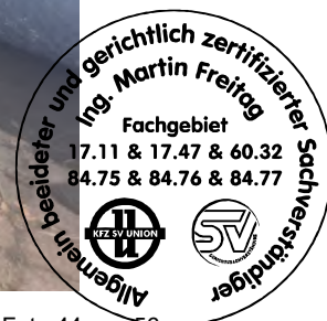
Fahrzeug Foto 44 von 56