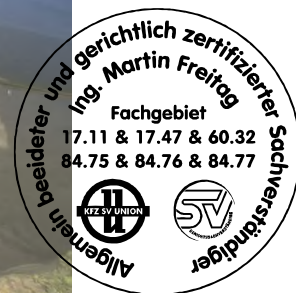
Fahrzeug Foto 52 von 56