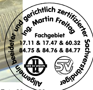
Fahrzeug Foto 20 von 56