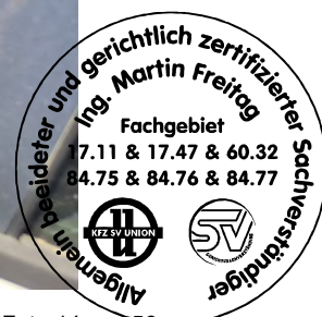
Fahrzeug Foto 14 von 56