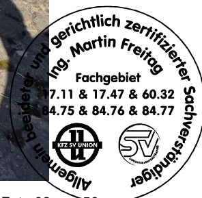
Fahrzeug Foto 32 von 56