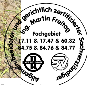
Fahrzeug Foto 50 von 56