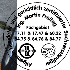
Fahrzeug Foto 4 von 60