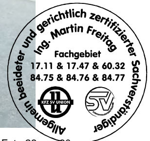
Fahrzeug Foto 26 von 60