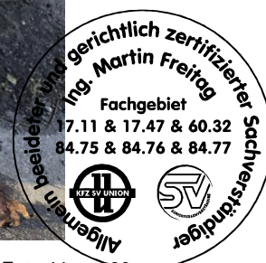
Fahrzeug Foto 44 von 60