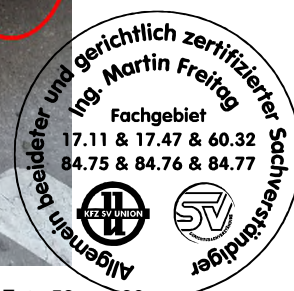
Fahrzeug Foto 56 von 60