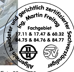
Fahrzeug Foto 20 von 60