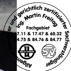
Fahrzeug Foto 30 von 60