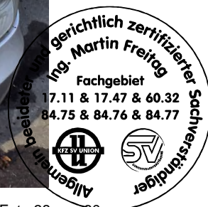
Fahrzeug Foto 38 von 60