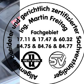
Fahrzeug Foto 24 von 60