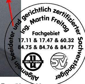
Fahrzeug Foto 50 von 60