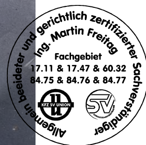
Fahrzeug Foto 10 von 60