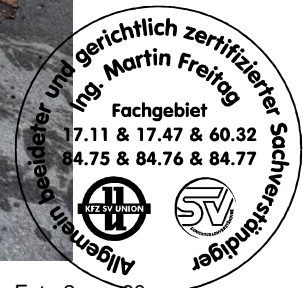
Fahrzeug Foto 2 von 60