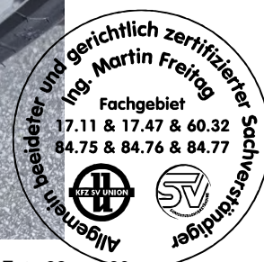
Fahrzeug Foto 32 von 60