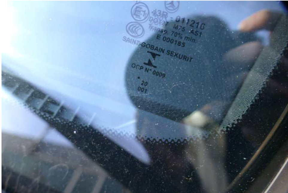
Windschutzscheibe - Herstellungsjahr 01/2020