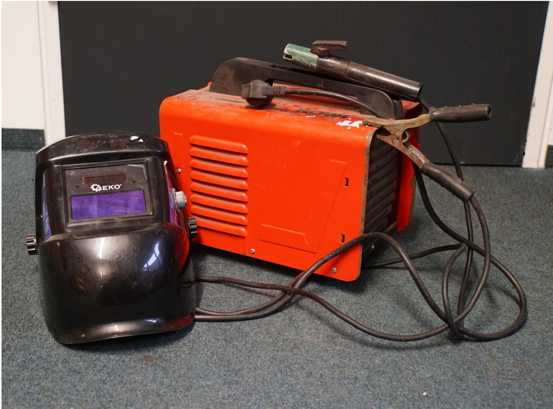
Schweißgerät + Schweißermaske