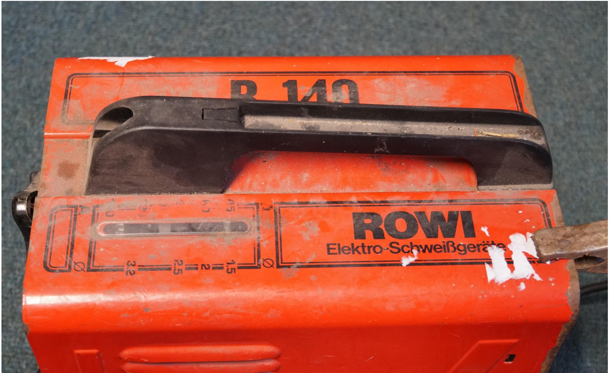
Ansicht v. oben