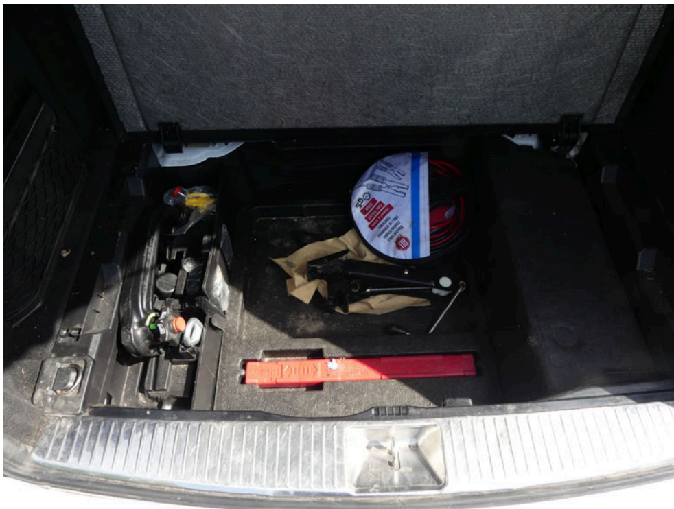
Bild: 30 Detailansicht Kofferraum innen.