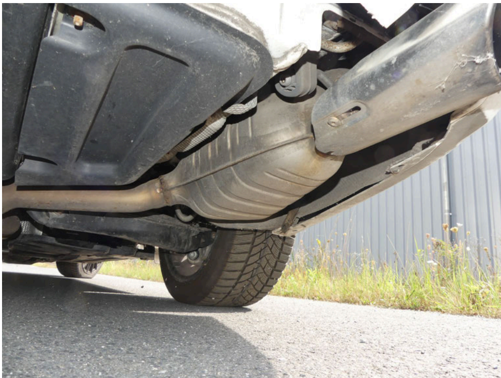
Bild: 16 Ansicht Abgasanlage rechts