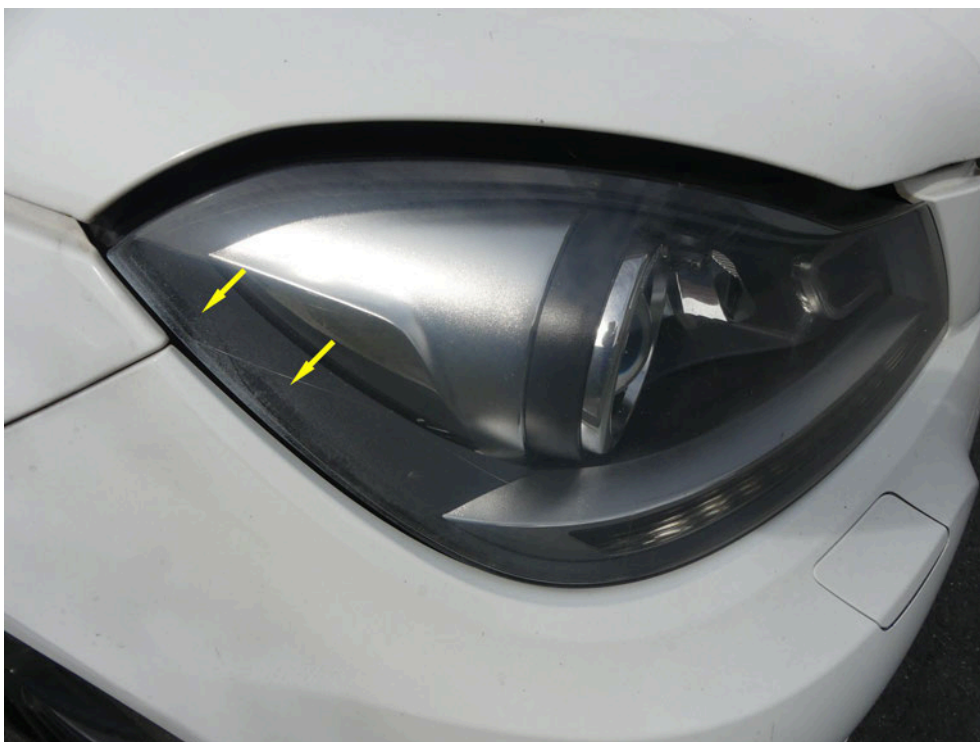
Bild: 51 Ansicht Hauptscheinwerfer rechts, dieser weist partiell ein Farbantrag auf.