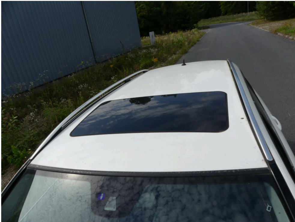
Bild: 9 Ansicht Fahrzeugdach