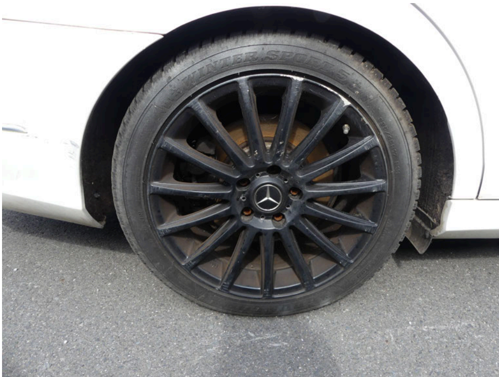
Bild: 42 Ansicht Rad/Reifenkombination hinten rechts