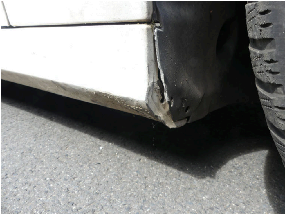
Bild: 54 Schwellerabdeckung rechts ....