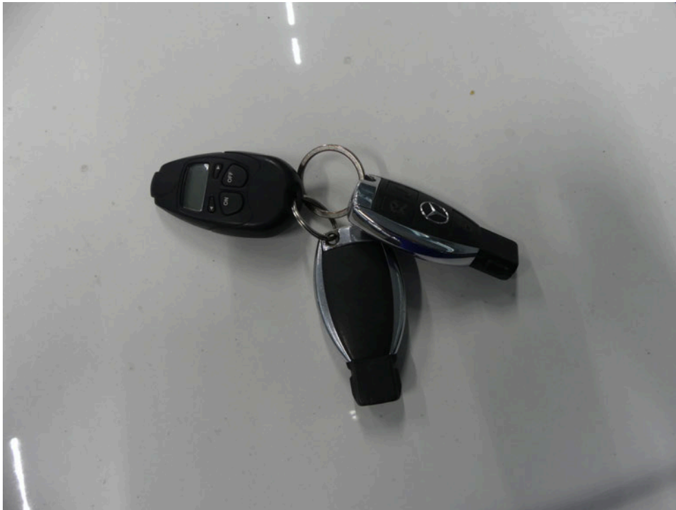
Bild: 11 Ausweisung vorhandene Fahrzeugschlüssel + 1 Fernbedienung Standheizung