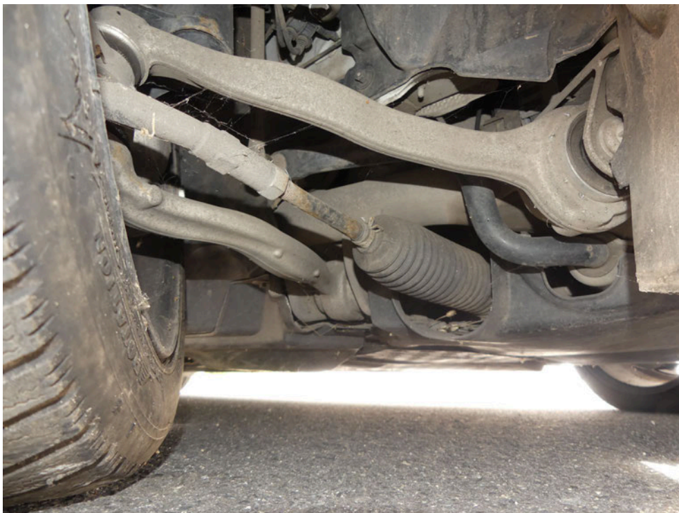
Bild: 14 Ansicht Vorderachse rechts