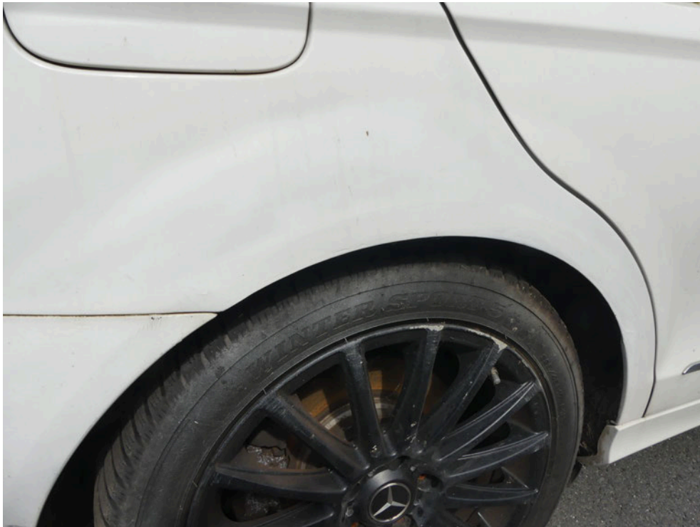
Bild: 58 .... diese ist im Bereich Radlaufbogen instandgesetzt und mittels Spraydose nachlackiert worden.