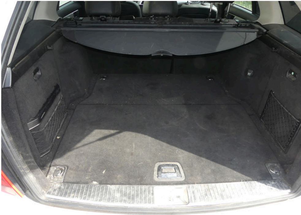
Bild: 29 Ansicht Kofferraum