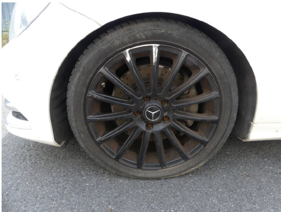
Bild: 38 Ansicht Rad/Reifenkombination vorn links