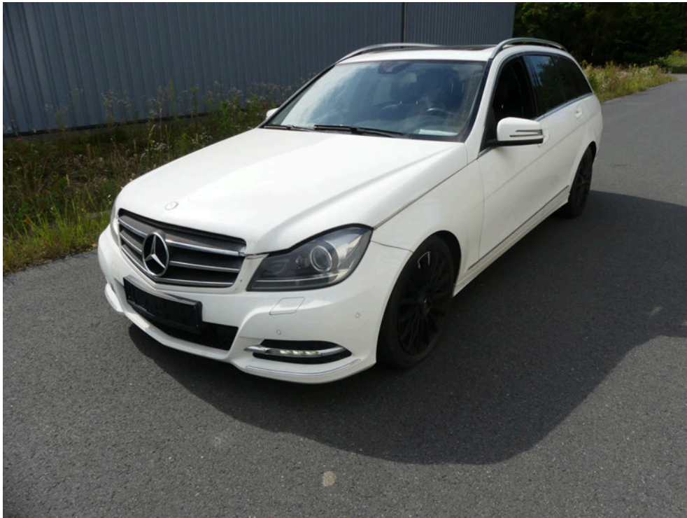
Bild: 3 Diagonalansicht