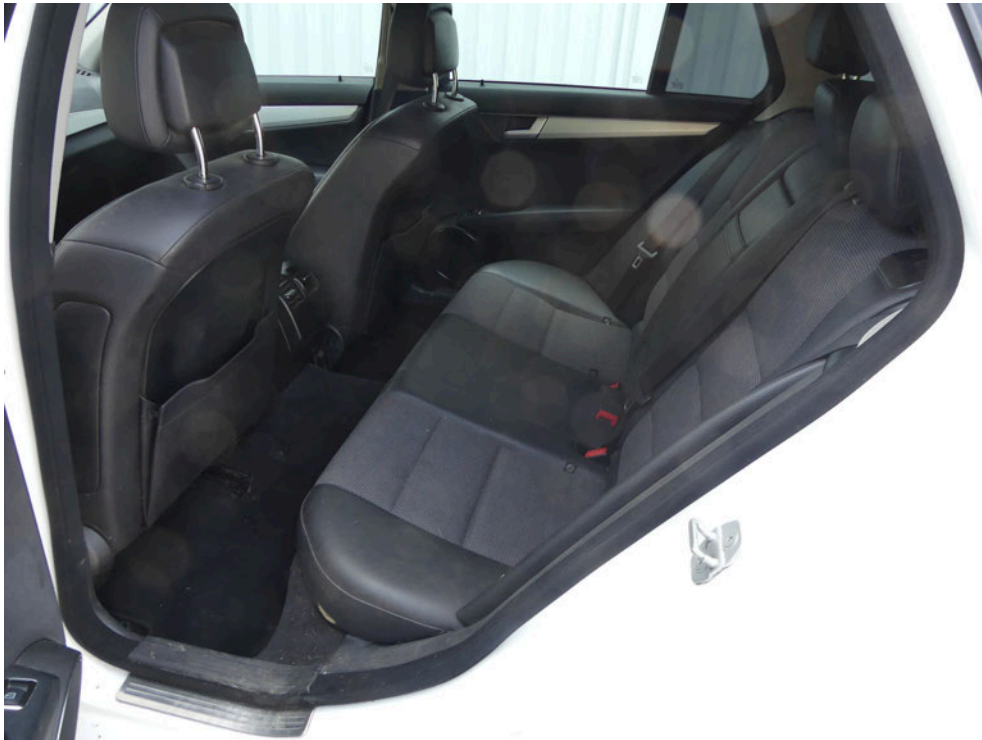
Bild: 27 Innenraum, hinten links