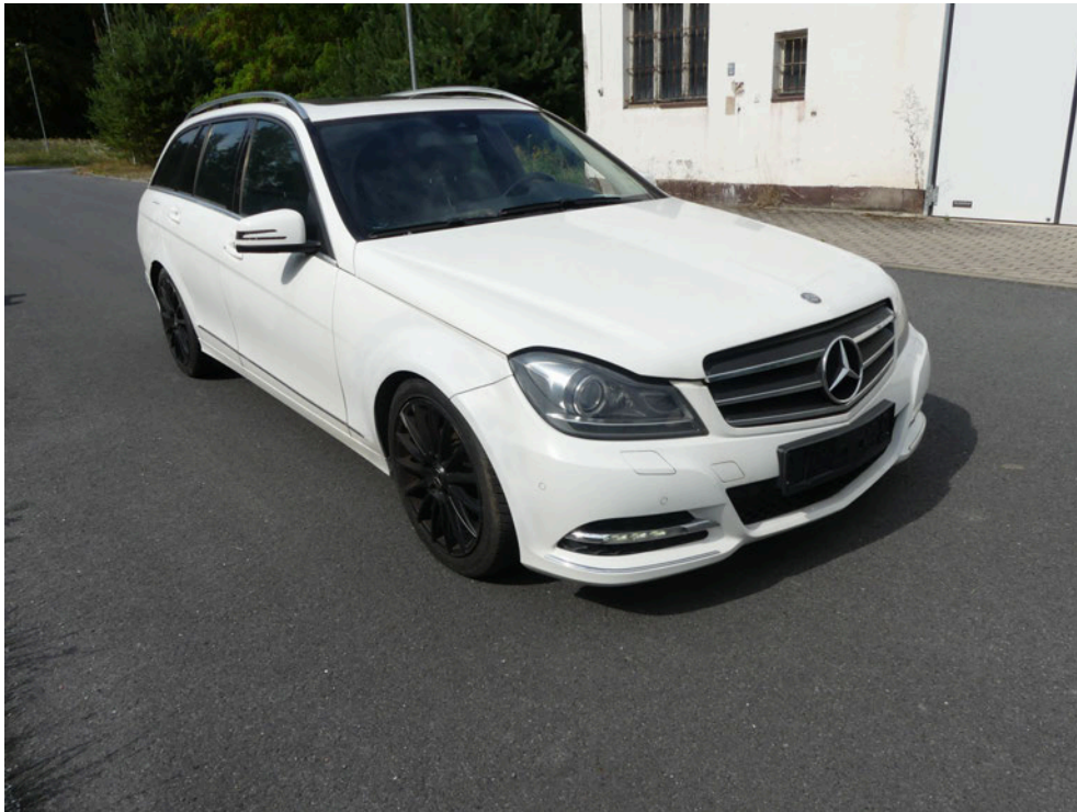
Bild: 1 Diagonalansicht