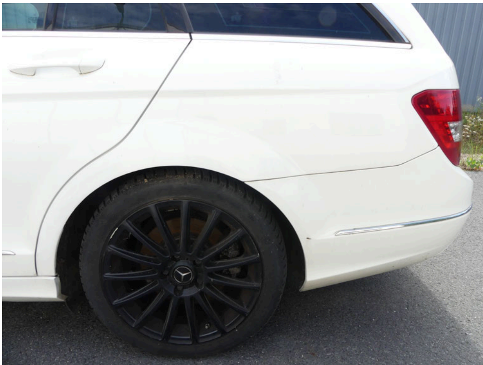
Bild: 61 Ansicht Seitenwand links ...