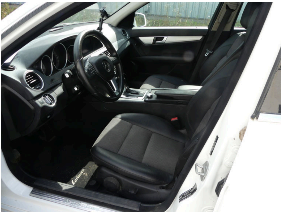
Bild: 20 Innenraum, vorn links