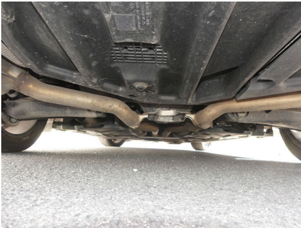
Bild: 17 Detailansicht Unterboden.