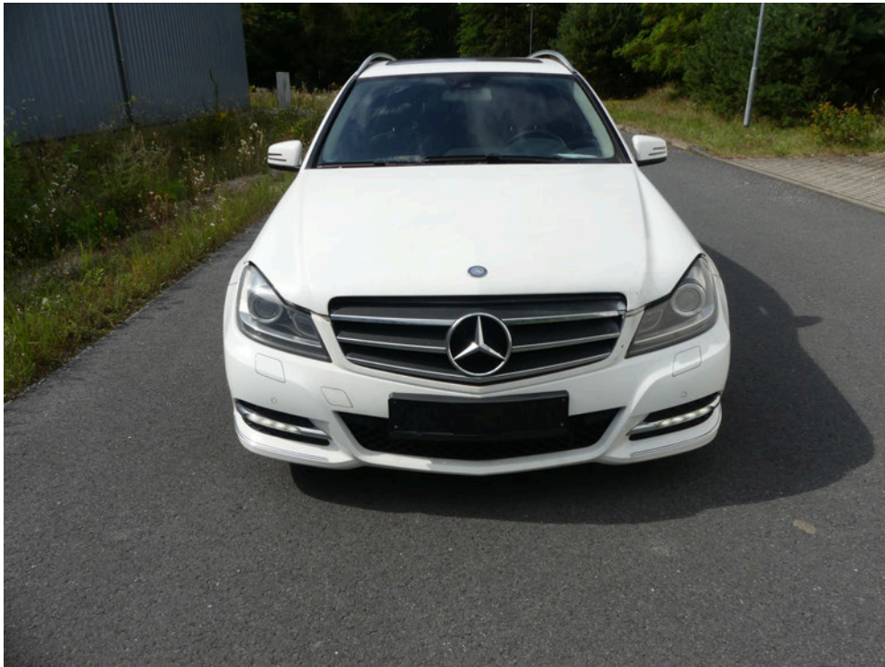
Bild: 5 Frontansicht