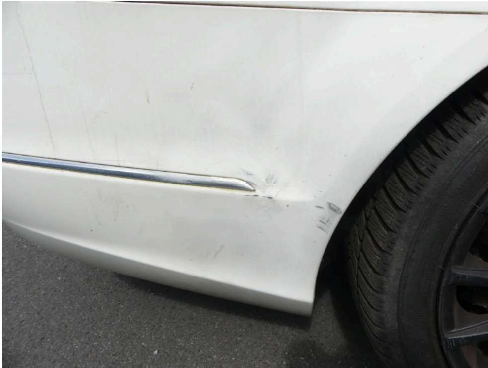
Bild: 60 Einzeldarstellung in genäherter Perspektive.