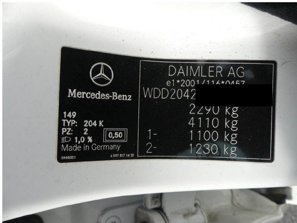
Bild: 37 Ausweisung Fahrzeugidentnummer