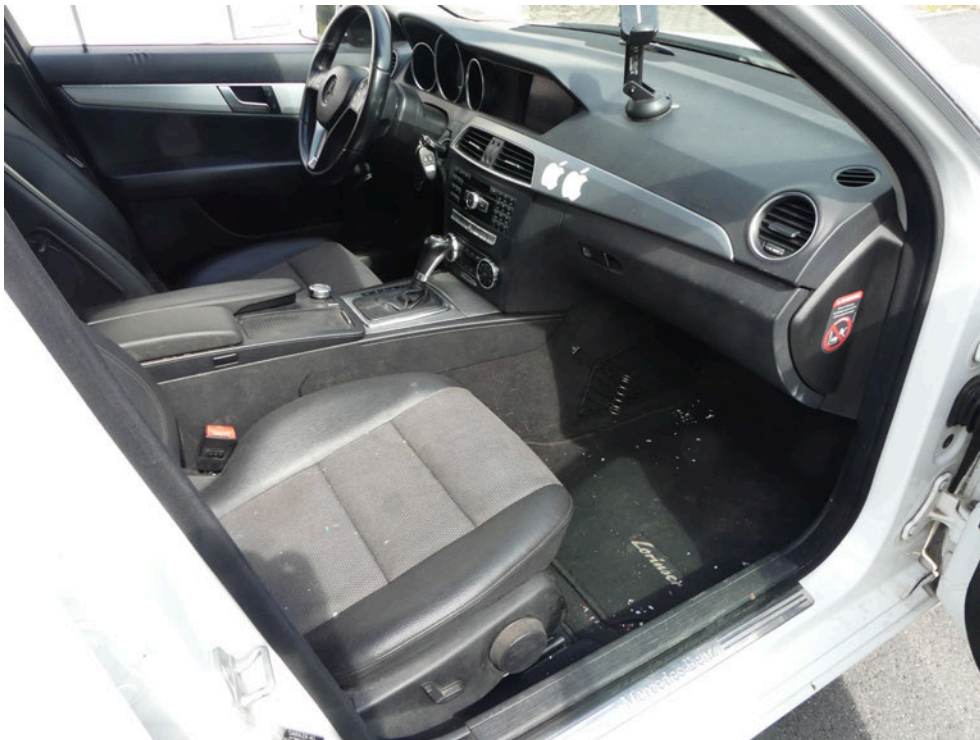
Bild: 35 Innenraum, vorn rechts