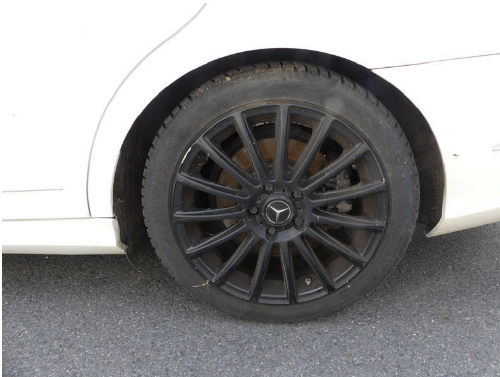
Bild: 40 Ansicht Rad/Reifenkombination hinten links