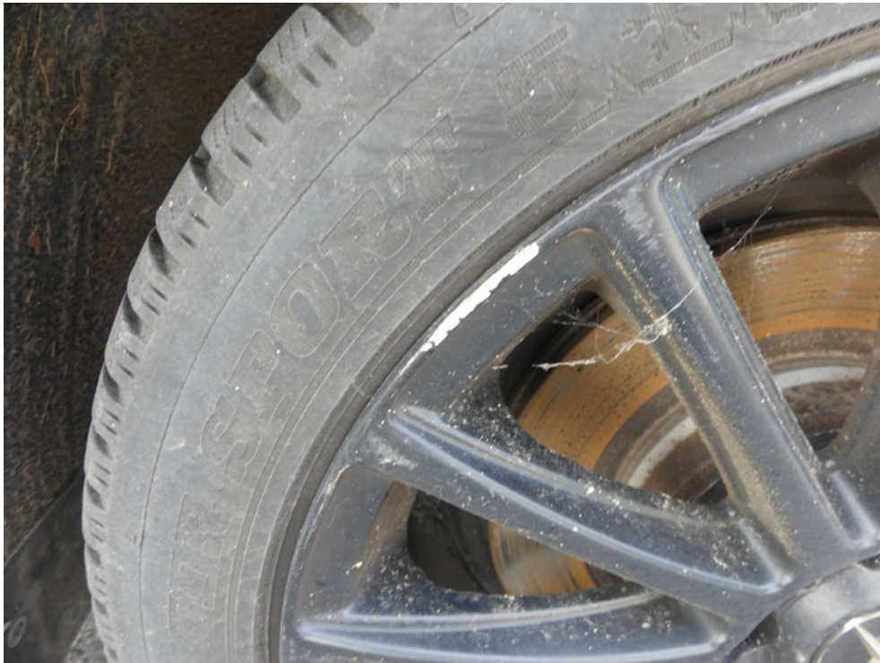
Bild: 41 Ansicht wie vor in geänderter Perspektive, LM-Felge beschädigt.