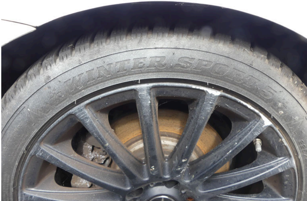
Bild: 44 Sprühpäckstände an dem Radialreifen sowie an der LM-Felge anhaftend.