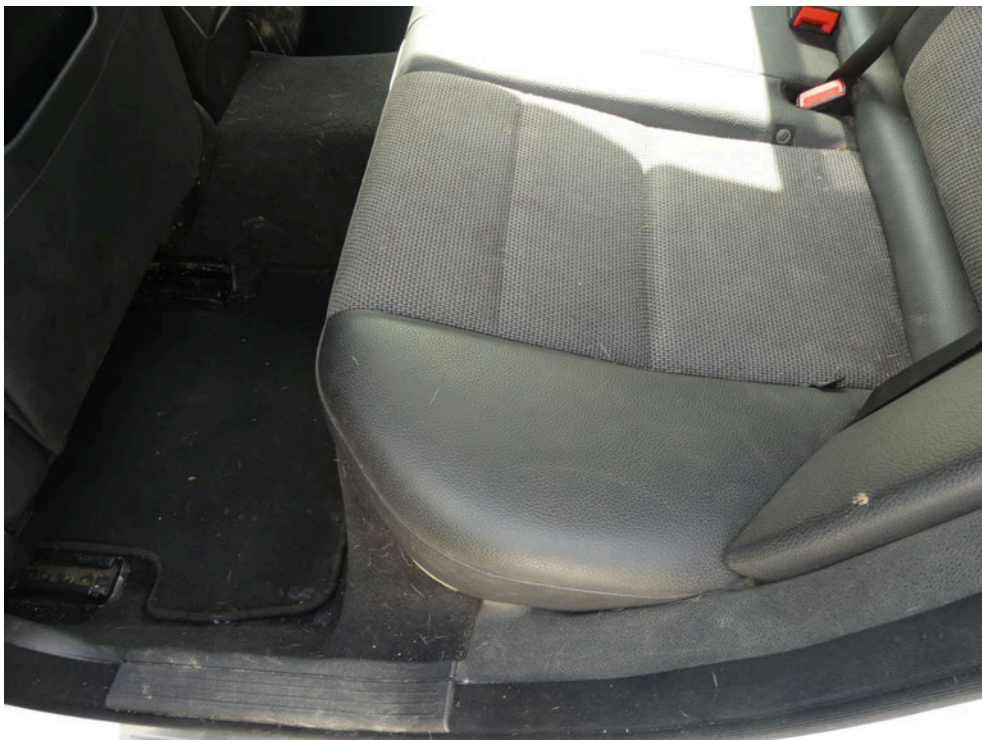
Bild: 28 Einzelansicht Rücksitzbank