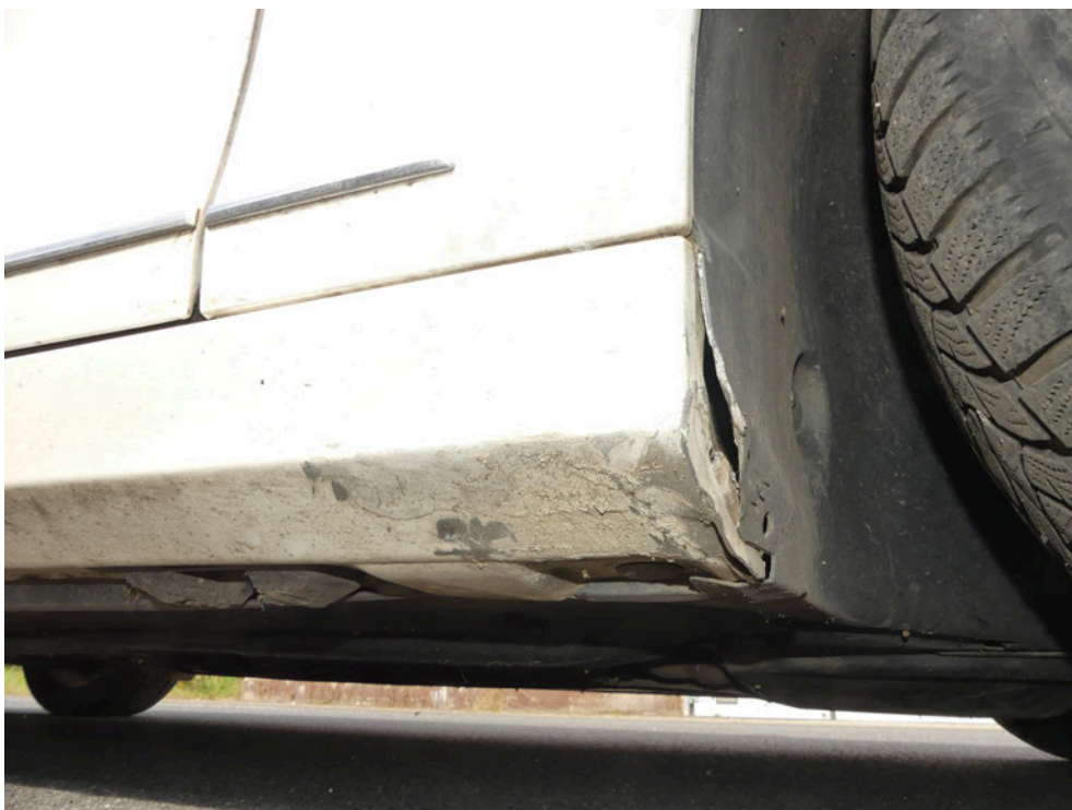
Bild: 55 .... nachbearbeitet und nachlackiert.