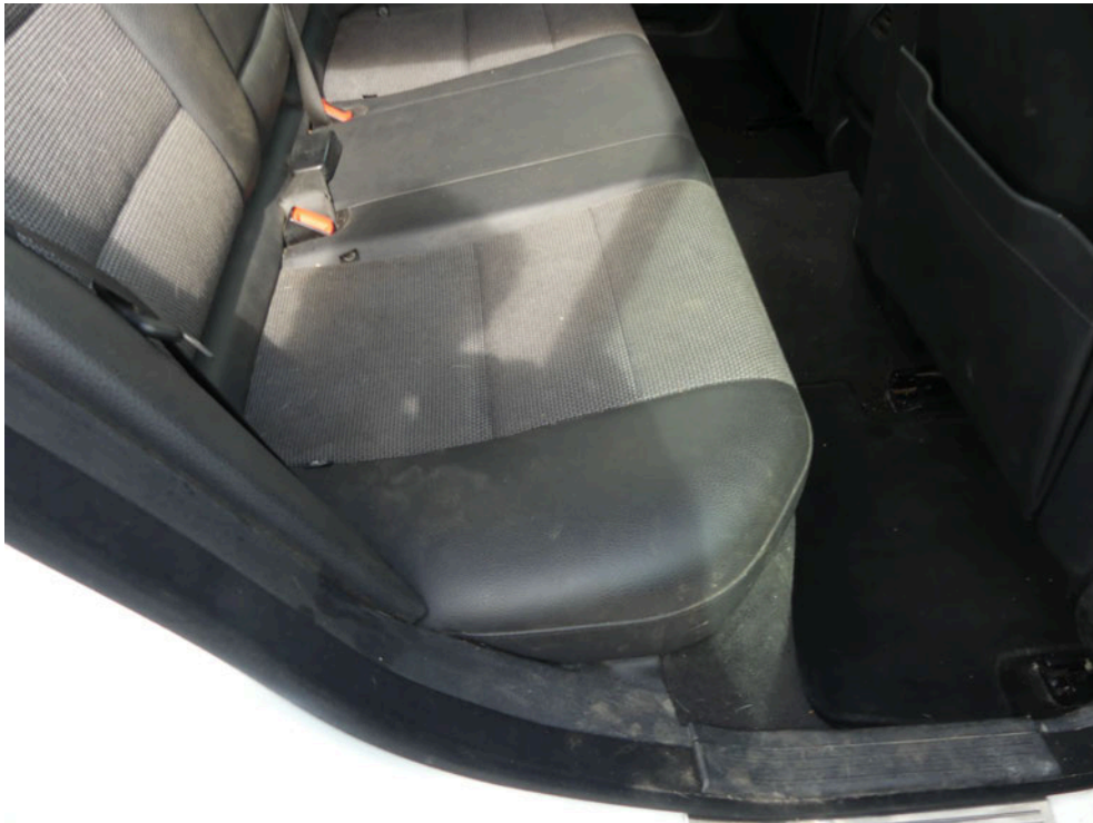
Bild: 33 Einzelansicht Rücksitzbank