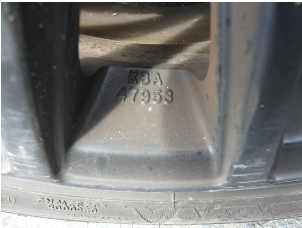
Bild: 45 Ausweisung KBA Nummer LM-Felgen.