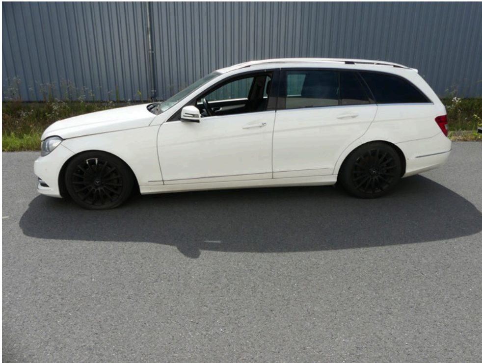
Bild: 7 Seitenansicht von links