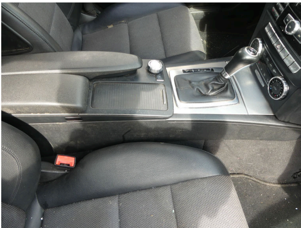
Bild: 36 Detailansicht Innenraum