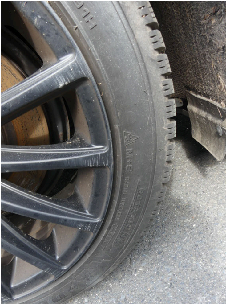
Bild: 43 LM-Felge streifend in der Farbgebung markiert.