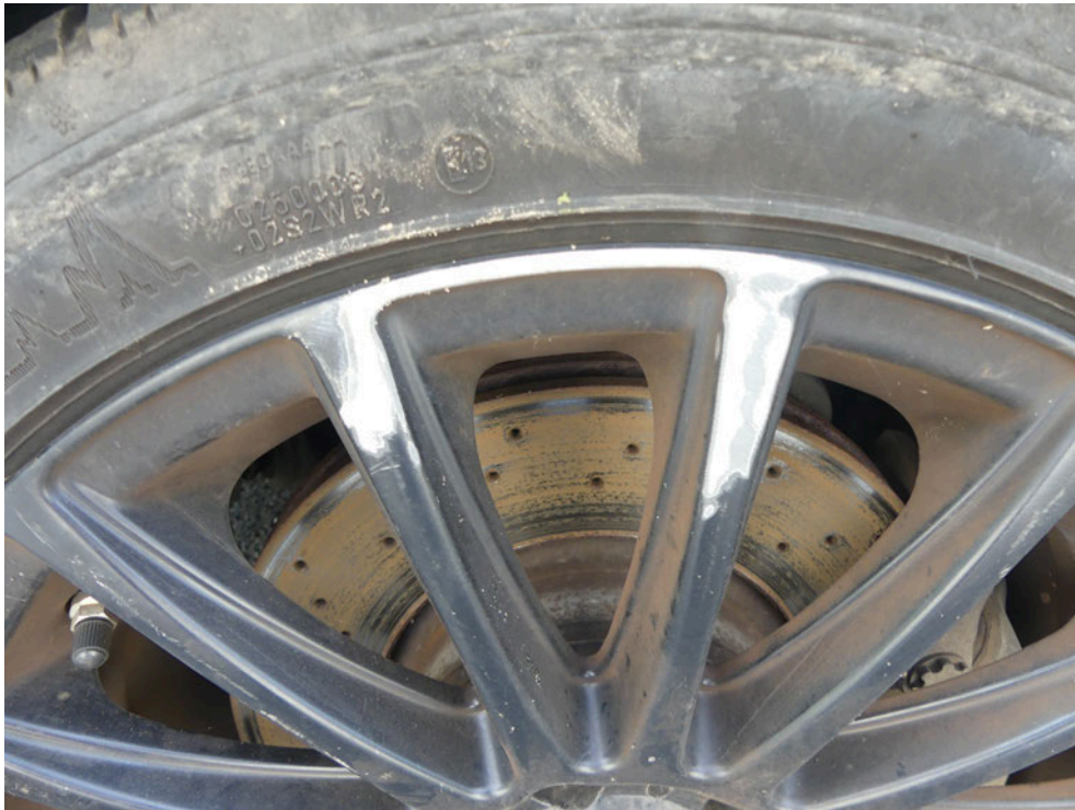
Bild: 39 Detailansicht LM-Felge, diese ist streifend in der Oberfläche beschädigt.