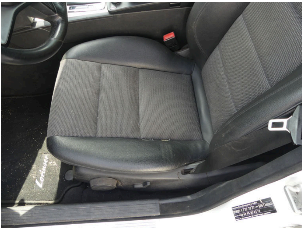
Bild: 67 Detailansicht Fahrersitz ...