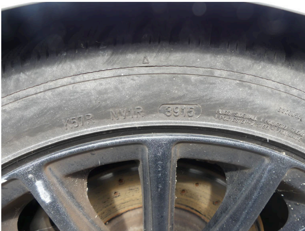
Bild: 49 Ausweisung der DOT Nummer der Radialreifen