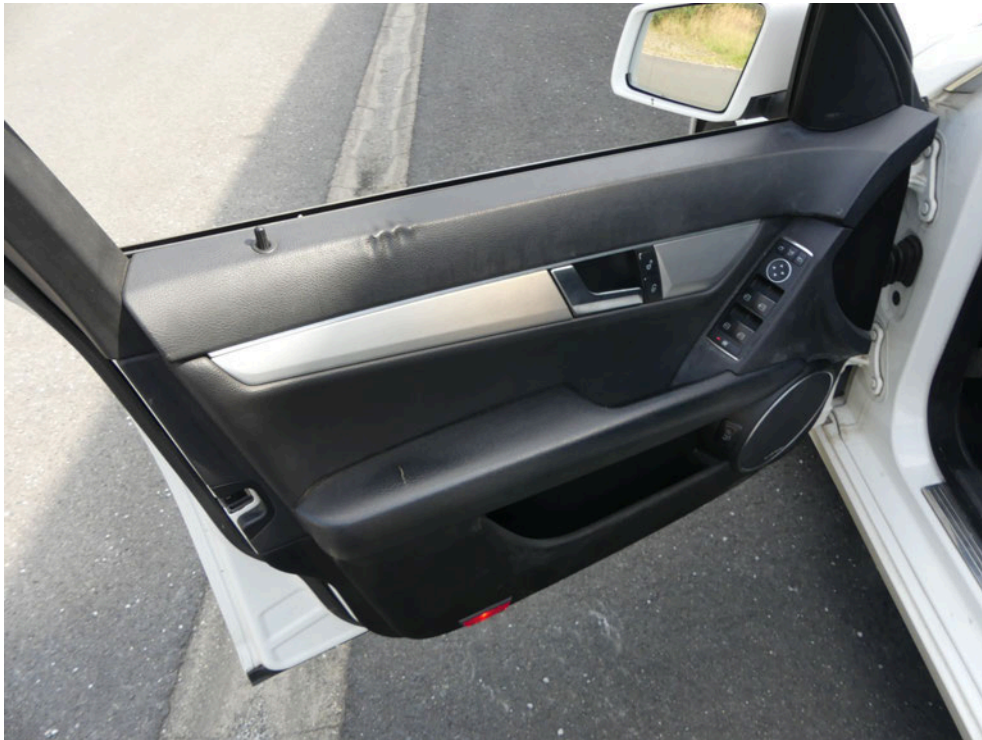
Bild: 64 Ansicht Türverkleidung links, diese ist mehrfach ....