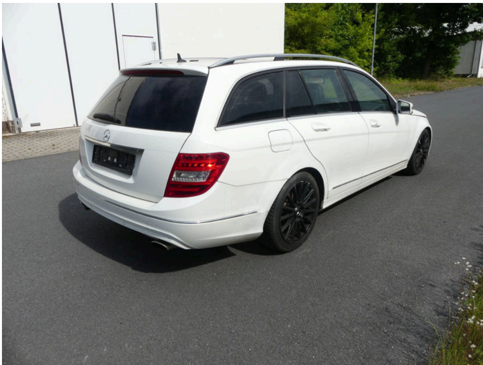
Bild: 4 Diagonalansicht