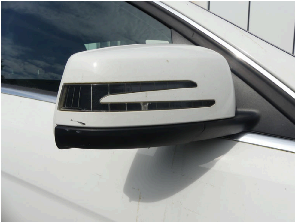
Bild: 56 Ansicht Abdeckung Außenspiegel rechts.