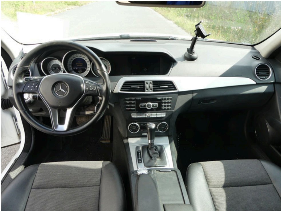
Bild: 23 Übersichtsaufnahme Innenraum