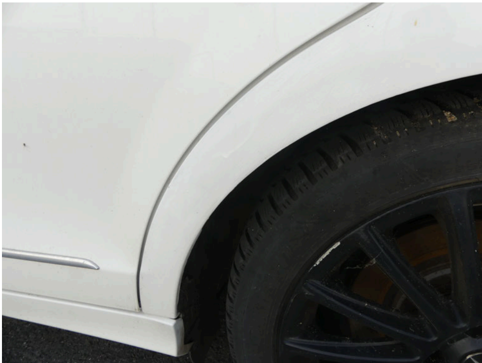
Bild: 62 ... diese ist ebenfalls mittels Spraydose nachlackiert worden.