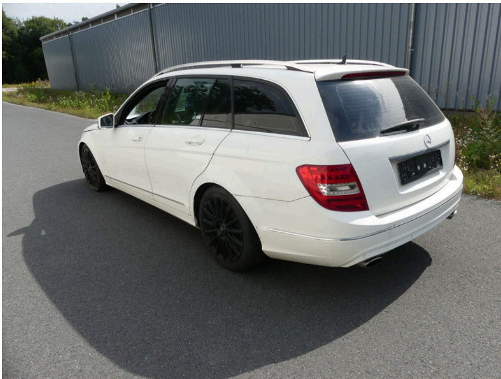
Bild: 2 Diagonalansicht