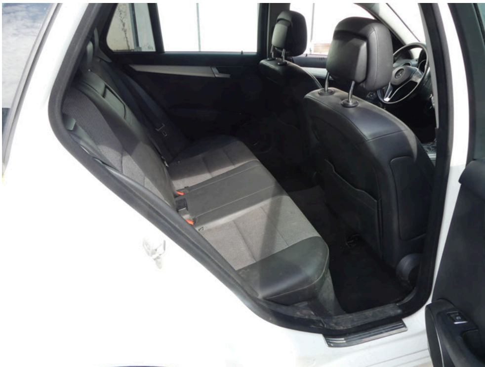
Bild: 32 Innenraum, hinten rechts