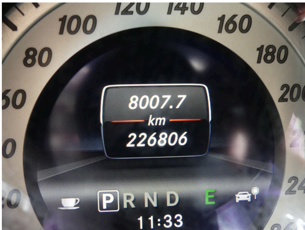
Bild: 22 Ausweisung der abgelesenen Gesamtlaufleistung zum Zeitpunkt der Besichtigung.