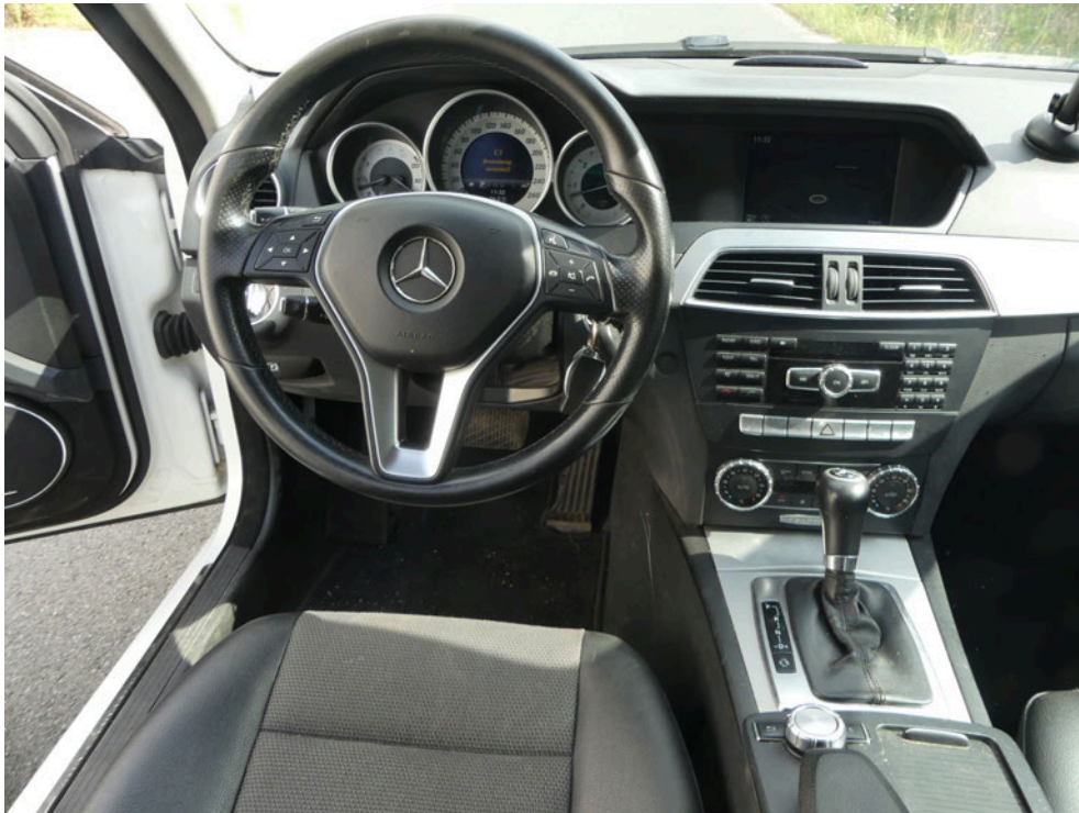
Bild: 21 Detailansicht Innenraum