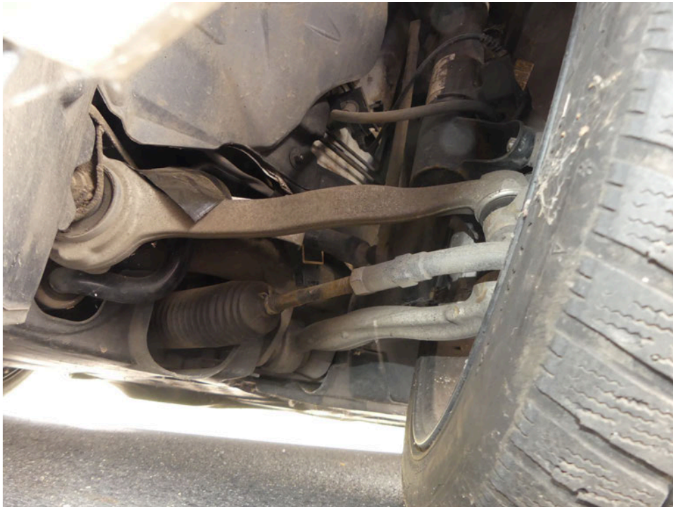
Bild: 13 Ansicht Vorderachse links