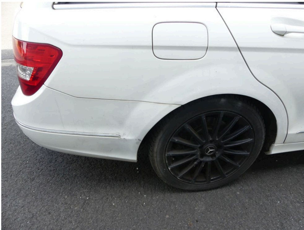
Bild: 57 Ansicht Seitenwand rechts ....