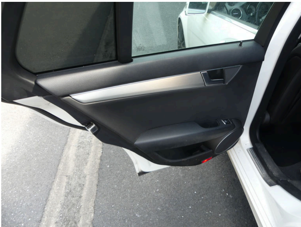
Bild: 26 Ansicht Türverkleidung hinten links