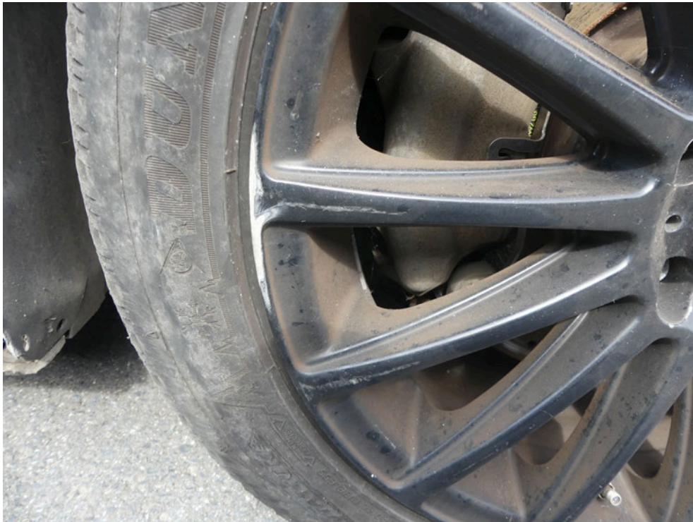
Bild: 48 Detailansicht, die LM-Felge ist streifend beschädigt.