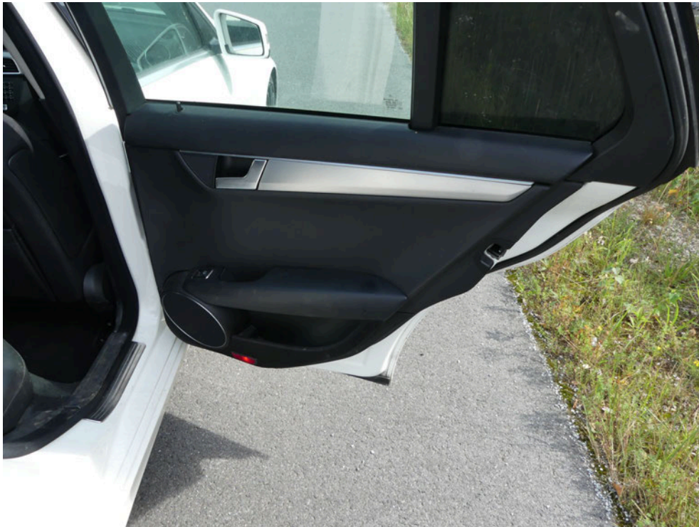
Bild: 31 Ansicht Türverkleidung hinten rechts