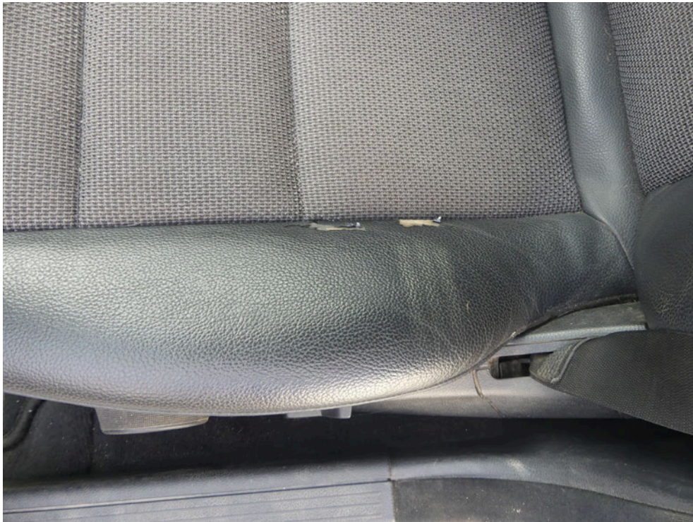
Bild: 68 ... das Sitzpolster ist im Bereich der seitliche Sitzwange beschädigt.