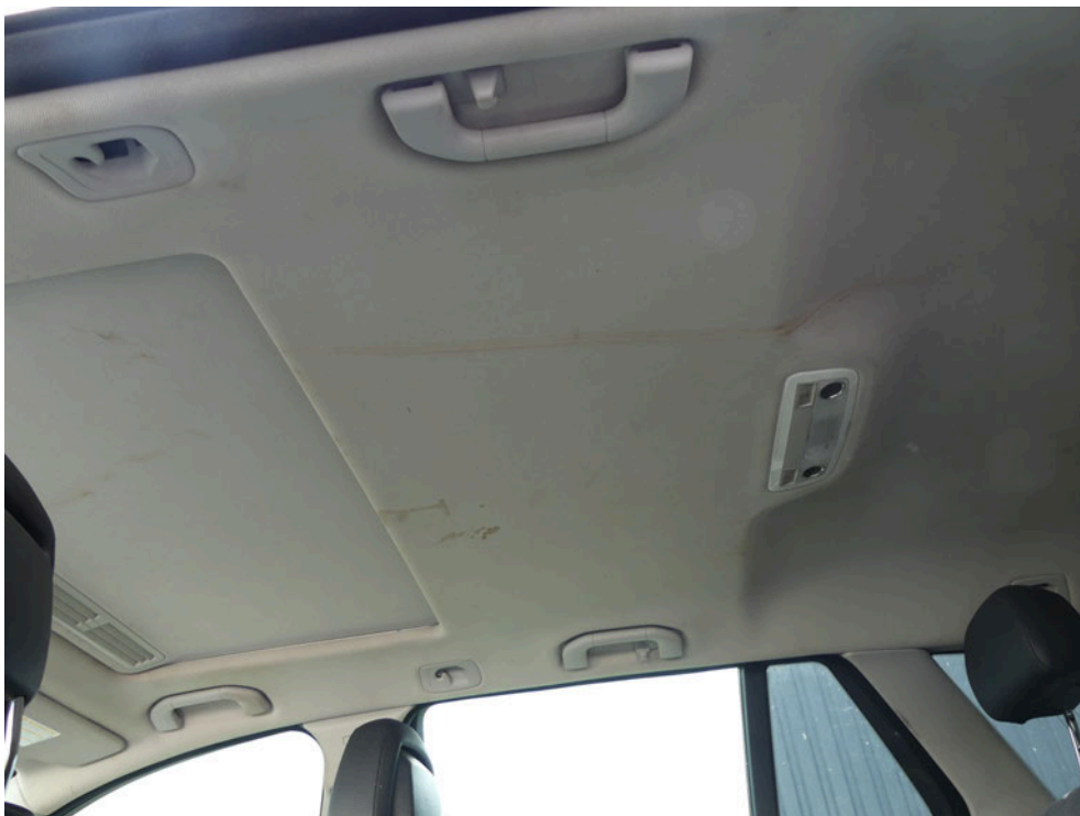
Bild: 24 Einzelansicht Innenhimmel, dieser ist verschmutzt.