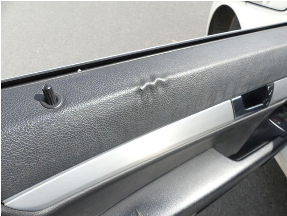
Bild: 66 ... sichtbar beschädigt.