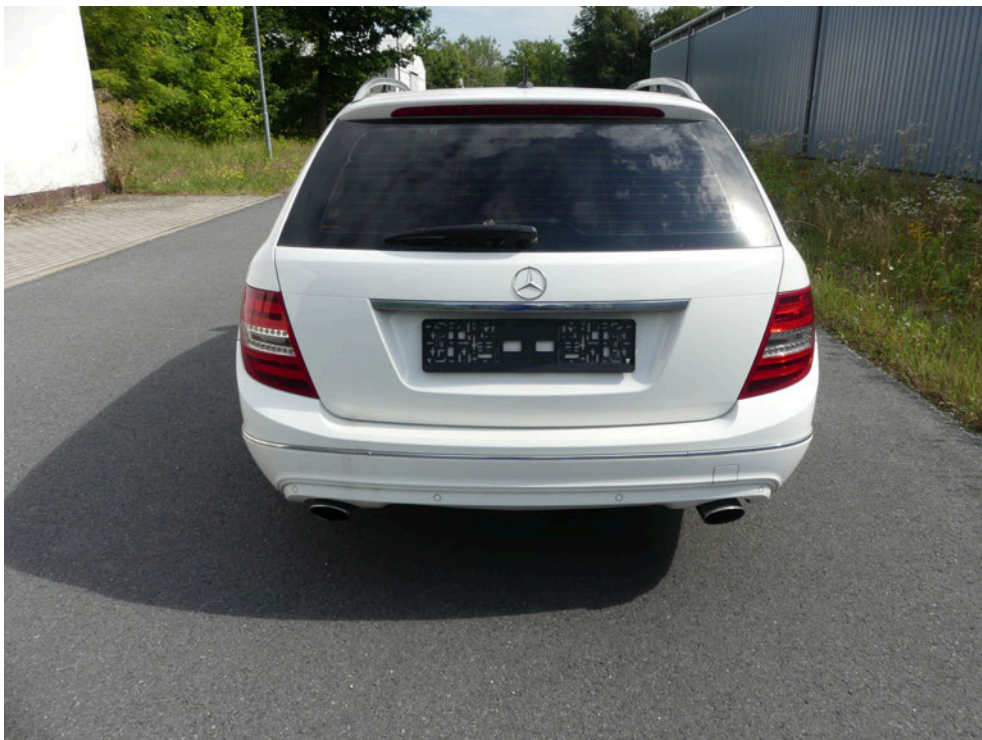
Bild: 6 Heckansicht