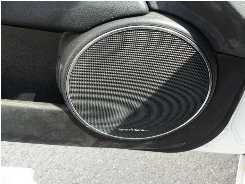
Bild: 19 Detailansicht, Ausweisung Harman Kardon Akustiksystem