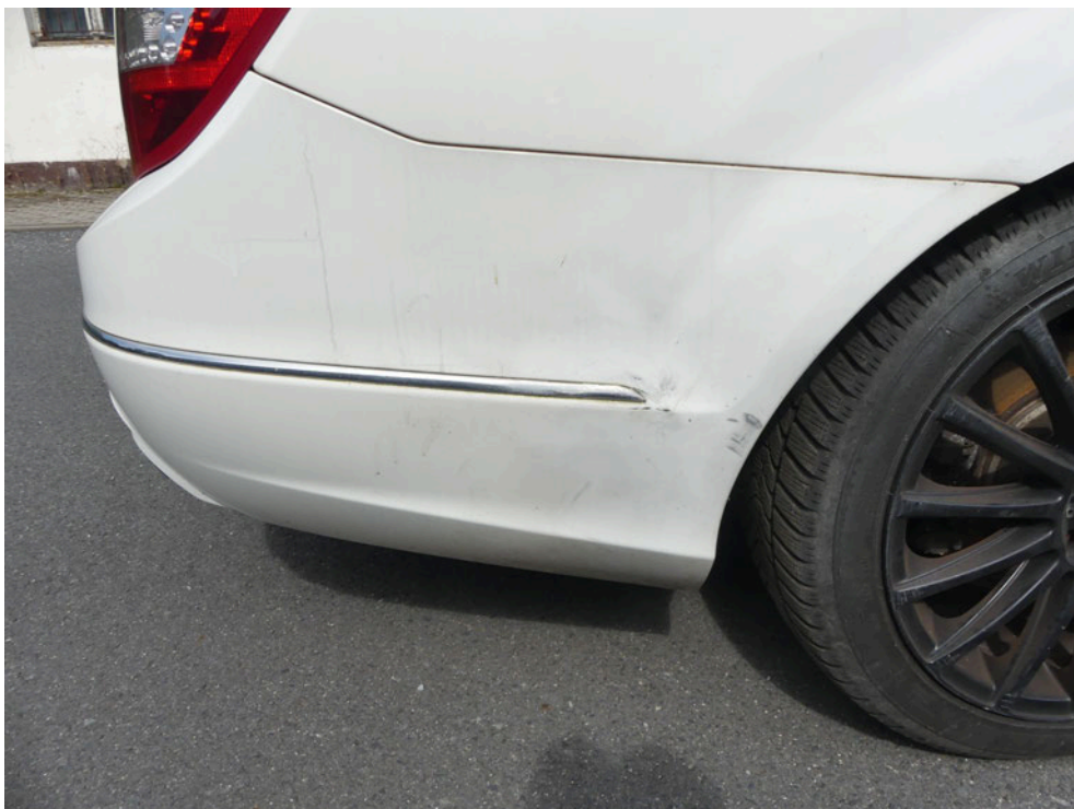
Bild: 59 .... auslaufend ist die Heckverkleidung rechts ebenfalls mittels Spraydose überlackiert worden.