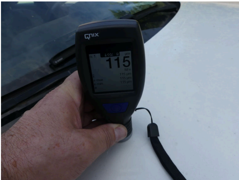
Bild: 10 Ausweisung Lackschichtdickenmessung vorgenommen, Messwerte dem beiliegenden Protokoll entnehmen.