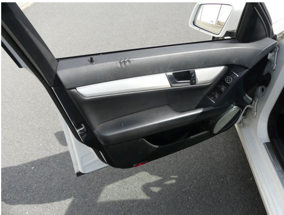
Bild: 18 Ansicht Türverkleidung vorn links