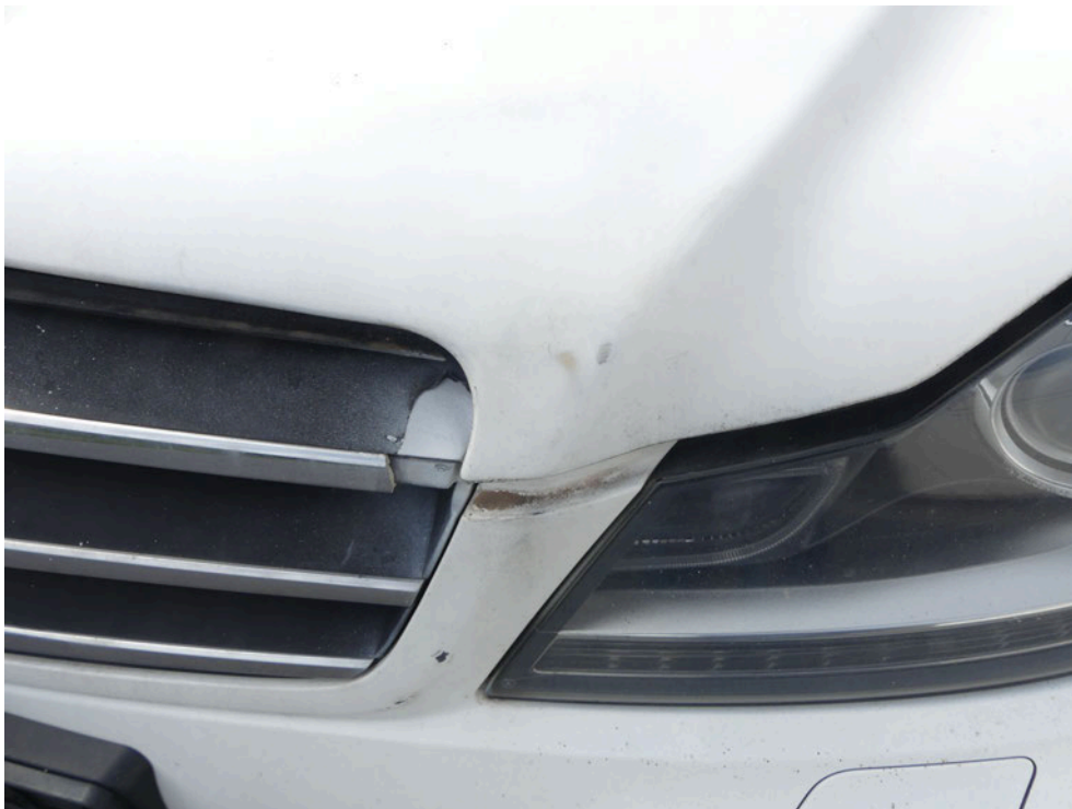
Bild: 50 Kühlergrill partiell ausgebrochen, Motorhaube in der Endspitze nachlackiert.