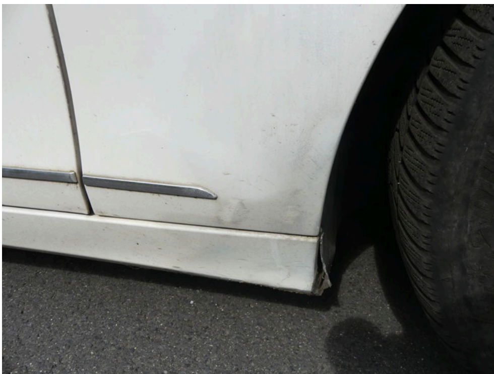
Bild: 53 Kotflügel instandgesetzt und nachlackiert. (nicht fachgerecht nachlackiert)