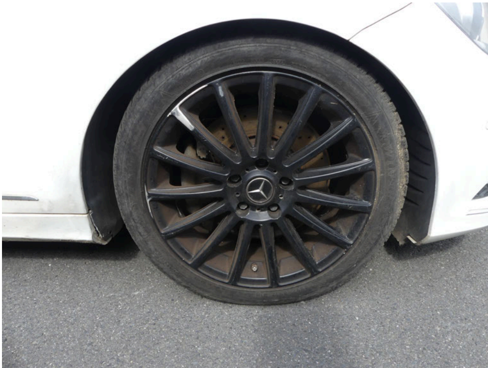
Bild: 46 Ansicht Rad/Reifenkombination vorn rechts