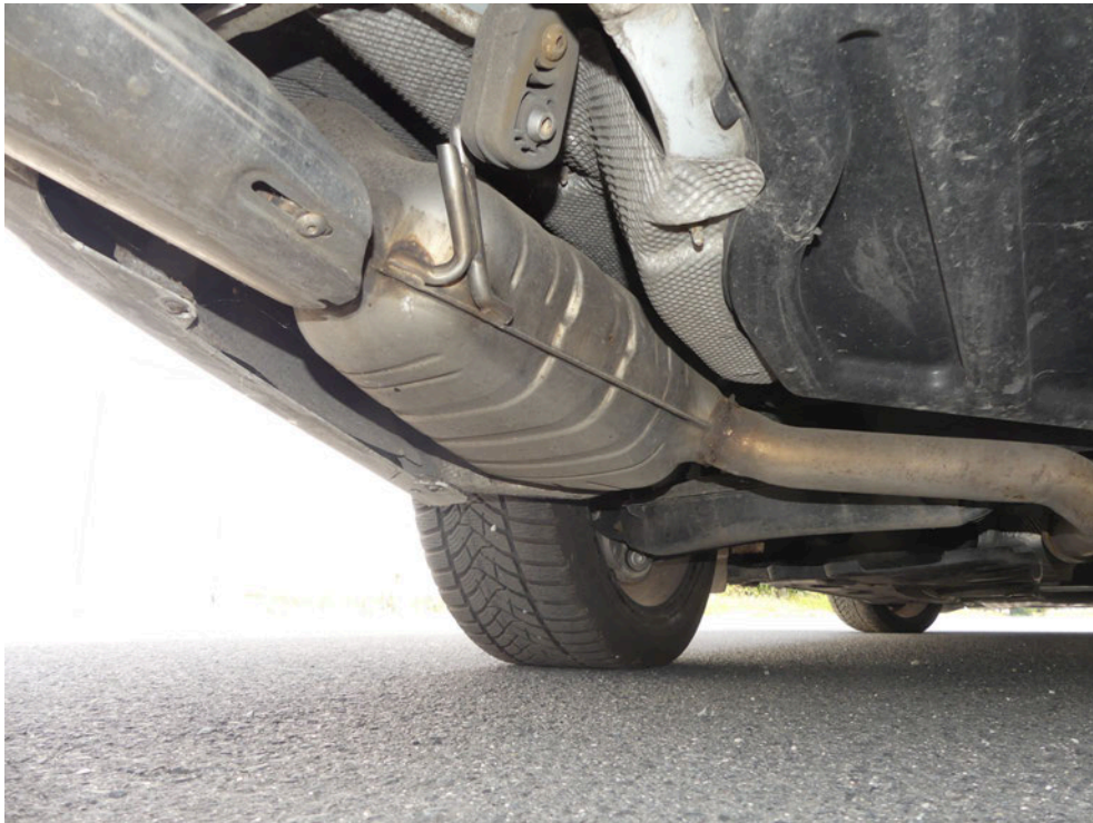
Bild: 15 Ansicht Abgasanlage links