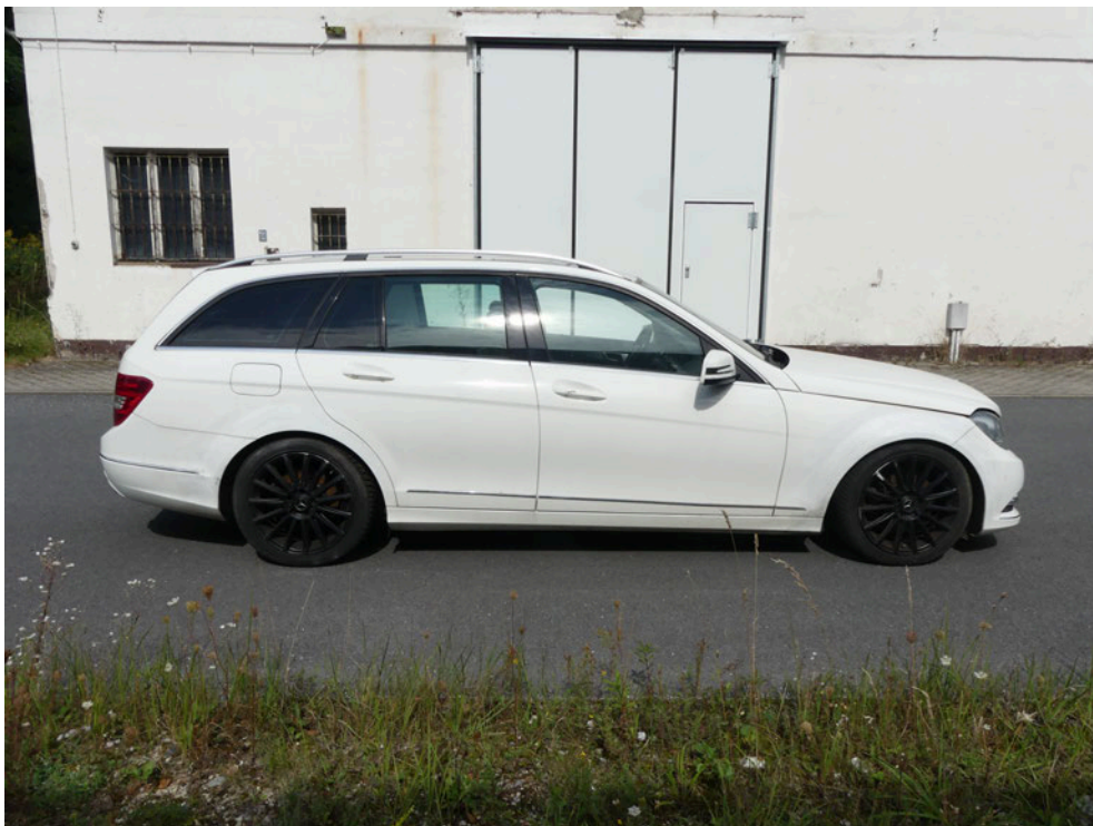
Bild: 8 Seitenansicht von rechts