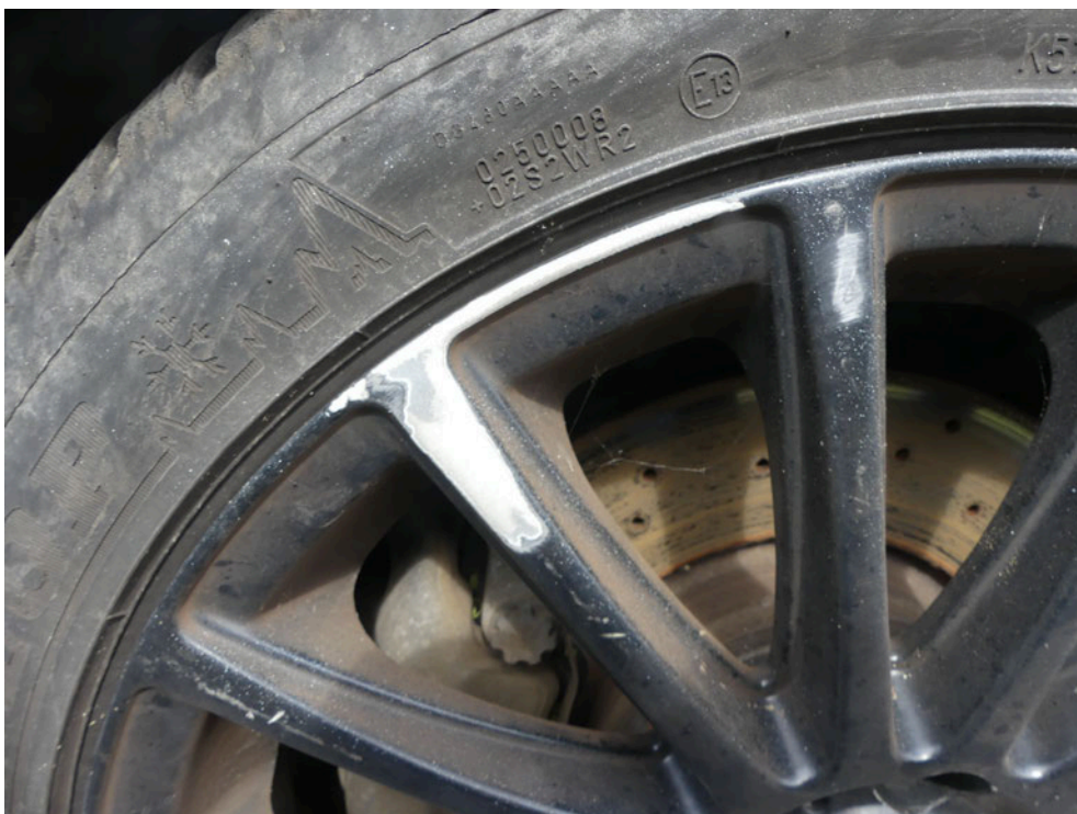
Bild: 47 Detailansicht, die LM-Felge ist beschädigt.