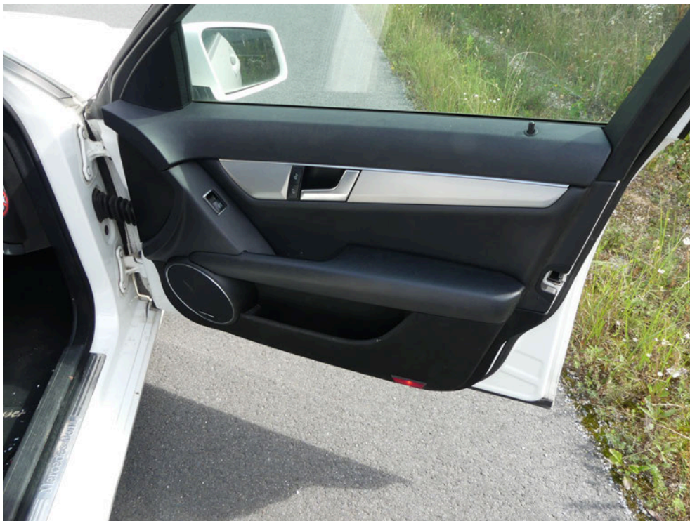
Bild: 34 Ansicht Türverkleidung vorn rechts