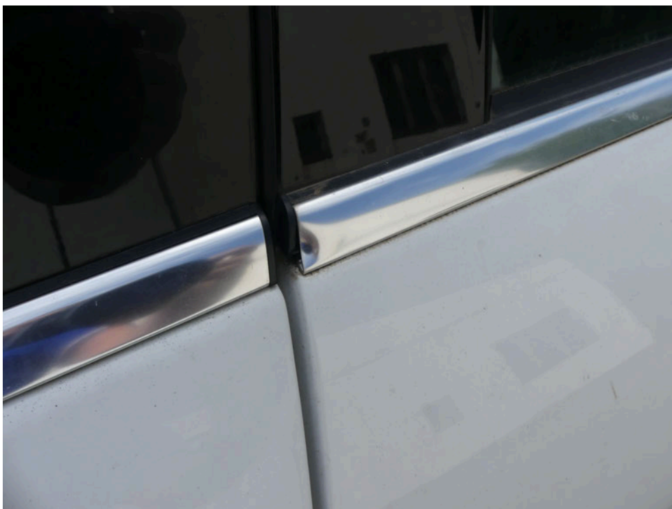
Bild: 63 Fensterschachtleiste Tür hinten links partiell gestaucht.