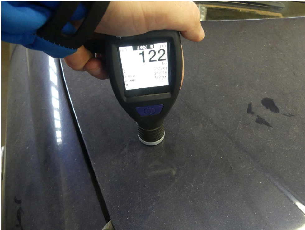
Bild: 43 Ausweisung Lackschichtdickenmessung vorgenommen, Messwerte dem beiliegenden Protokoll entnehmen.