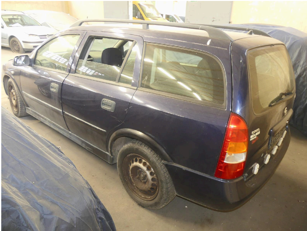
Bild: 3 Diagonalansicht hinten links