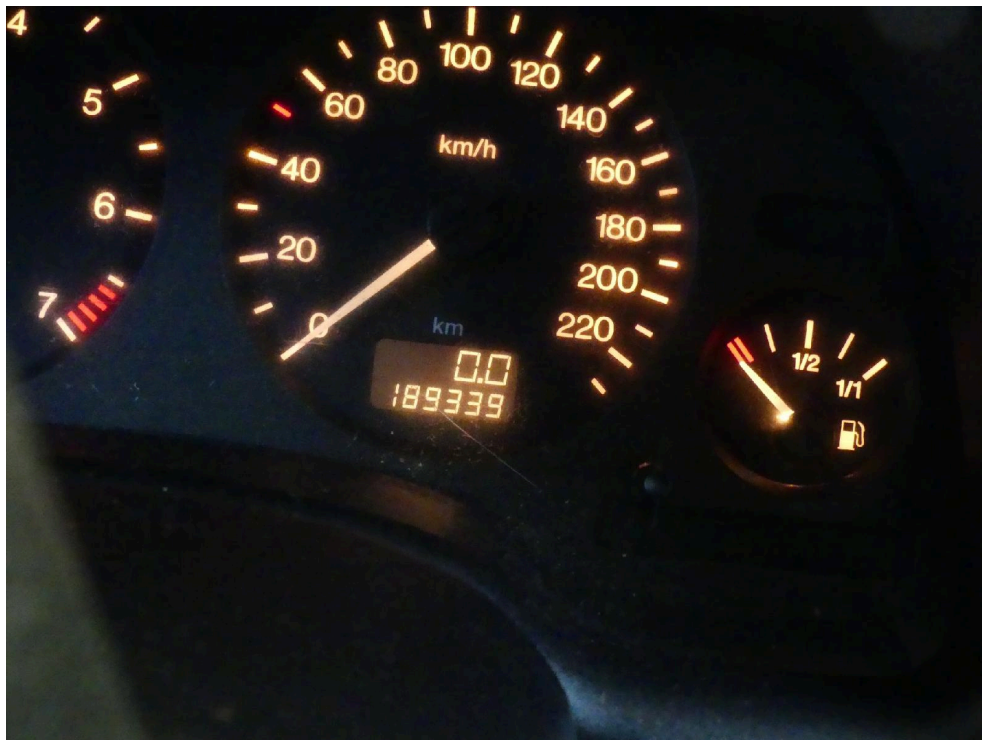
Bild: 12 Ausweisung der abgelesenen Gesamtlauflistung zum Zeitpunkt der Besichtigung.