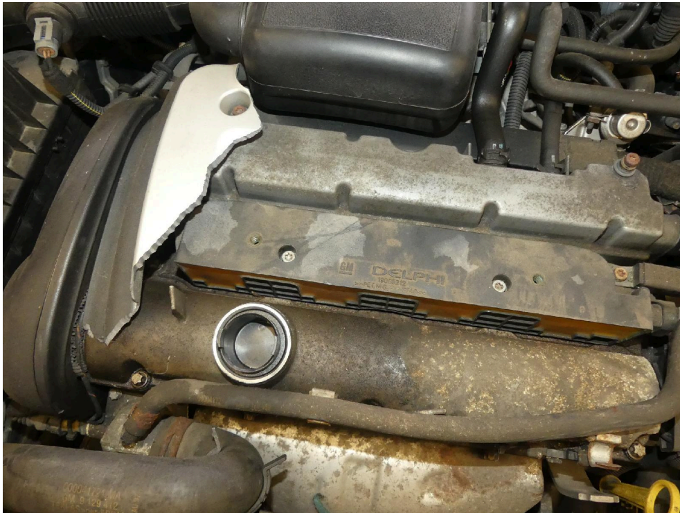
Bild: 29 Anbauteile Motor fehlen