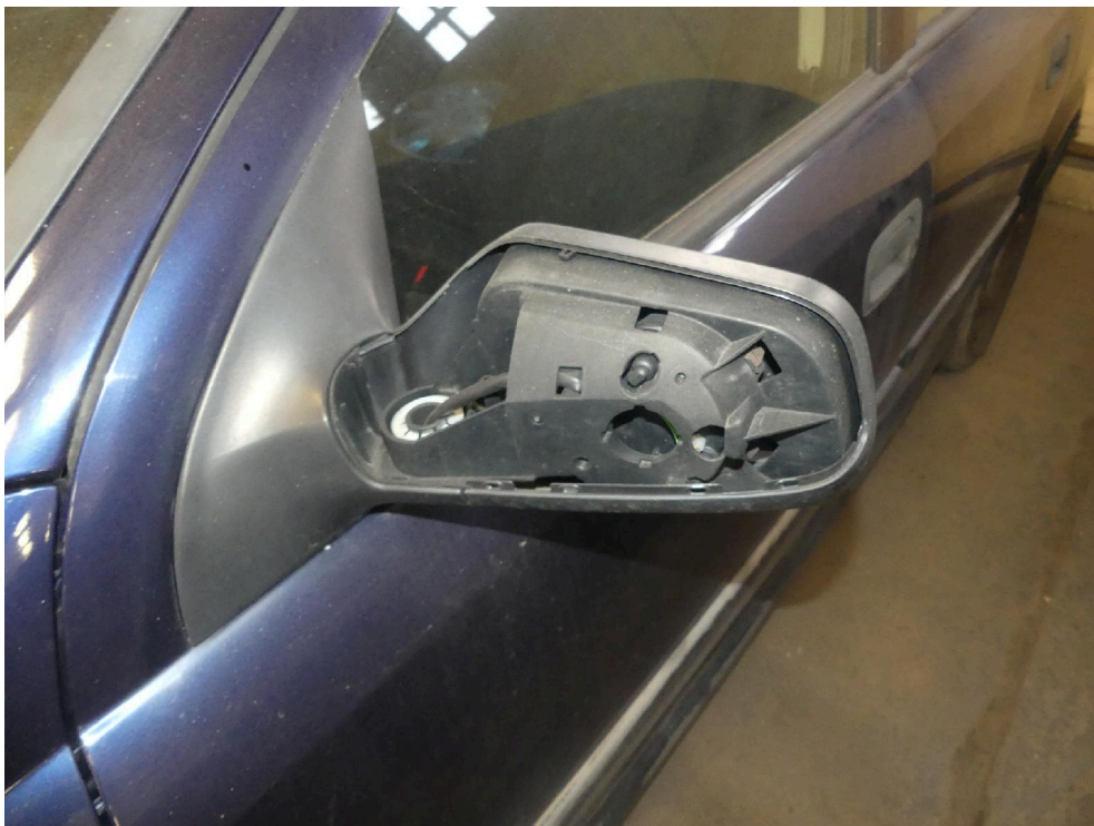
Bild: 38 Abdeckkappe fehlt