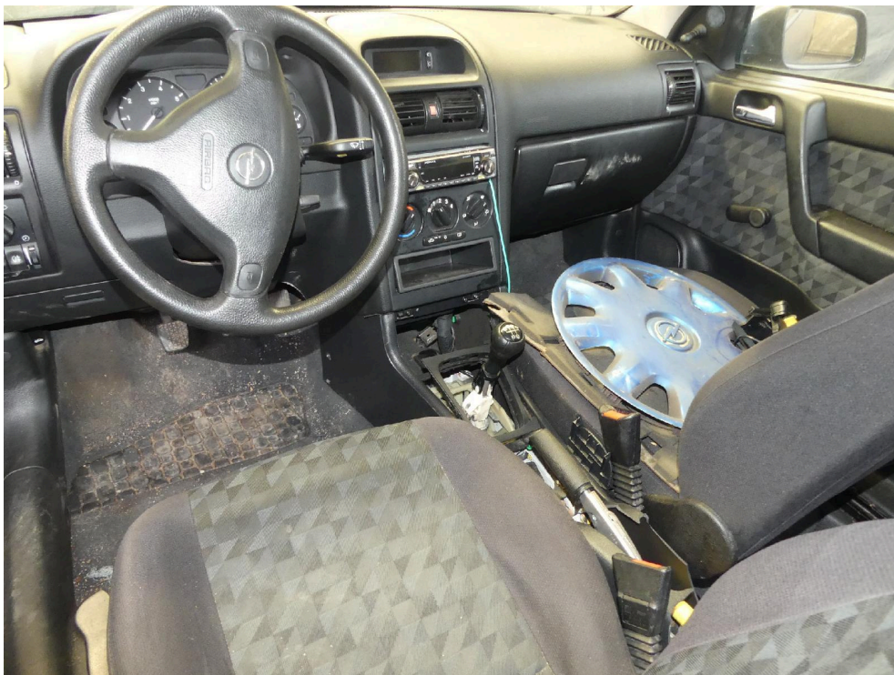
Bild: 10 Detailansicht Innenraum