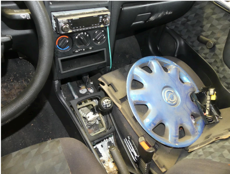
Bild: 11 Detailansicht Innenraum