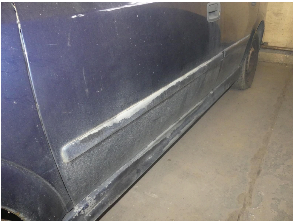
Bild: 6 Detailansicht Schutzleiste Fahrertür.