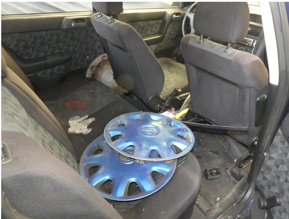
Bild: 24 Innenraum, hinten rechts