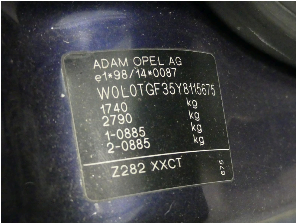
Bild: 13 Ausweisung Fahrzeugidentnummer