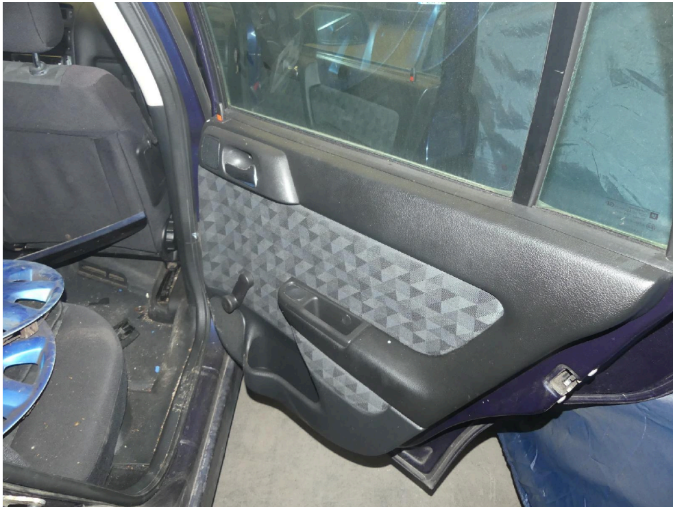
Bild: 23 Ansicht Türverkleidung hinten rechts