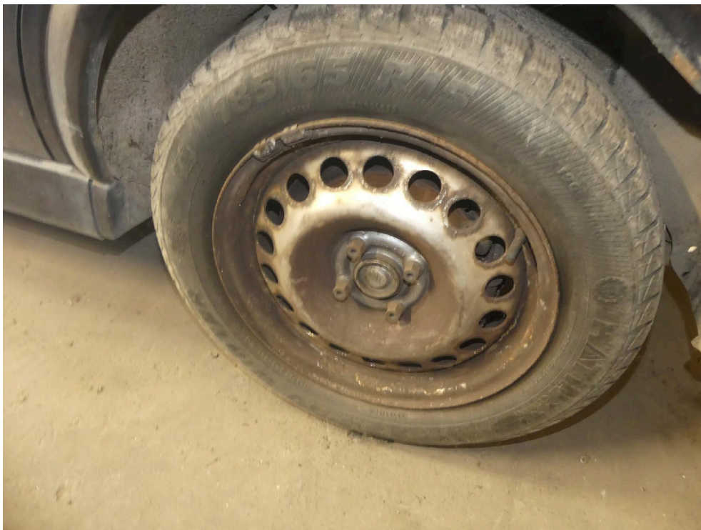
Bild: 34 Ansicht Rad/Reifenkombination hinten links