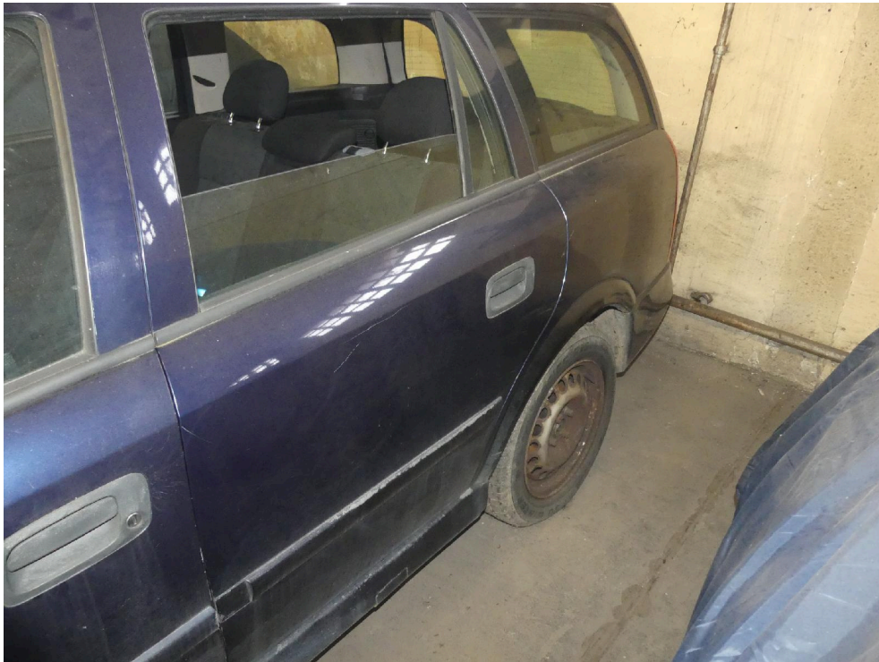
Bild: 5 Seitliche Darstellung