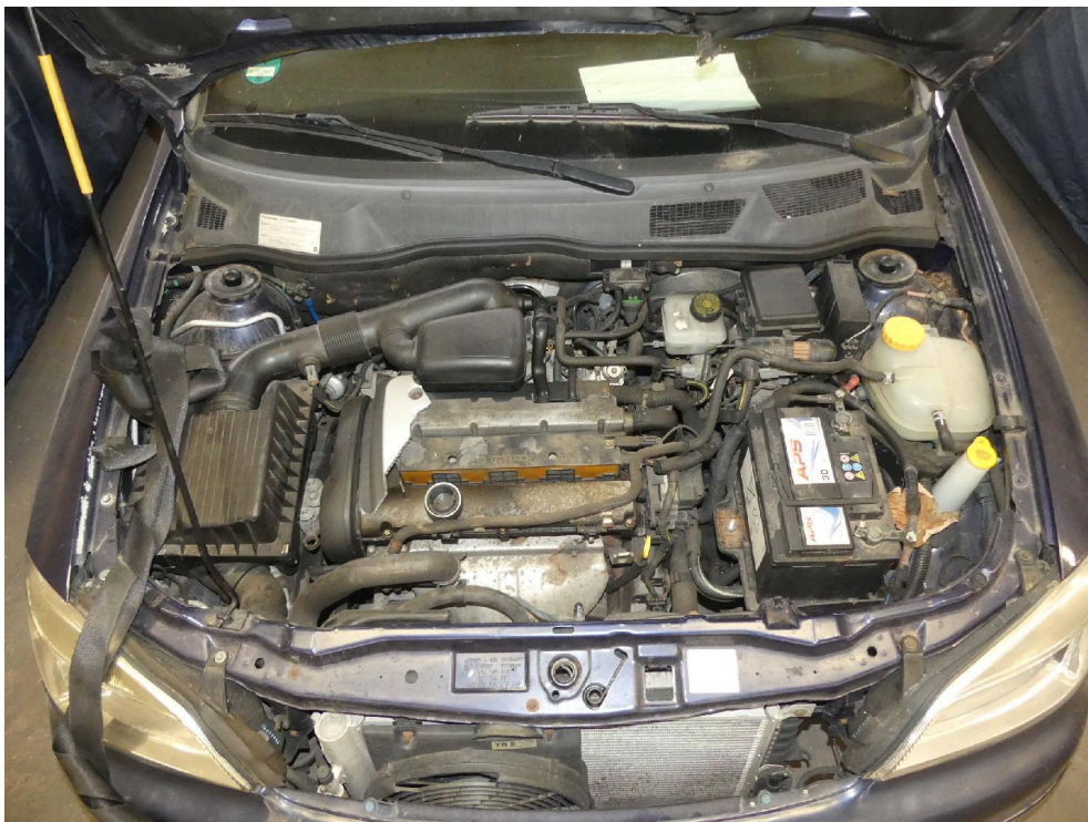
Bild: 28 Ansicht Antriebsaggregat