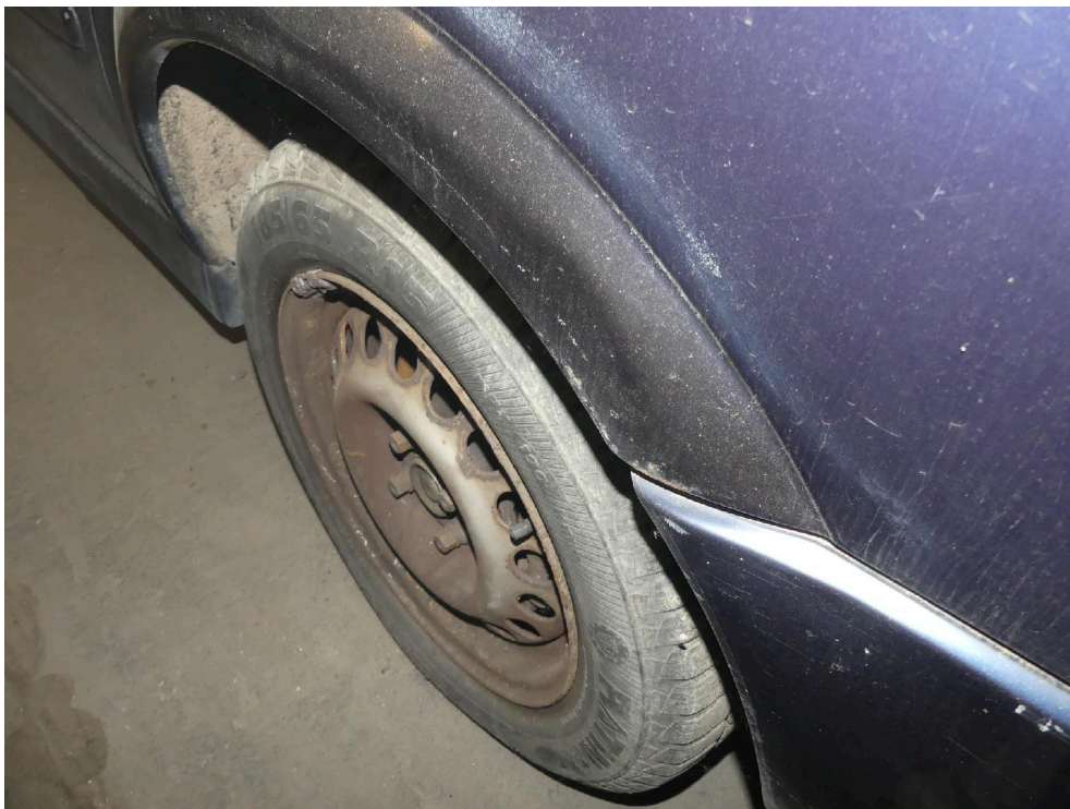
Bild: 40 Radlauf hinten links - nachlackiert schwarz Sprayflasche