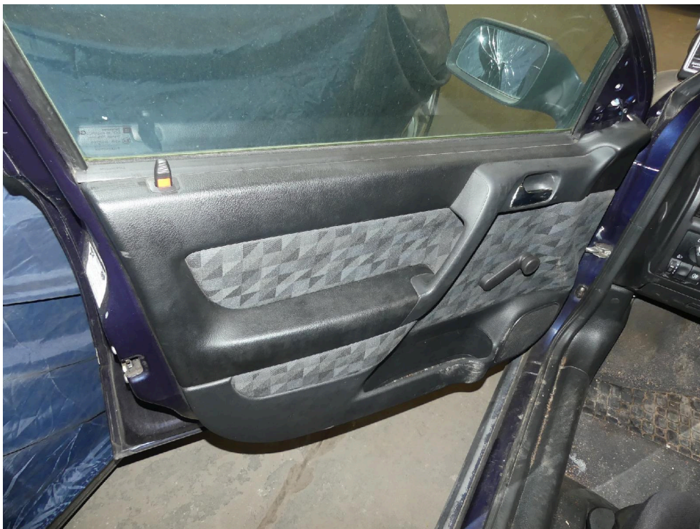
Bild: 8 Ansicht Türverkleidung vorn links