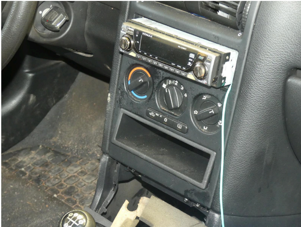
Bild: 27 Detailansicht Innenraum