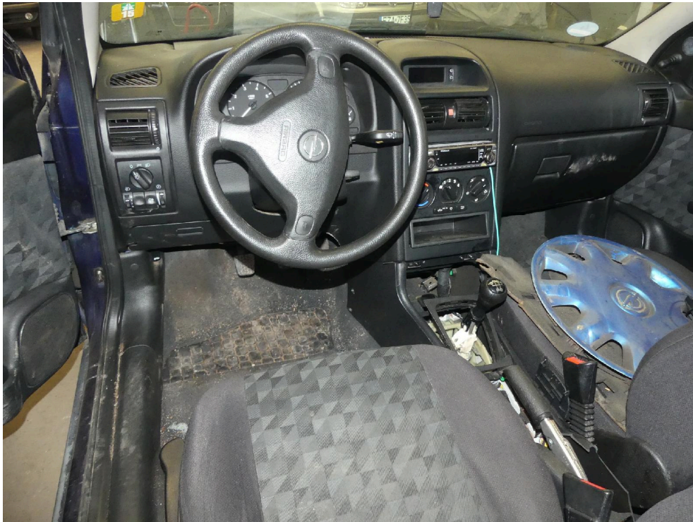
Bild: 9 Innenraum, vorn links