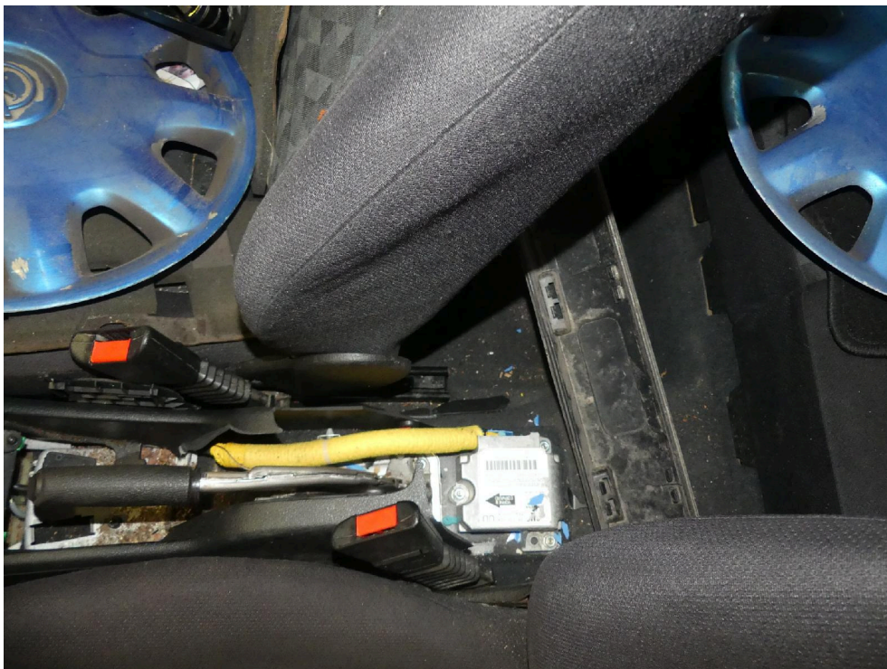
Bild: 14 Detailansicht Innenraum