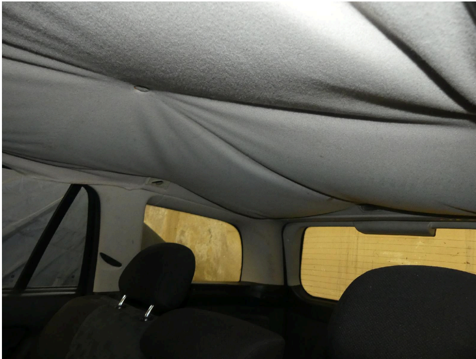
Bild: 19 Himmel innen abgelöst.