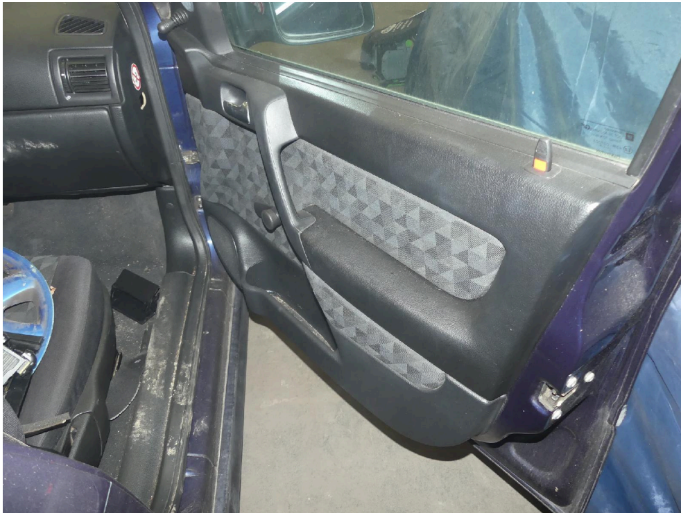
Bild: 25 Ansicht Türverkleidung vorn rechts