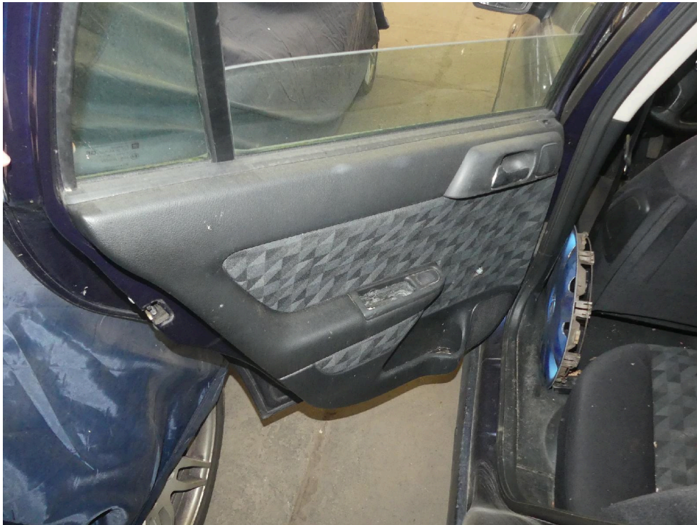
Bild: 15 Ansicht Türverkleidung hinten links