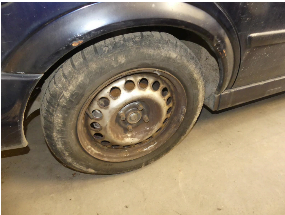
Bild: 32 Ansicht Rad/Reifenkombination hinten rechts