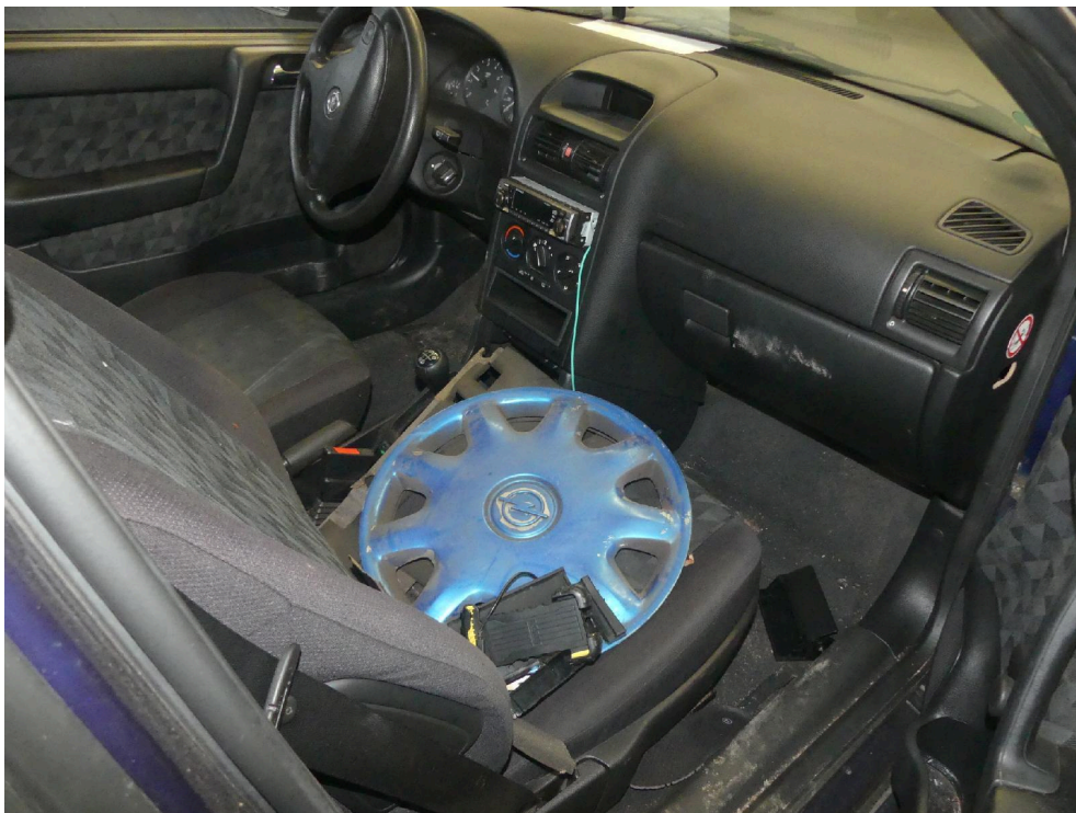
Bild: 26 Innenraum, vorn rechts