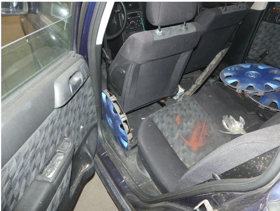
Bild: 16 Innenraum, hinten links