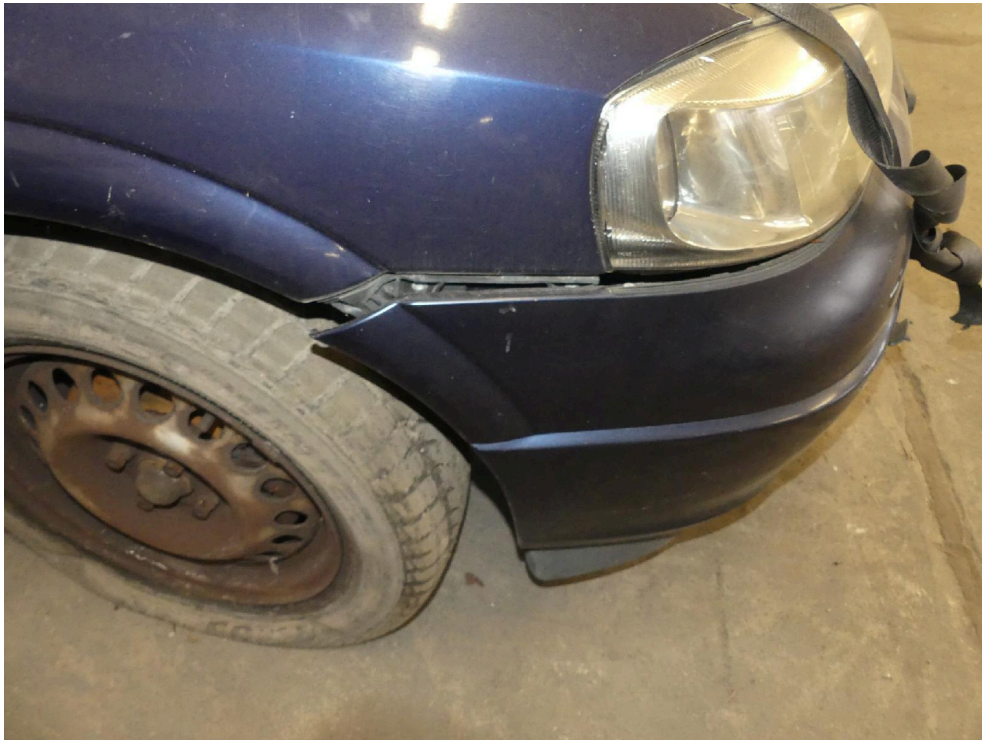
Bild: 35 Frontverkleidung rechtsseitig lose.