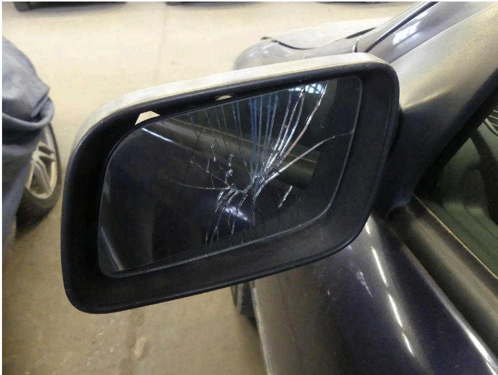
Bild: 39 Ansicht Außenspiegel links.