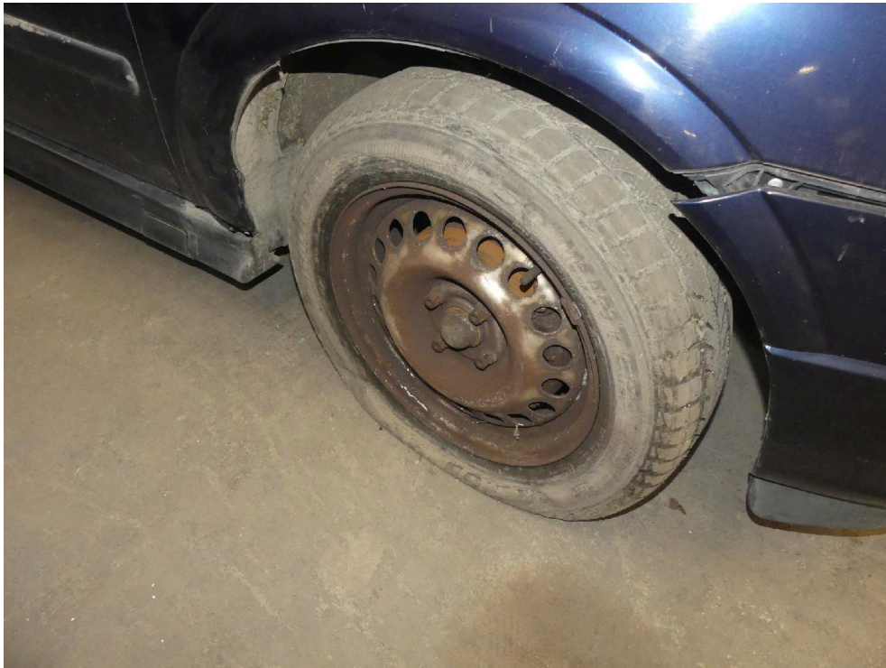
Bild: 33 Ansicht Rad/Reifenkombination vorn rechts, diese ist drucklos !