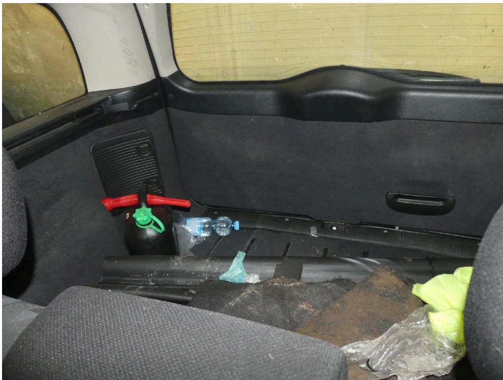
Bild: 20 Detailansicht Kofferraum