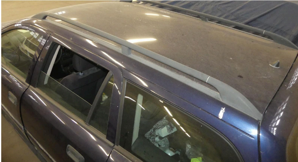
Bild: 7 Ansicht Fahrzeugdach