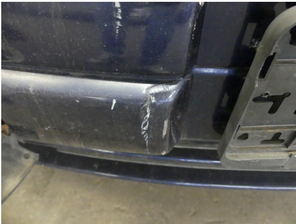
Bild: 36 Frontverkleidung deformiert im Bereich Kennzeichen.