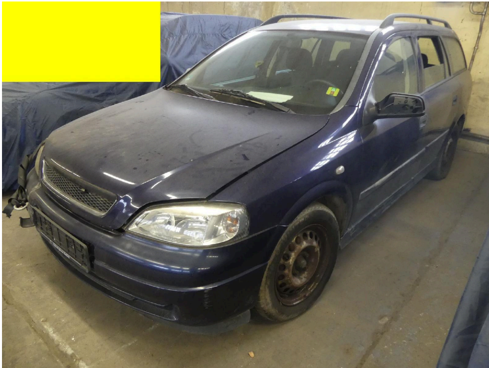
Bild: 1 Diagonalansicht vorn links