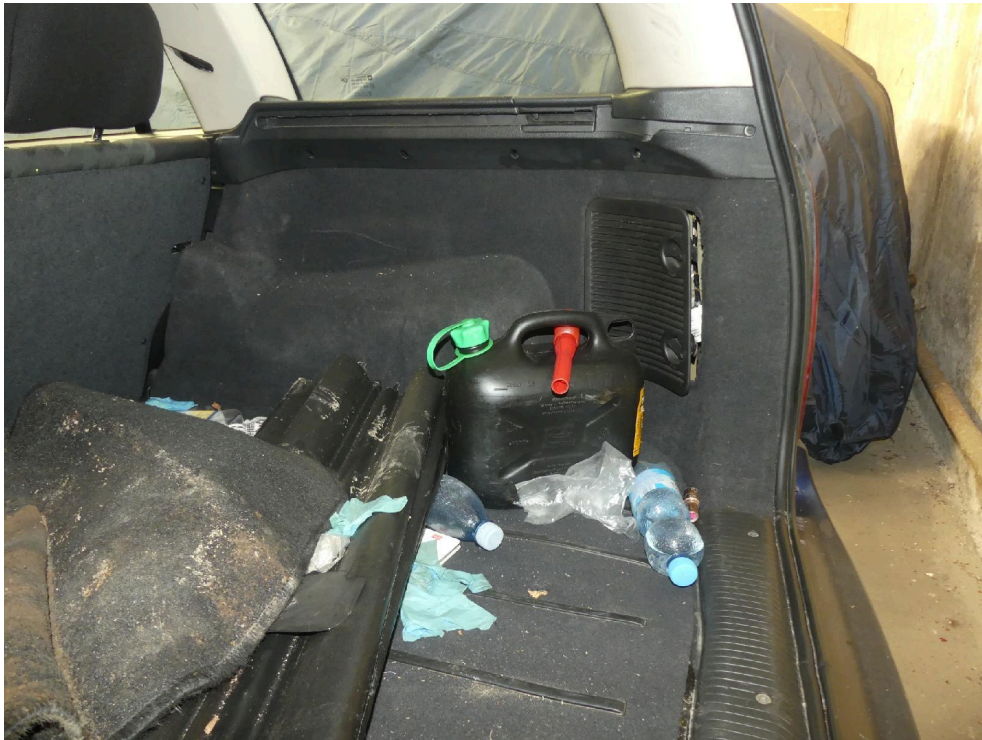
Bild: 21 Einzeldarstellung Kofferraum