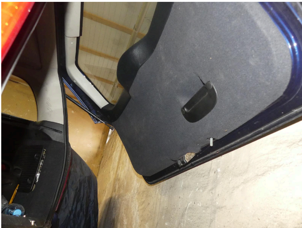
Bild: 22 Detaillierte Darstellung Heckklappe