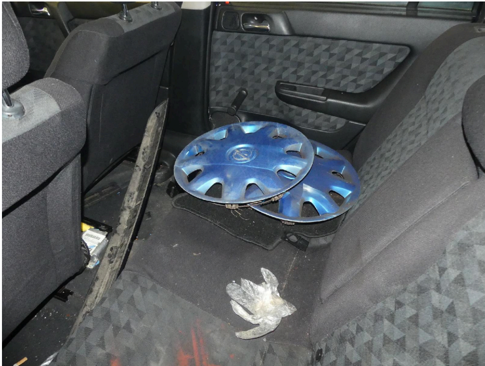
Bild: 17 Detailansicht Fondsitzbank