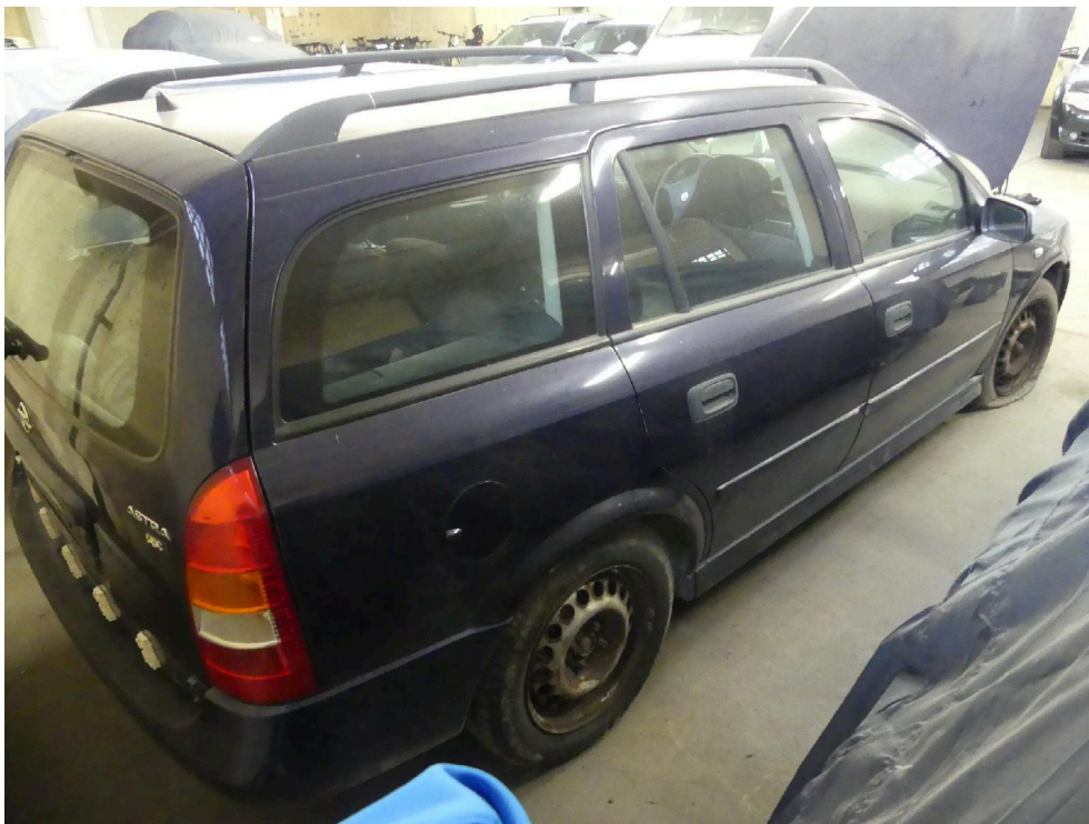
Bild: 2 Diagonalansicht hinten rechts