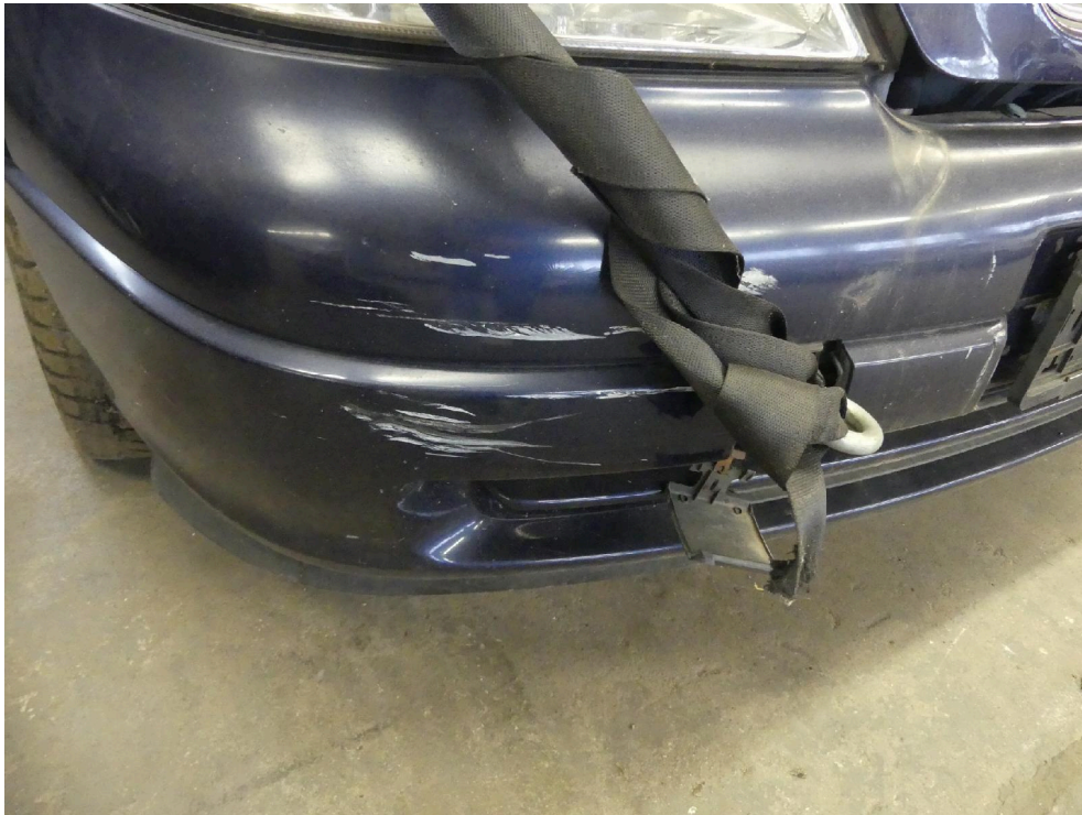
Bild: 37 Detailansicht Frontverkleidung