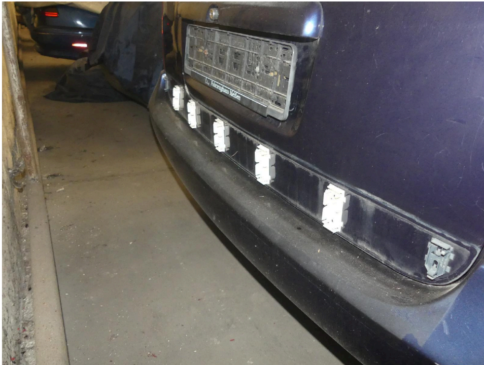
Bild: 31 Detailansicht Heckklappe, Abdeckblende fehlt.