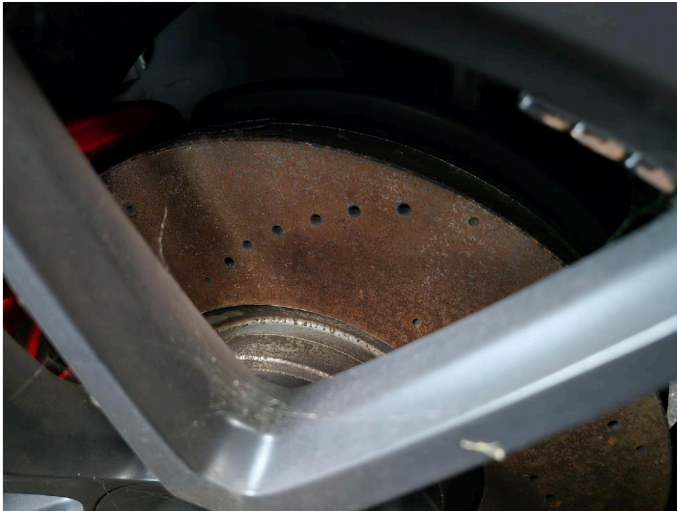
Bild: 13 Bremsscheiben, hier VR, großflächig angerostet, tw. stark