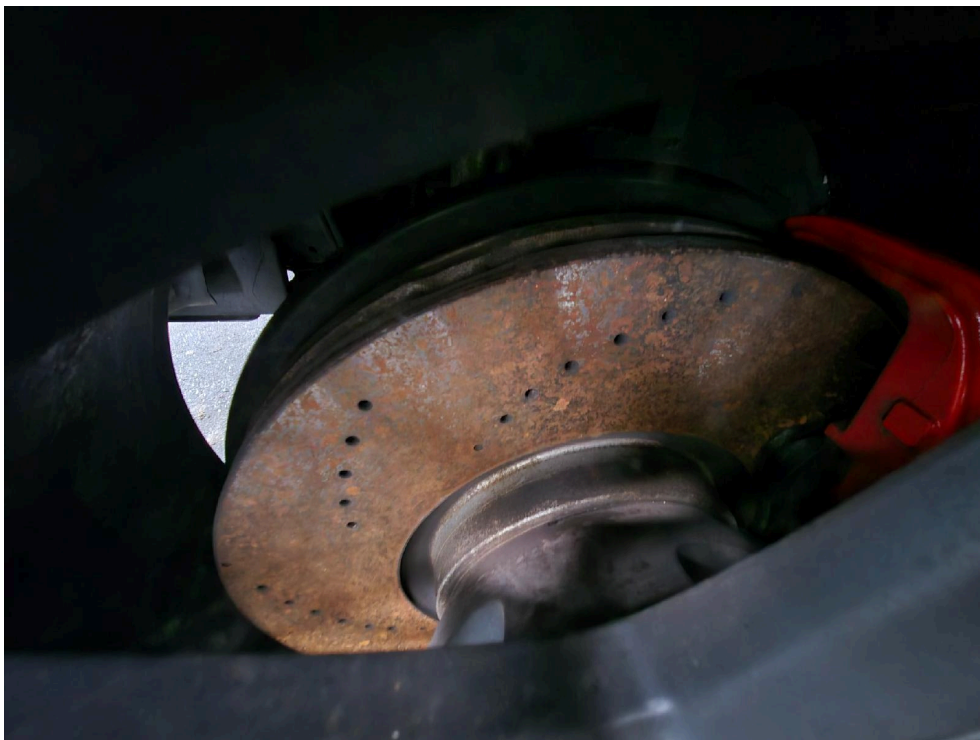
Bild: 12 Bremsscheiben, hier VL, großflächig angerostet, tw. stark