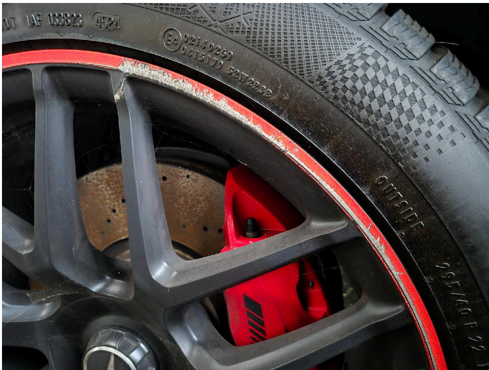
Bild: 8 Nahaufnahme: Felge VL großflächig beschädigt / Bordsteinanstöße o.ä.