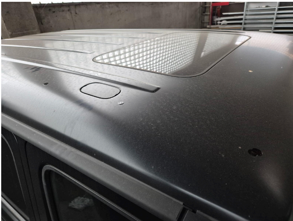
Bild: 26 Dach rechtsseitig mit div. Ölflecken