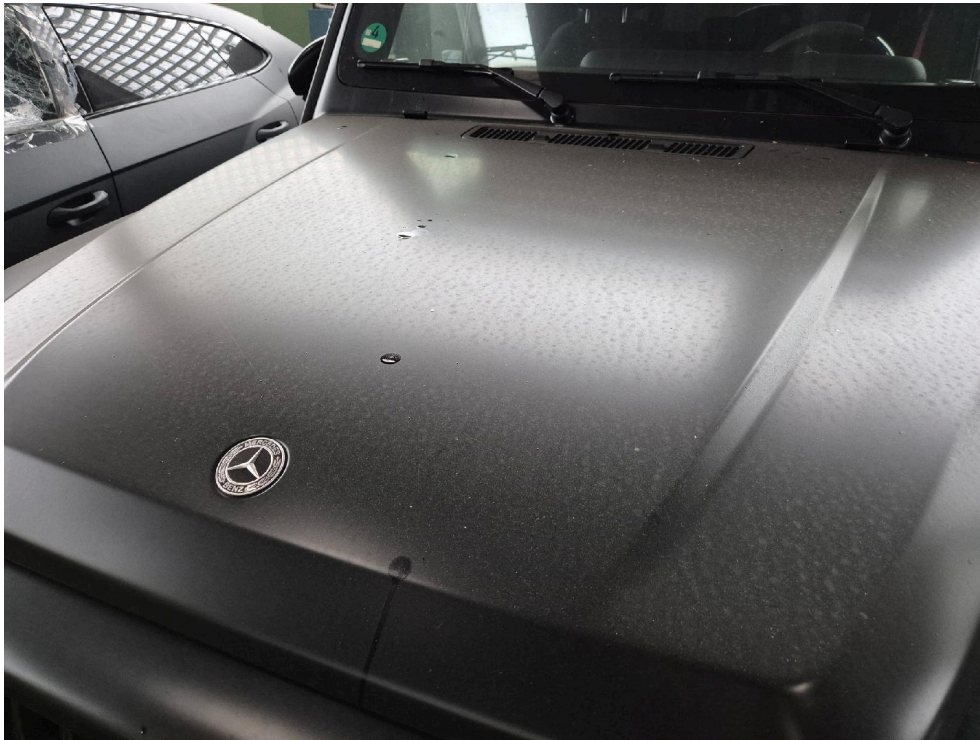
Bild: 15 Motorhaube mit diversen Ölflecken