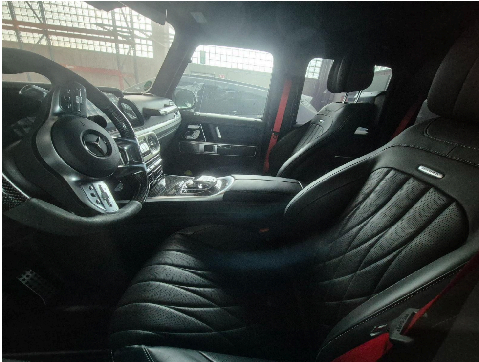
Bild: 5 Innenraumbereich