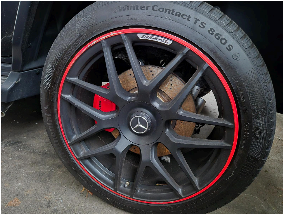
Bild: 9 Schaden: Schaden: Felge HL großflächig beschädigt / Bordsteinanstöße o.ä.