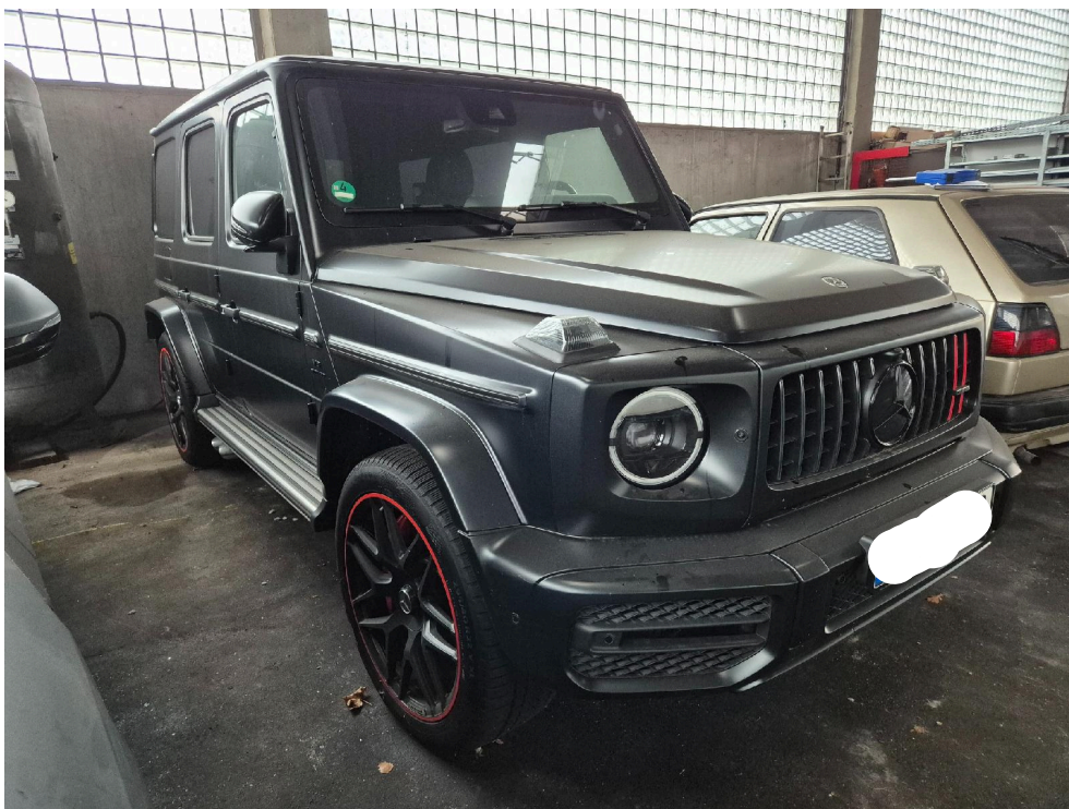
Bild: 2 Diagonale / Übersicht