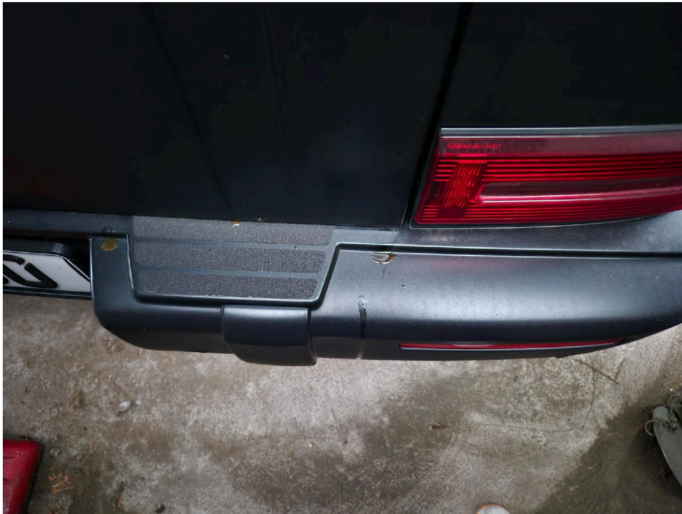
Bild: 25 Heckstoßfänger mit Ölflecken