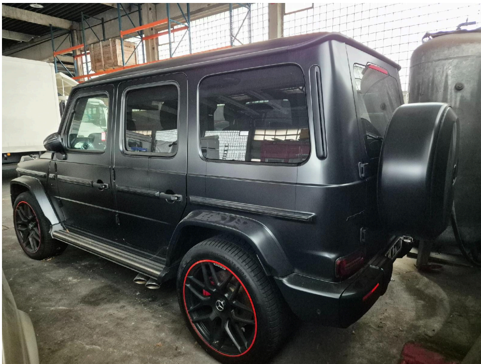
Bild: 4 Diagonale / Übersicht