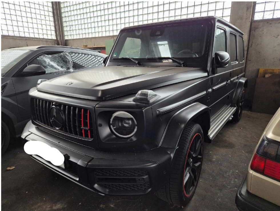
Bild: 1 Diagonale / Übersicht