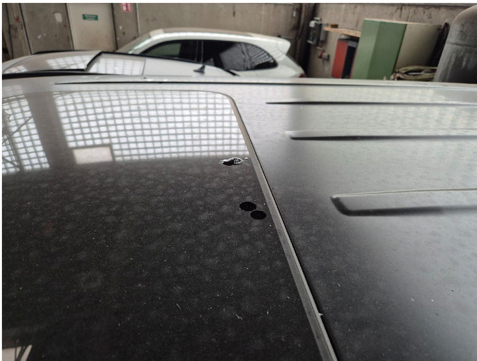
Bild: 18 Dach / Glasschiebe-/hubdach mit Ölflecken