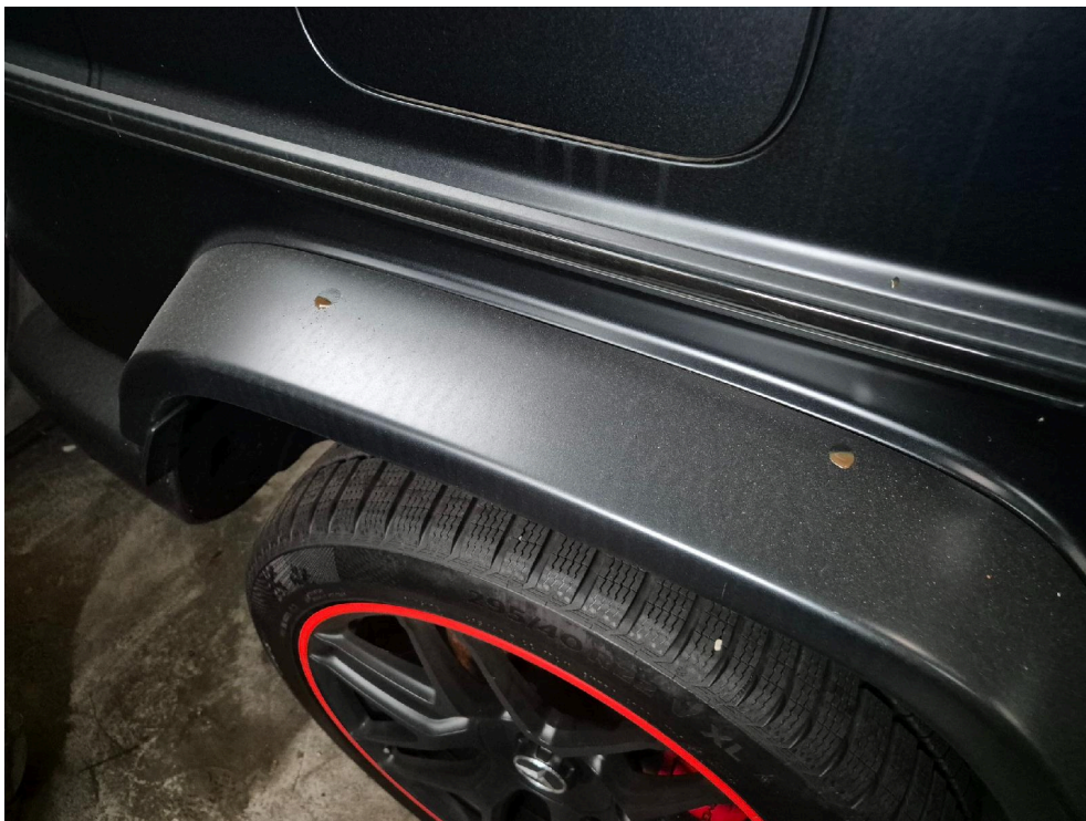
Bild: 22 Verbreiterung HR mit Ölflecken