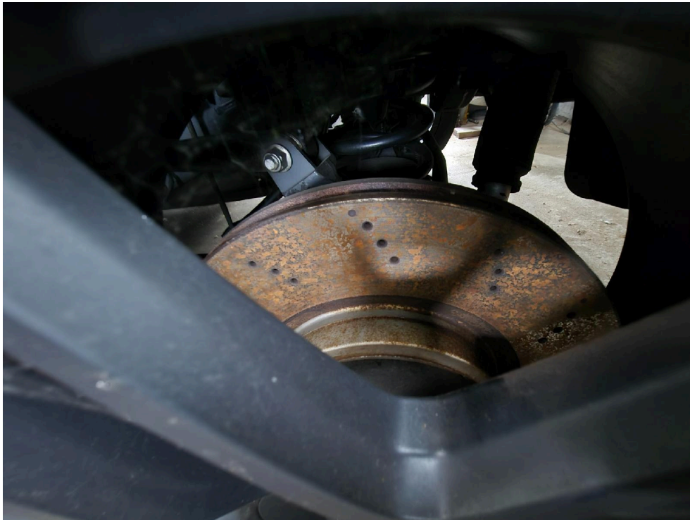
Bild: 11 Bremsscheiben, hier HL, großflächig angerostet, tw. stark