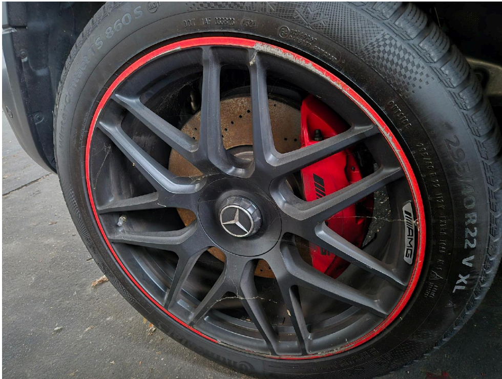
Bild: 7 Schaden: Felge VL großflächig beschädigt / Bordsteinanstöße o.ä.