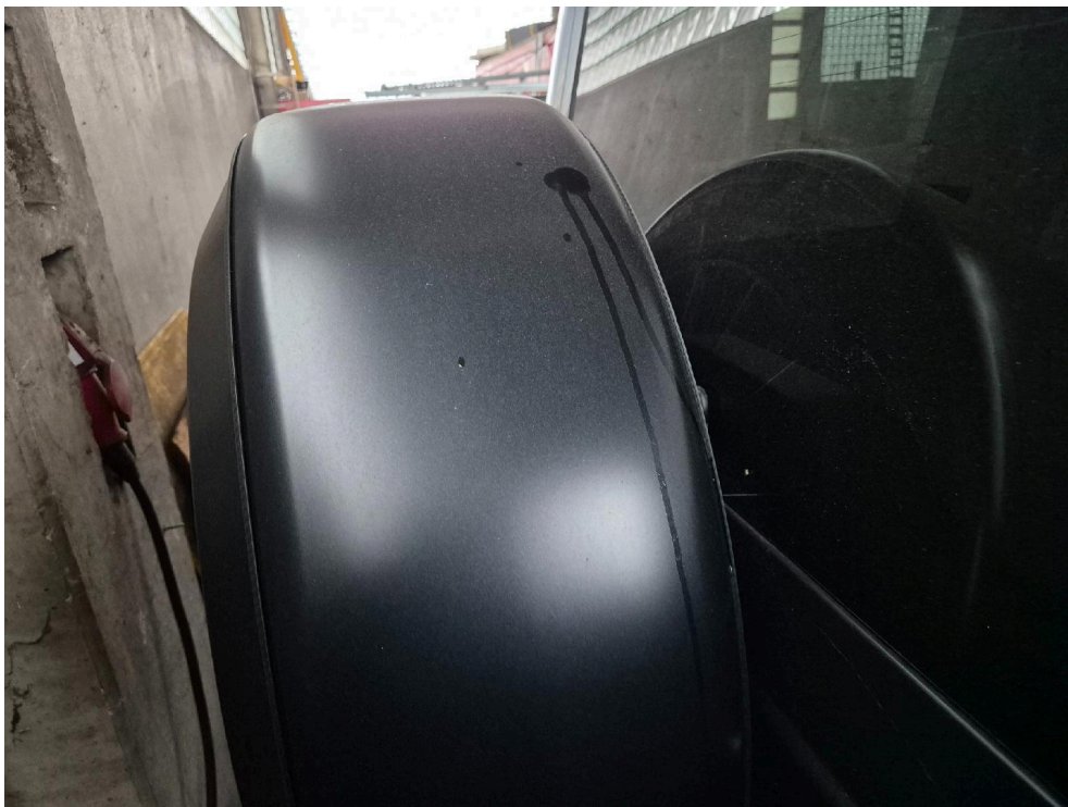
Bild: 24 Heck-/Reserveradabdeckung mit Ölflecken