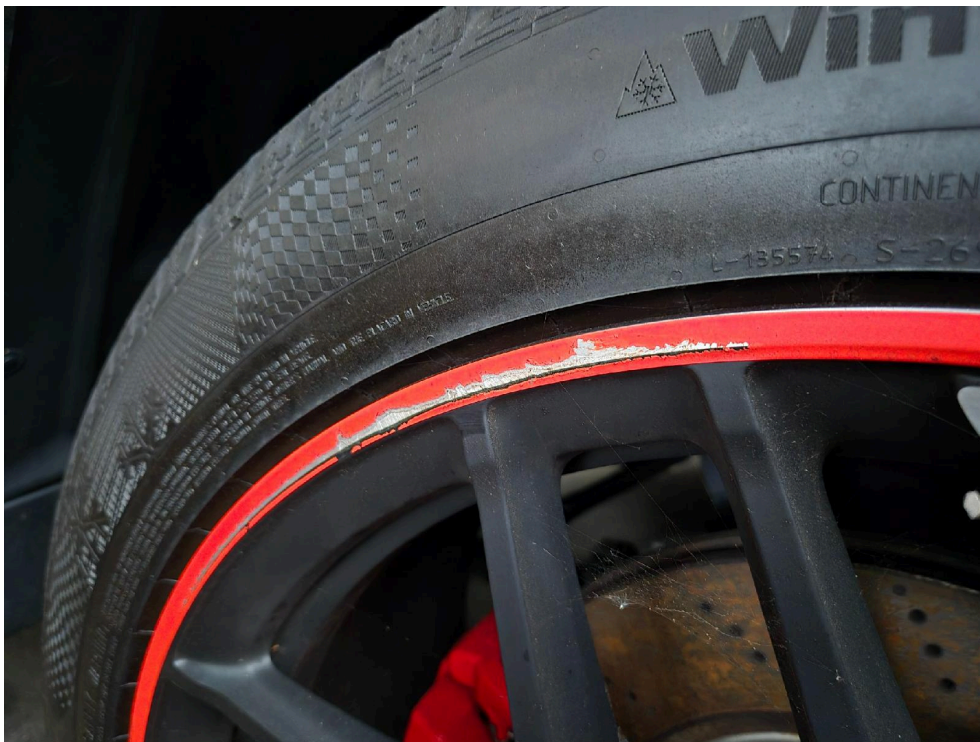
Bild: 10 Nahaufnahme: Felge HL großflächig beschädigt / Bordsteinanstöße o.ä.