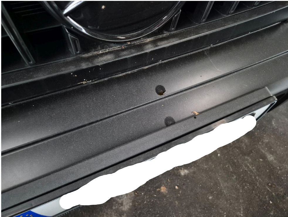
Bild: 19 Frontstoßfänger mit Ölflecken