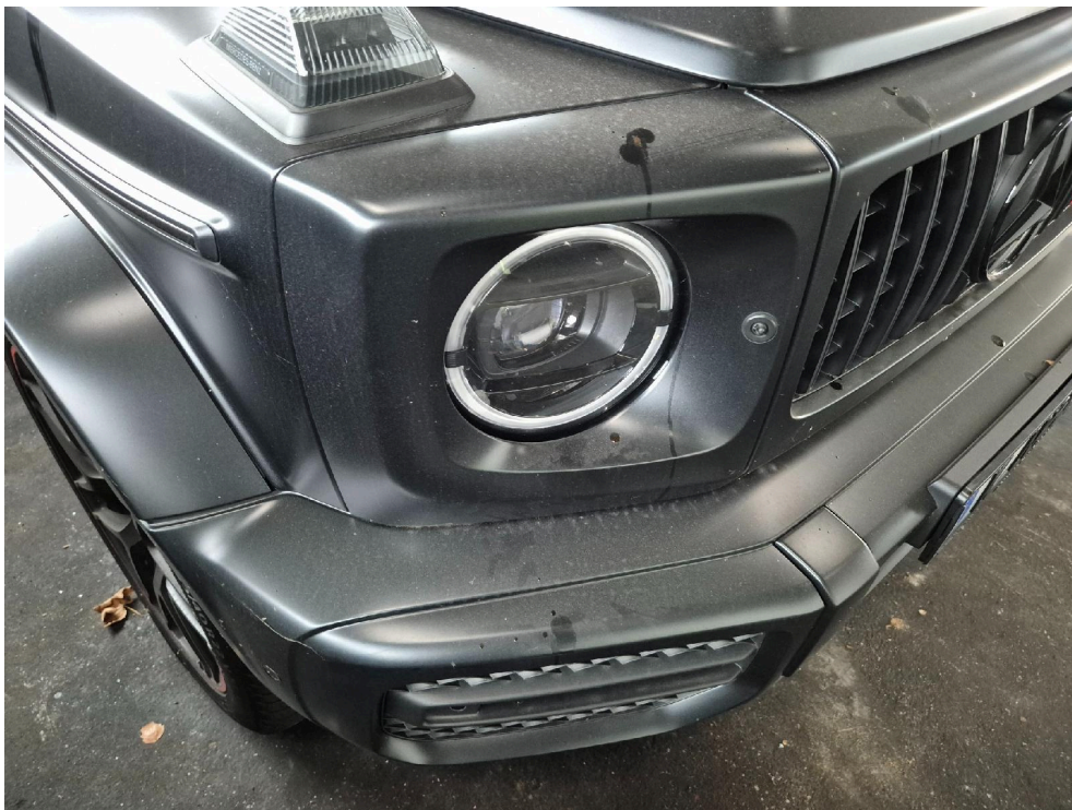
Bild: 20 Aufbauecke VR mit Ölflecken