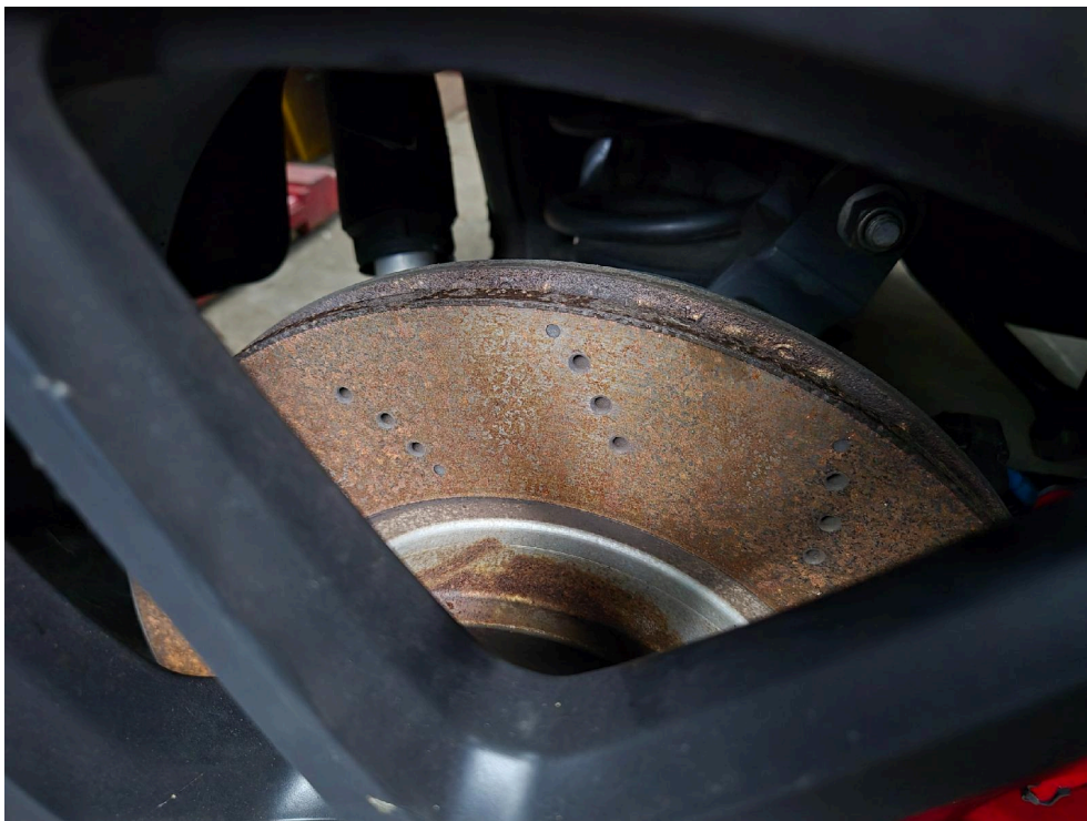
Bild: 14 Bremsscheiben, hier HR, großflächig angerostet, tw. stark