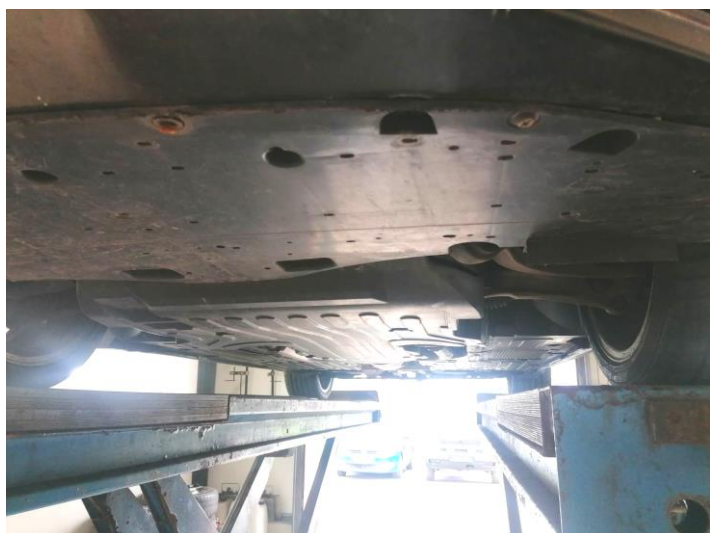
Motorabdeckung vorne angeschliffen