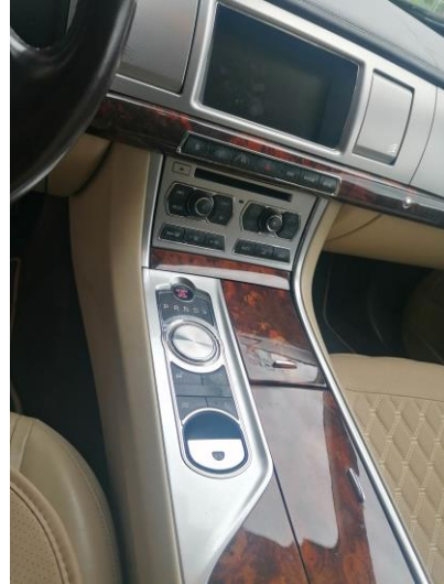
Sitze und Innenraum – guter Zustand