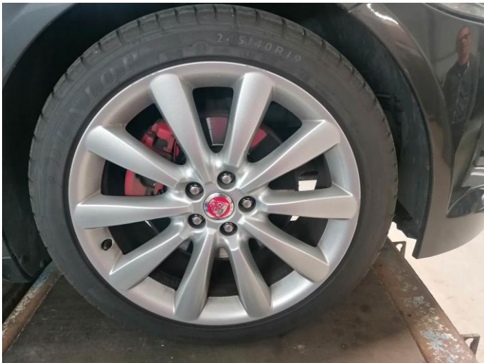
Bremsscheiben alle - stark abgenutzt