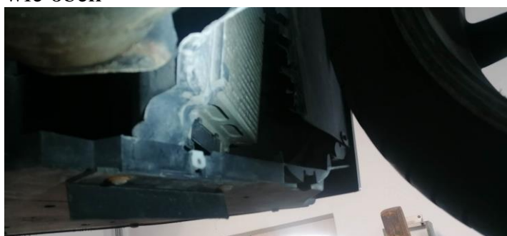
Linke Radabdeckung vorne locker und angeschliffen