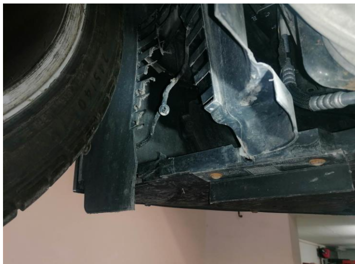
rechte Radabdeckung vorne locker und angeschliffen