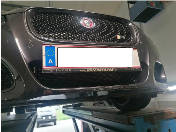
Kratzspuren und leichte Steinschläge