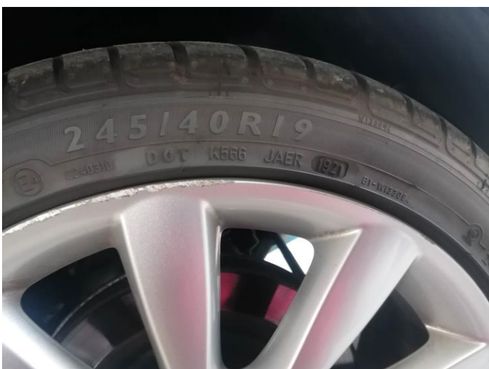
Reifendimension – Profiltiefe 6 mm – Kratzer am Felgenrand – Reifenproduktion 2021