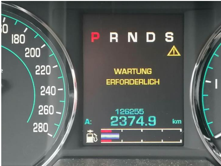
Wartung – Kilometerstand 126.255