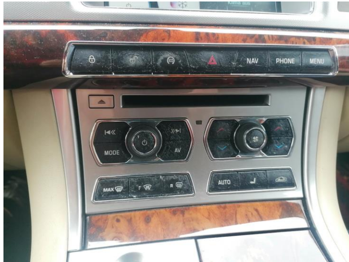
an den Schaltern klebrige Oberflächen