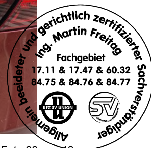
Fahrzeug Foto 38 von 42