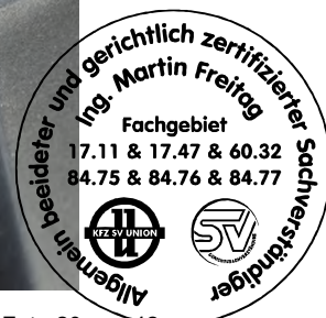
Fahrzeug Foto 20 von 42