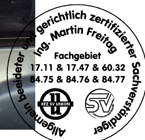
Fahrzeug Foto 8 von 42