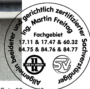
Fahrzeug Foto 32 von 42