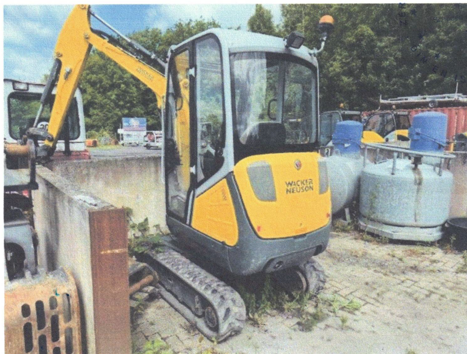
Bild 2 Übersichtsaufnahme diagonal von hinten links