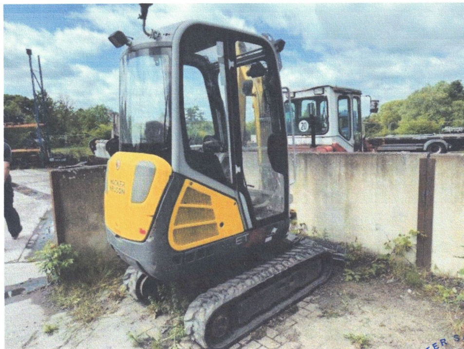
Bild 1 Übersichtsaufnahme diagonal von hinten rechts