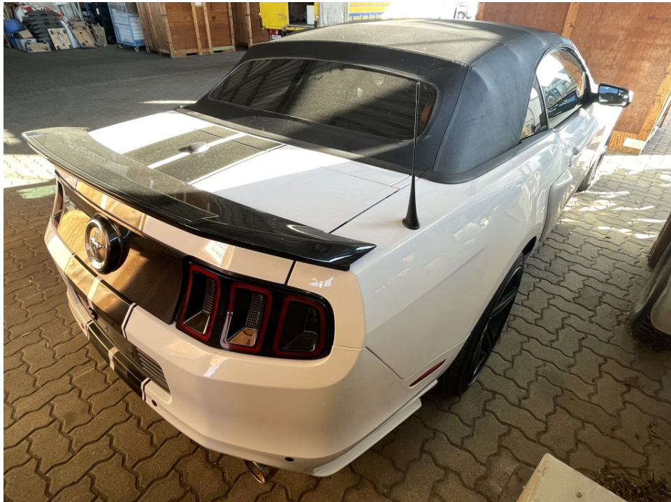
Übersichtsfoto hinten rechts