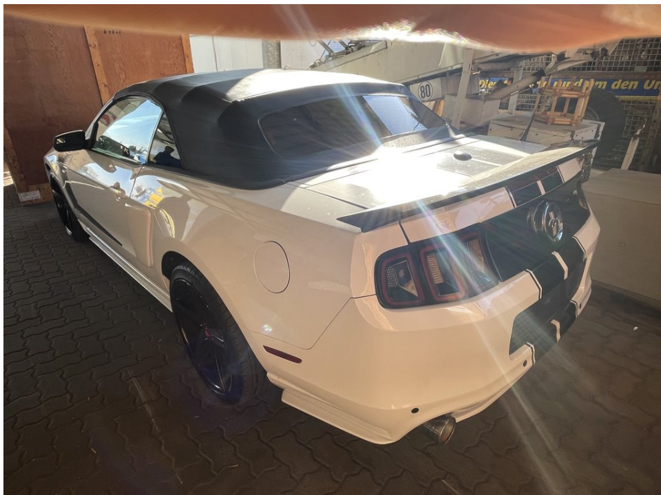
Übersichtsfoto hinten links