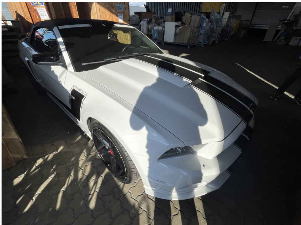
Übersichtsfoto vorn rechts