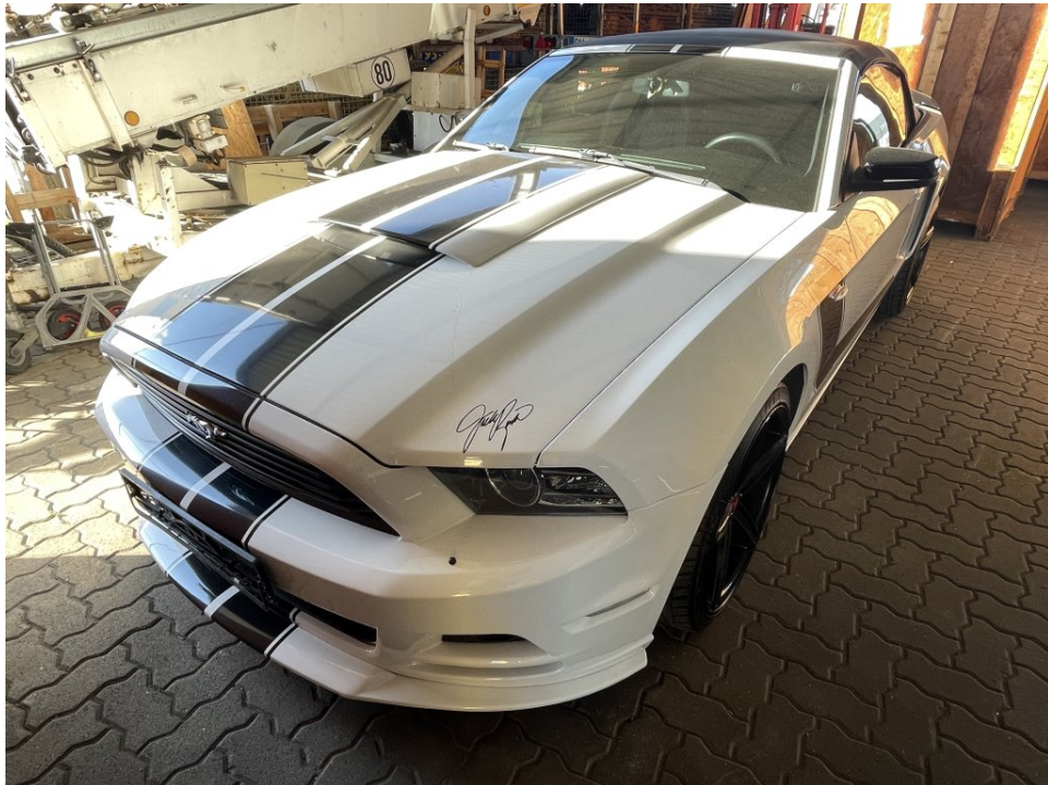
Übersichtsfoto vorn links