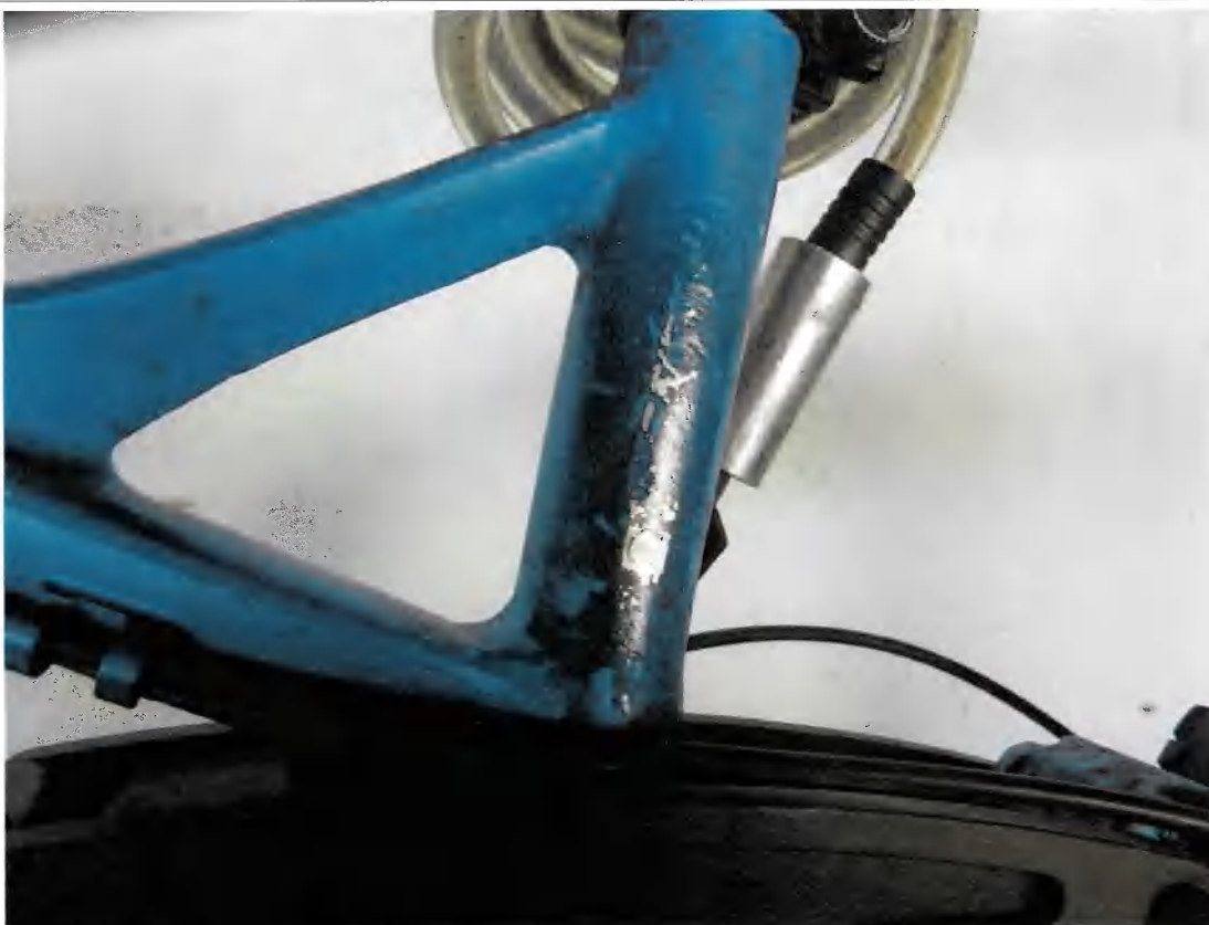
Bild 9 | zu Bild 5 - Entfernte Rahmennummer mit blauer Farbe überlackiert