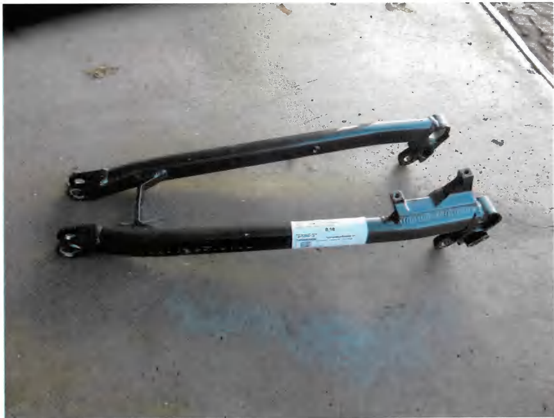
Bild 48 Schwinge