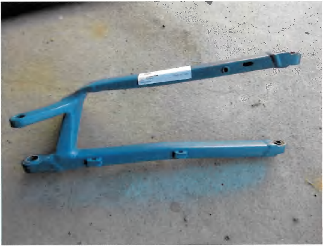
Bild 47 Schwinge, blau überlackiert