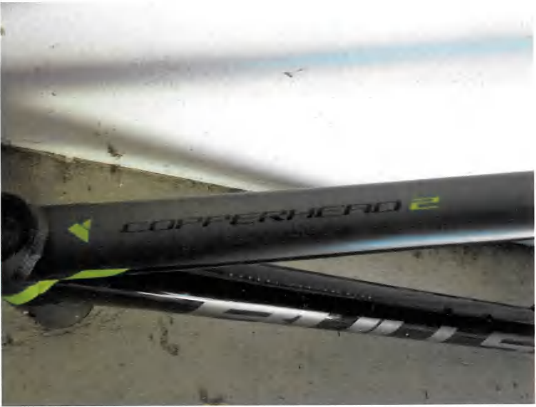
Bild 29 zu Bild 28 - BULLS Copperhead 2