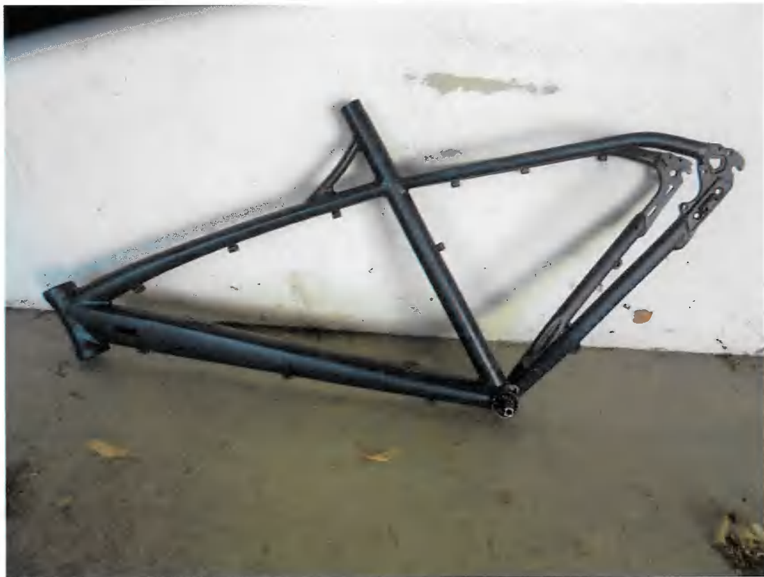
Bild 36 | Fahrradrahmen Marke unbekannt, dunkelblau überlackiert. Rahmen-Nr. entfernt