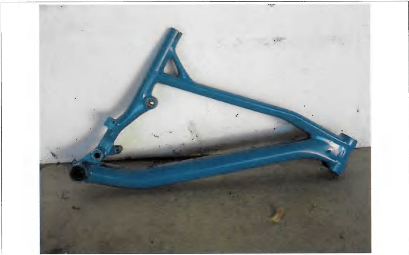
Bild 26 Fahrradrahmen, Marke unbekannt, blau überlackiert