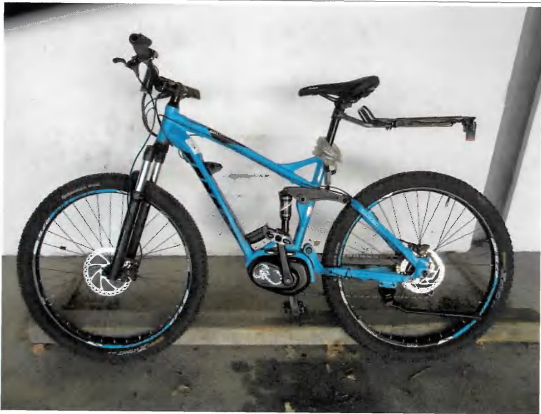
Bild 5 | eBike der Marke FISCHER EM 1862, blau metallic, Rahmennummer entfernt