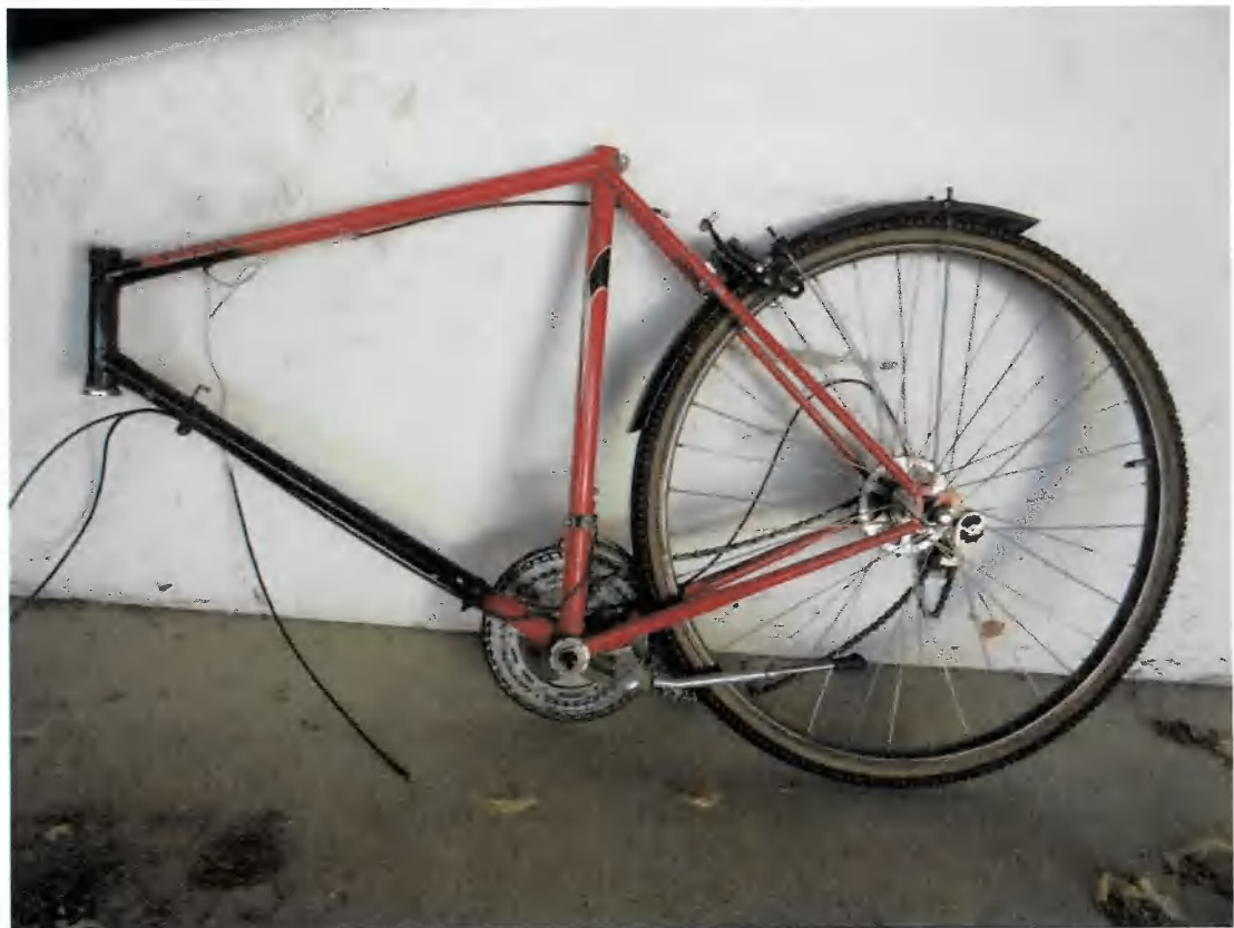
Bild 34 Fahrradrahmen Marke WINORA mit Hinterrad, schwarz/rot ohne Rahmennummer