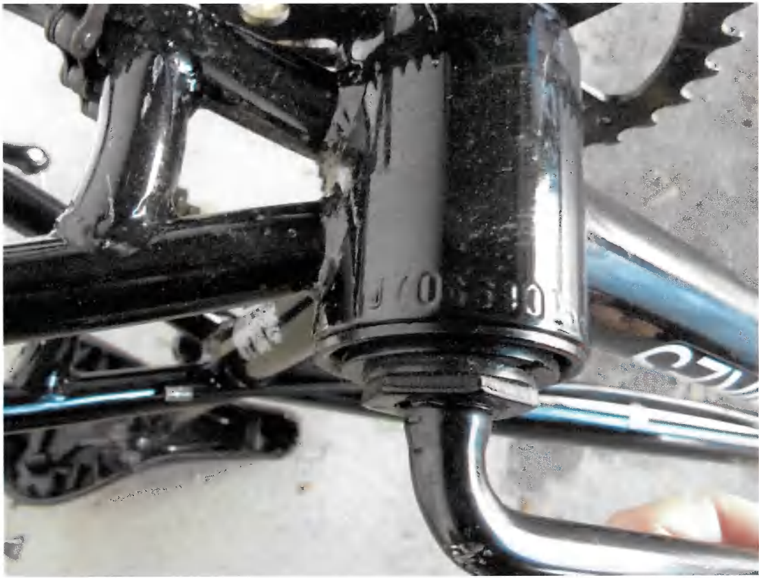
Bild 33 zu Bild 31 - Rahmen-Nr.: J706690054 (INPOL ohne)