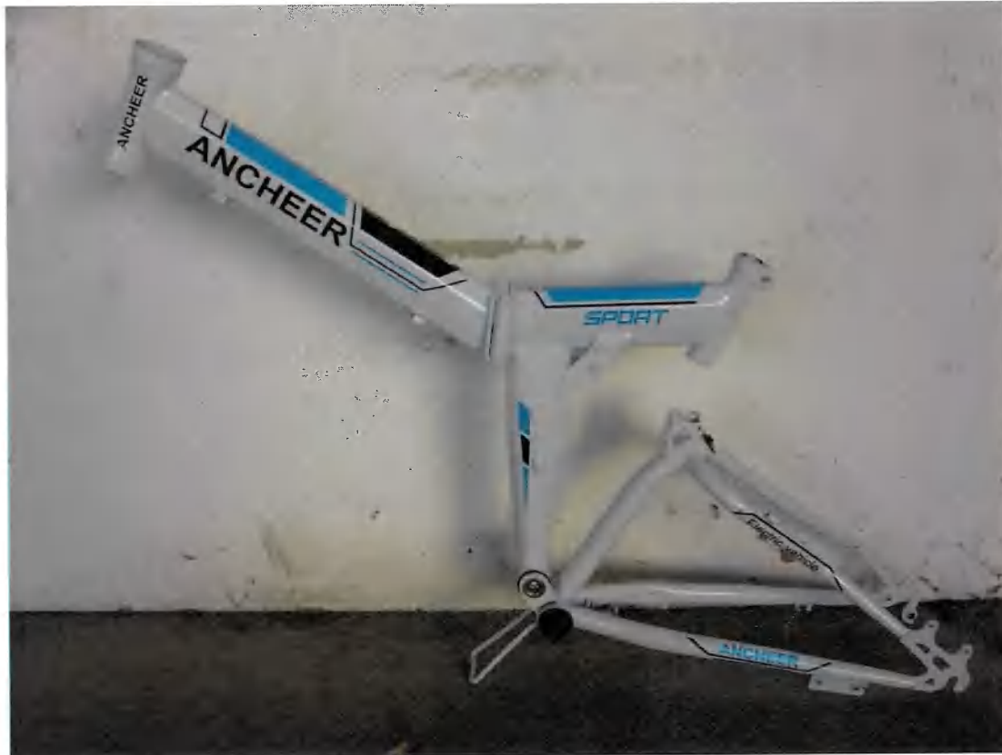
Bild 24 | Fahrradrahmen ANCHEER weiß/blau (klappbar), Rahmen-Nr.: ZX17090647 (INPOL ohne)