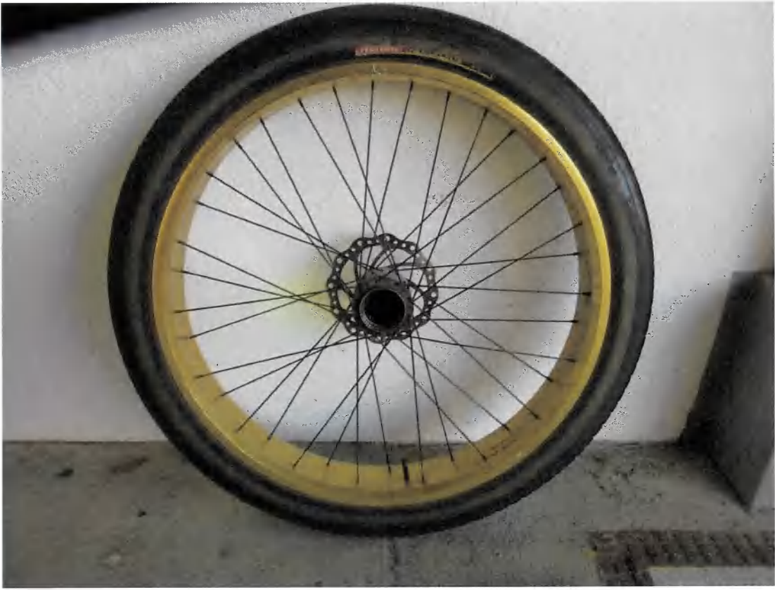
Bild 88 | Vorderreifen (breit) für CUSTOMER Bike, Felge gold. Zugeordnet zu Az.: BY4305-002817-20/2 der PI Lichtenfels - KEIN DIEBSTAHL