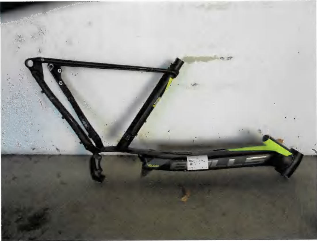
Bild 23 | Fahrradrahmen BULLS. Rahmen-Nr.: AA71162559 - zugeordnet zu Az.: 4305-006179-20/4 der PI Lichtenfels - KEIN DIEBSTAHL