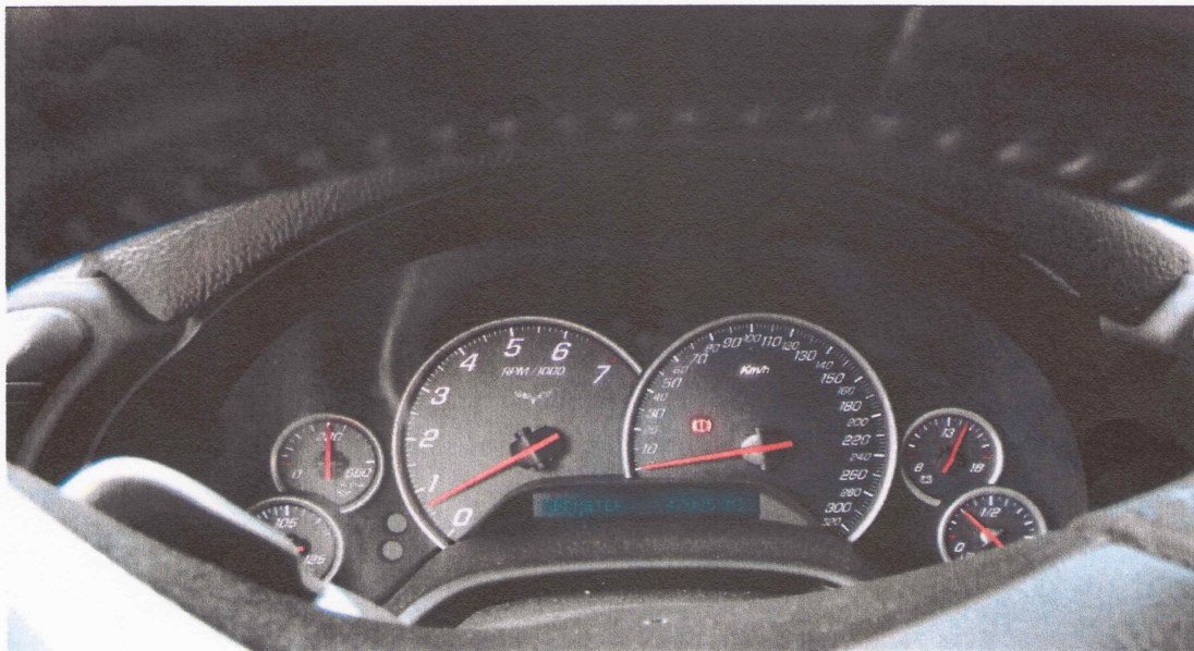
06 Kilometerstand in Meilen 47085 (ca. 76.000 km)