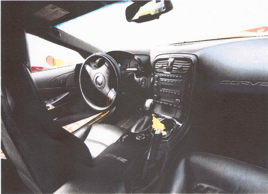
05 Fahrzeuginnenraum – Frontbereich