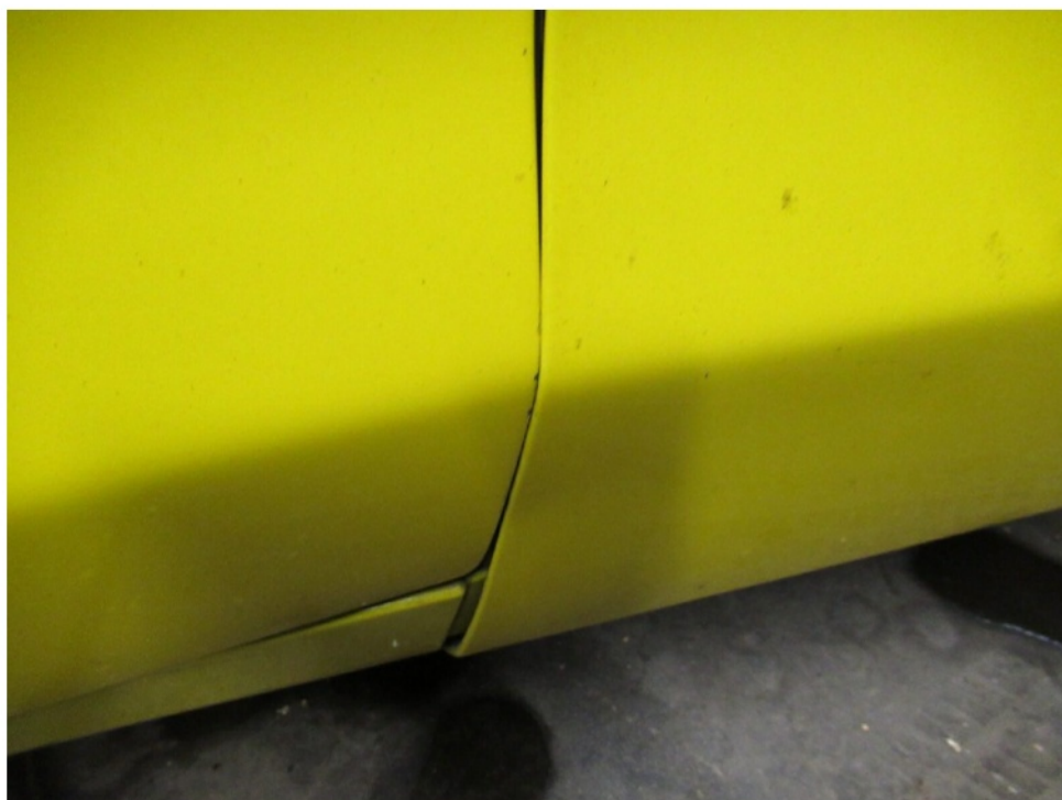
Bild 8 : Kotflügel vorn rechts klemmt an der Tür- eventuell Unfallschaden- Spalte verändert