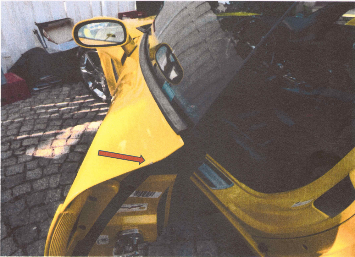
10 Aufnahme des Lackschadens an der Fahrertür (siehe Pfeil)