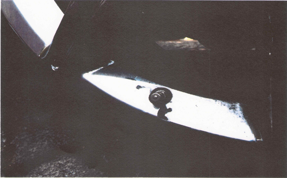
09 Detailaufnahme des Felgenschadens (Abblättern der Beschichtung)