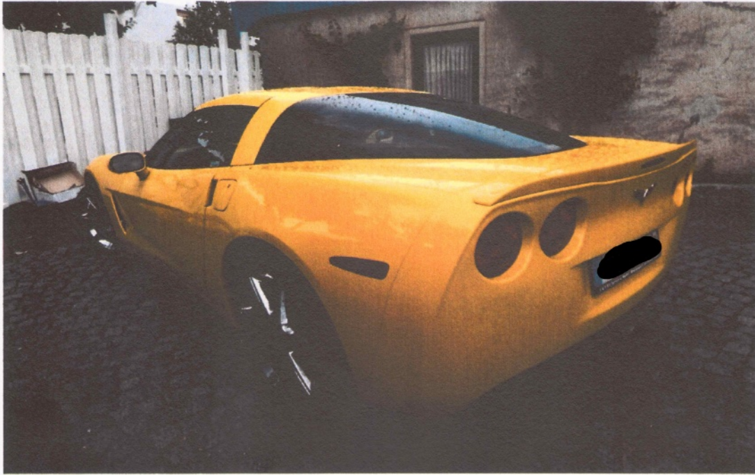
03 Fahrerseite und Rückansicht