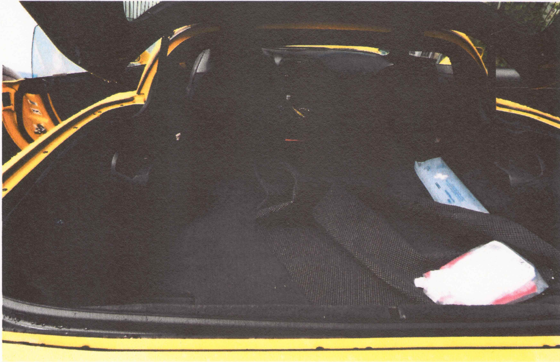
07 Innenansicht Kofferraum