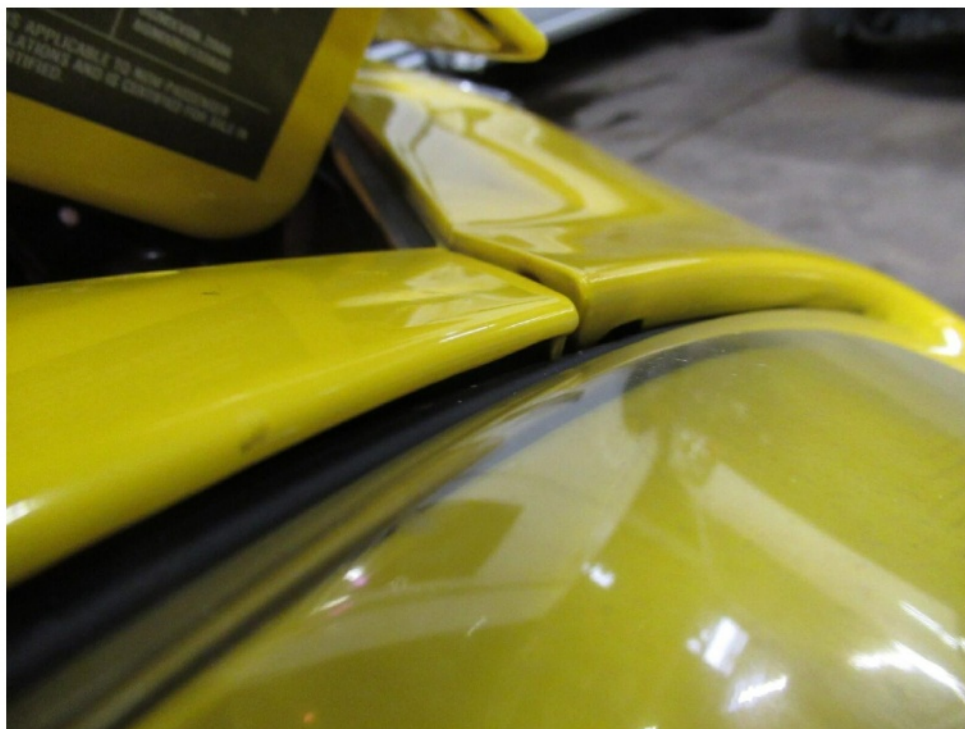
Bild 7 : Kotflügel vorn rechts klemmt an der Tür- eventuell Unfallschaden- Spalte verändert