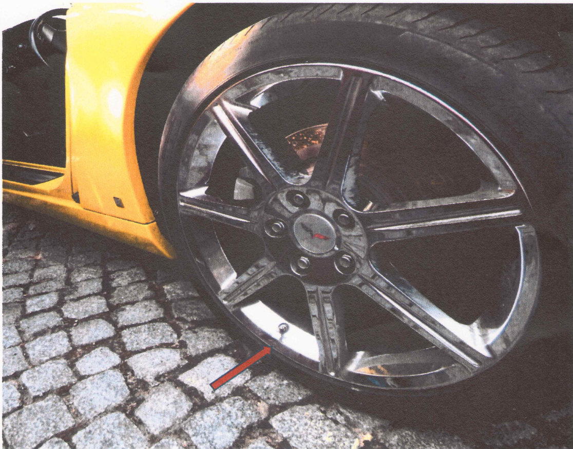
08 Aufnahme des Felgenschadens auf Höhe des Ventils (siehe Pfeil)