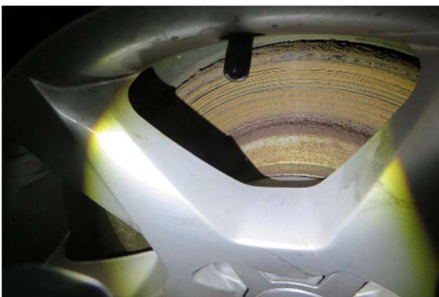
Bremsscheibe 2. Achse links