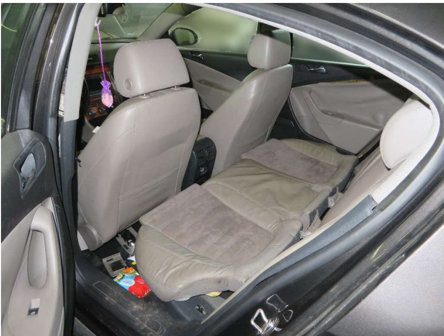
Innenraum hinten, verschmutzt; Sitzbank lose