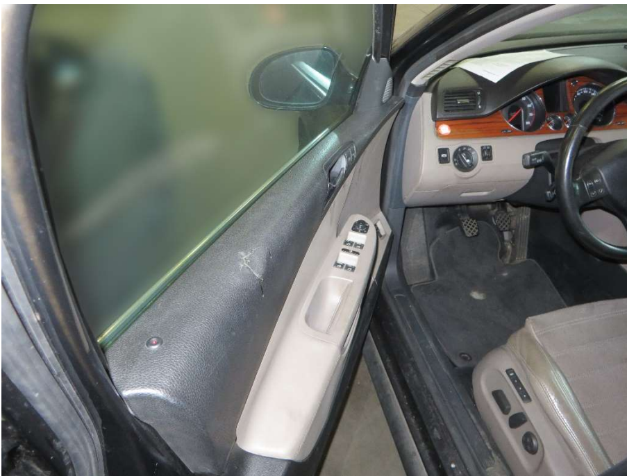
Tür vorne links, Türinnenverkleidung beschädigt