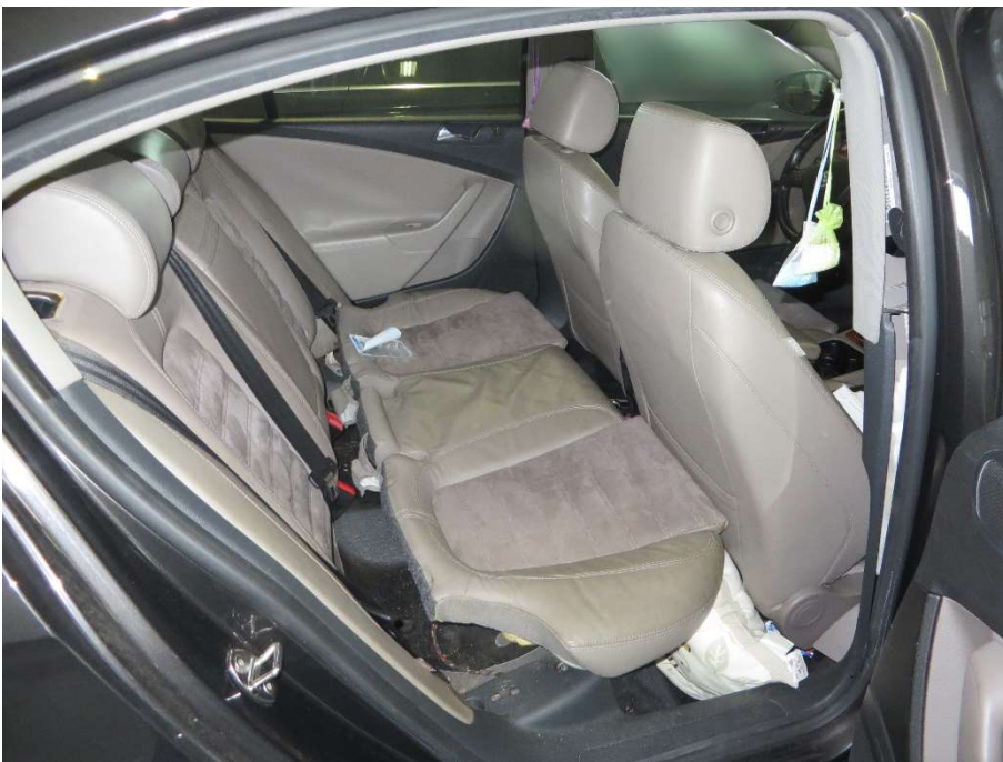
Innenraum hinten, verschmutzt; Sitzbank lose