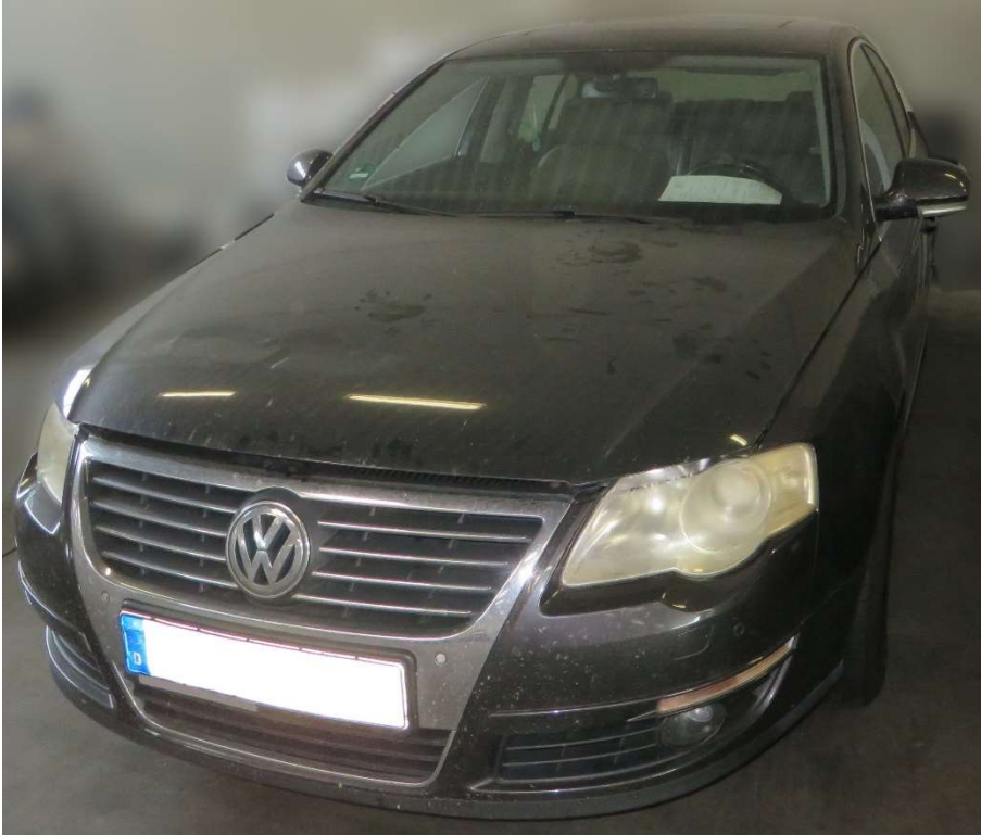
Ansicht seitlich vorne links