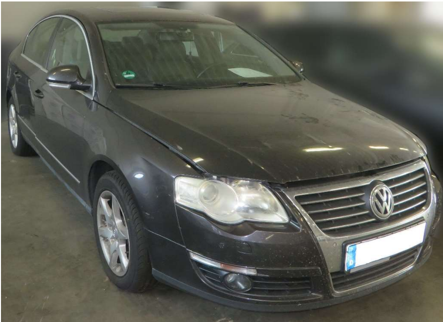
Ansicht seitlich vorne rechts