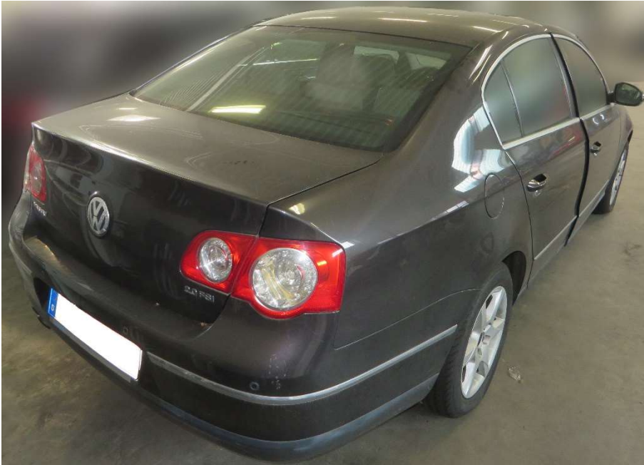
Ansicht seitlich hinten rechts