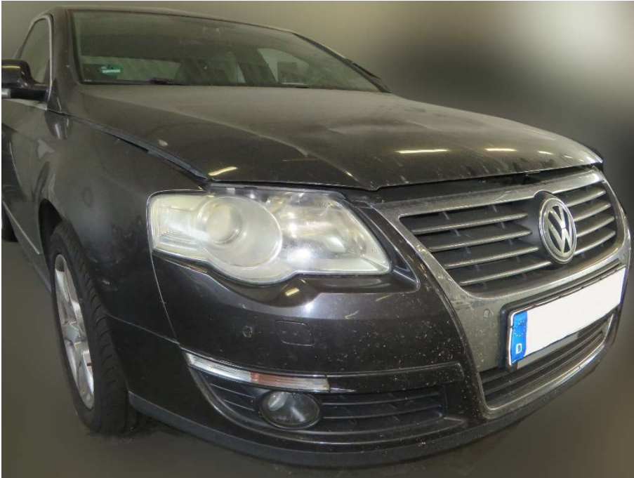
Motorhaube beschädigt, stark eingedellt; Scheinwerfer vorne rechts Abschlusscheibe matt