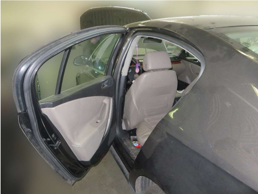
Tür hinten links, Türinnenverkleidung lose