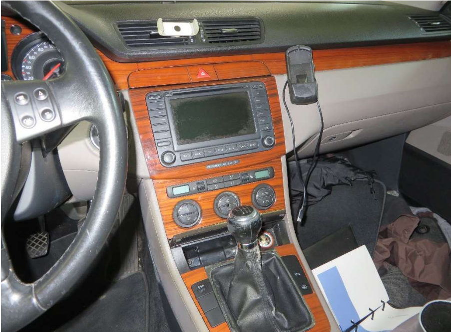
Mittelkonsole, Bildschirm Infotainmentsystem verkratzt; Schaltknauf stark abgenutzt