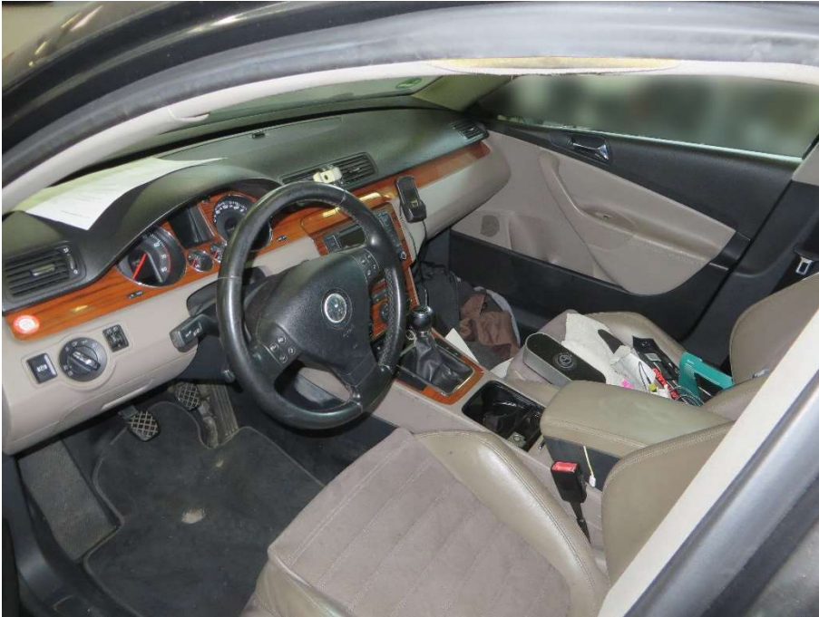
Innenraum vorne, verschmutzt; Dachinnenverkleidung beschädigt