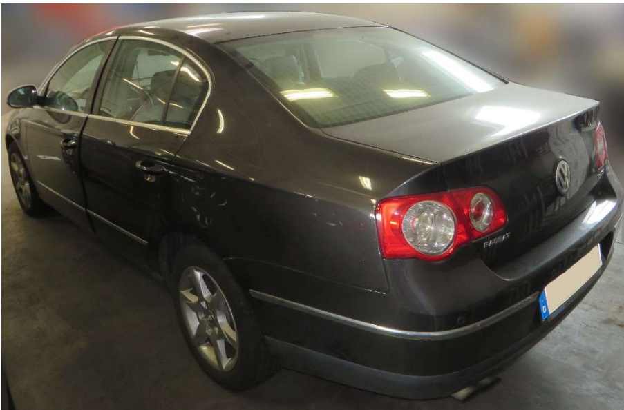
Ansicht seitlich hinten links