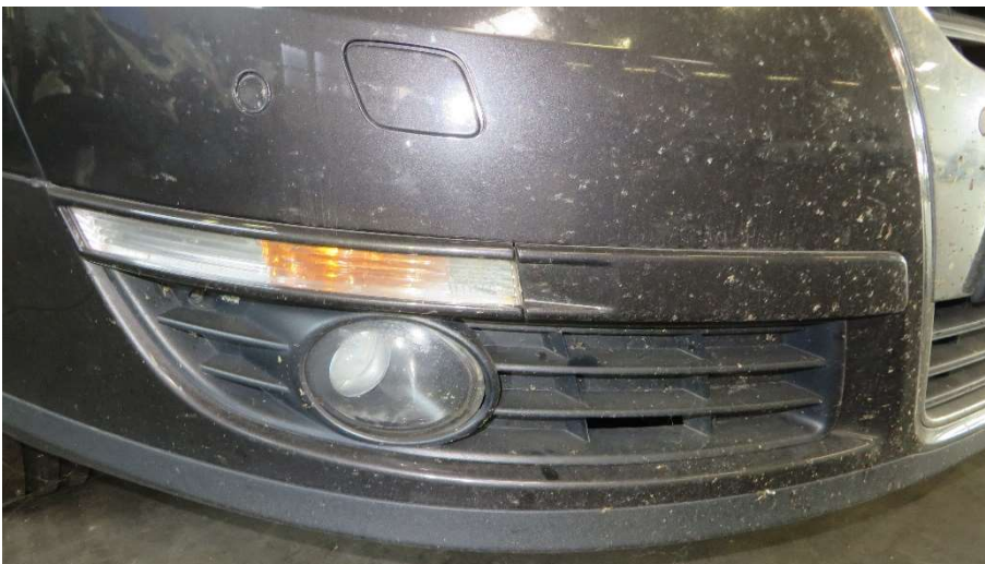
Nebelscheinwerfer Verkleidung rechts Befestigung mangelhaft