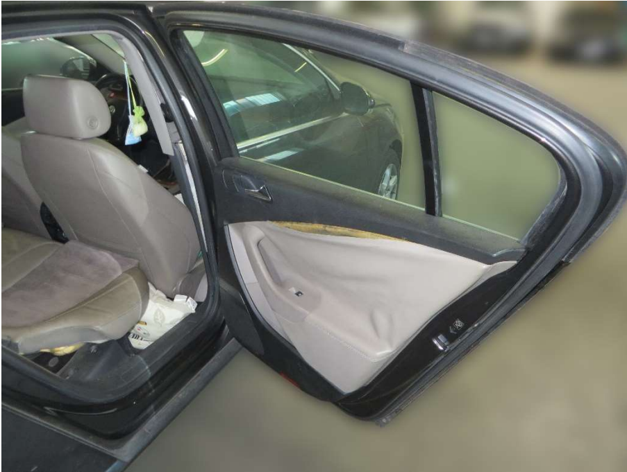
Tür hinten rechts, Türinnenverkleidung beschädigt