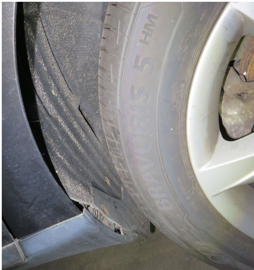
Radhausinnenverkleidung 2. Achse links Befestigung mangelhaft