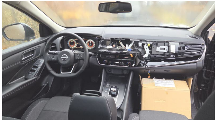
Fahrzeug Foto 8 von 13