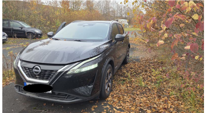
Fahrzeug Foto 2 von 13