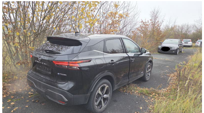
Fahrzeug Foto 4 von 13