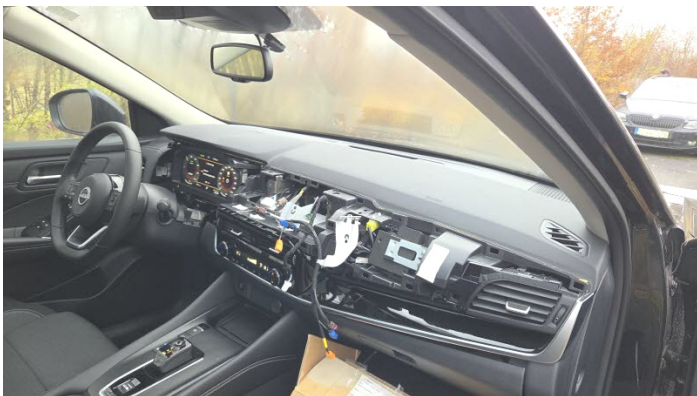
Fahrzeug Foto 9 von 13