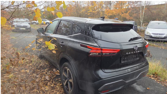
Fahrzeug Foto 3 von 13