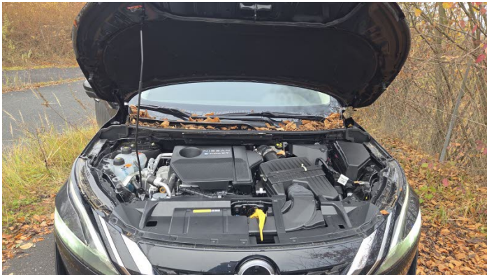
Fahrzeug Foto 7 von 13