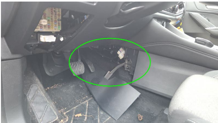
Fahrzeug Foto 11 von 13