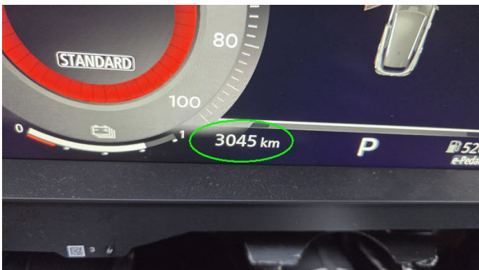
Fahrzeug Foto 5 von 13