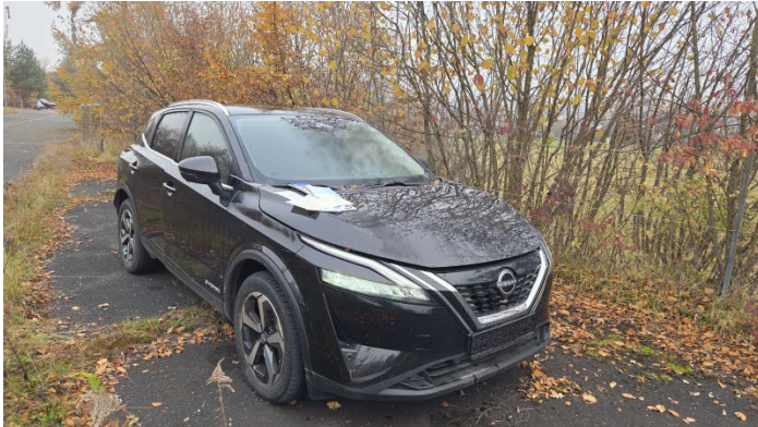
Fahrzeug Foto 1 von 13