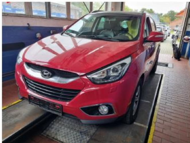
Bild 2 - zeigt beschriebenes Fahrzeug von vorne links.