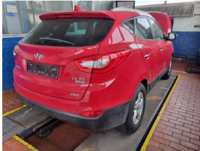
Bild 3 - zeigt beschriebenes Fahrzeug von hinten rechts.