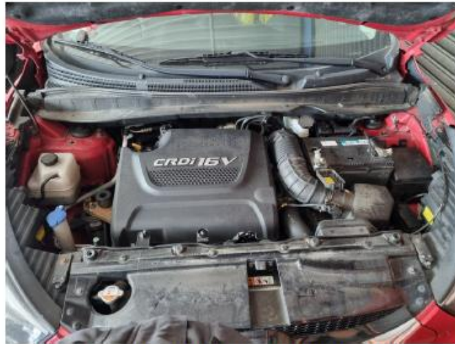
Bild 10 - zeigt Motorraum des beschriebenen Fahrzeuges.