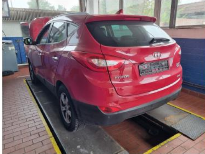
Bild 5 - zeigt beschriebenes Fahrzeug von hinten links.