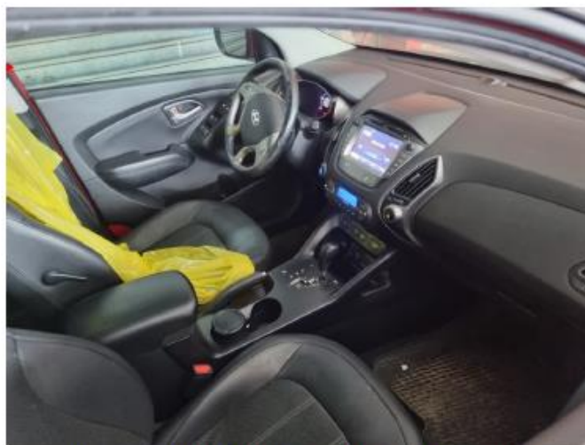
Bild 8 - zeigt Innenraum des beschriebenen Fahrzeuges.