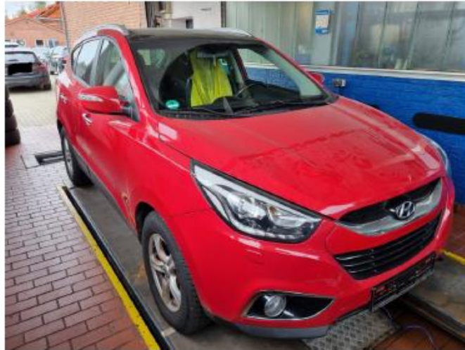
Bild 1 - zeigt beschriebene Fahrzeug von vorne rechts.