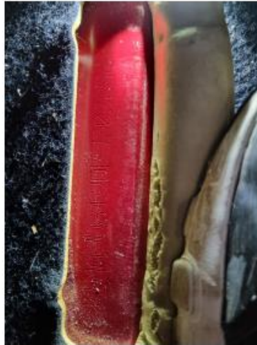
Bild 11 - zeigt eingeschlagene FIN des beschriebenen Fahrzeuges.