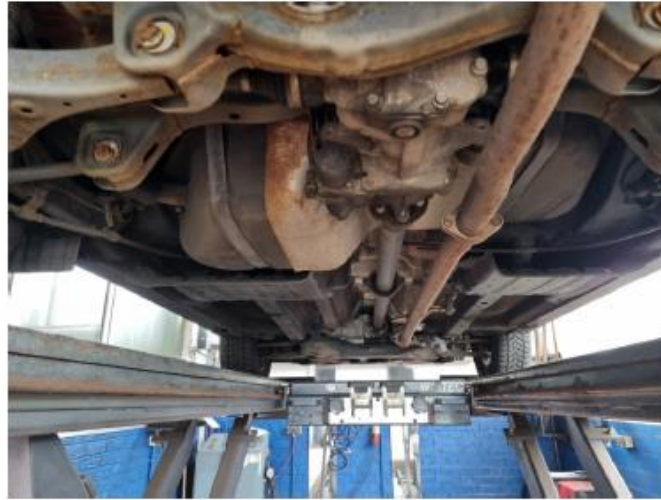
Bild 9 - zeigt beschriebenes Fahrzeug von unten.