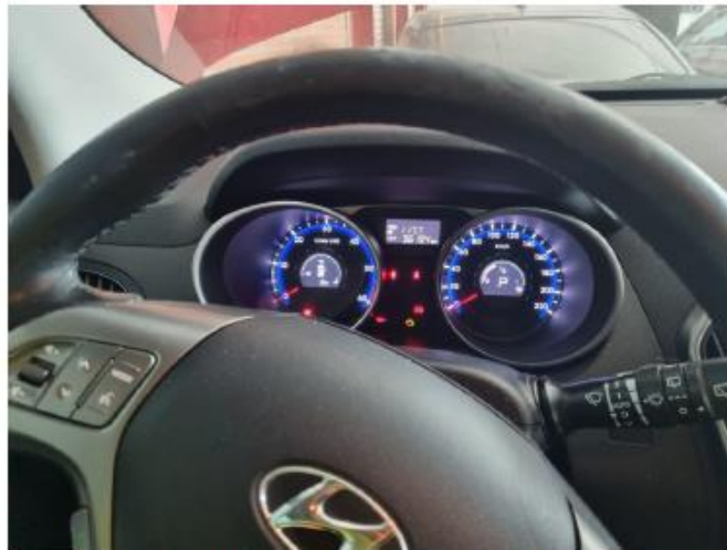
Bild 6 - zeigt Kilometerstand des beschriebenen Fahrzeuges.