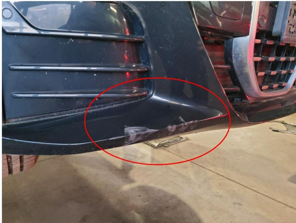
Bild 13 : Stoßfänger vorne, deformiert, instandsetzen und lackieren mit Lackaufbau