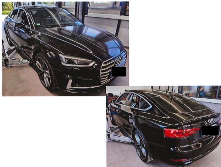
Abbildung 1: Übersicht des in Rede stehenden Fahrzeugs

Die im Rahmen der Fahrzeugidentifizierung festgestellte Serien- und Sonderausstattung ist in Anlage 1 dem Gutachten angehängt. In nachfolgender Abbildung 1 ist das in Rede stehende Fahrzeug im Überblick veranschaulicht.