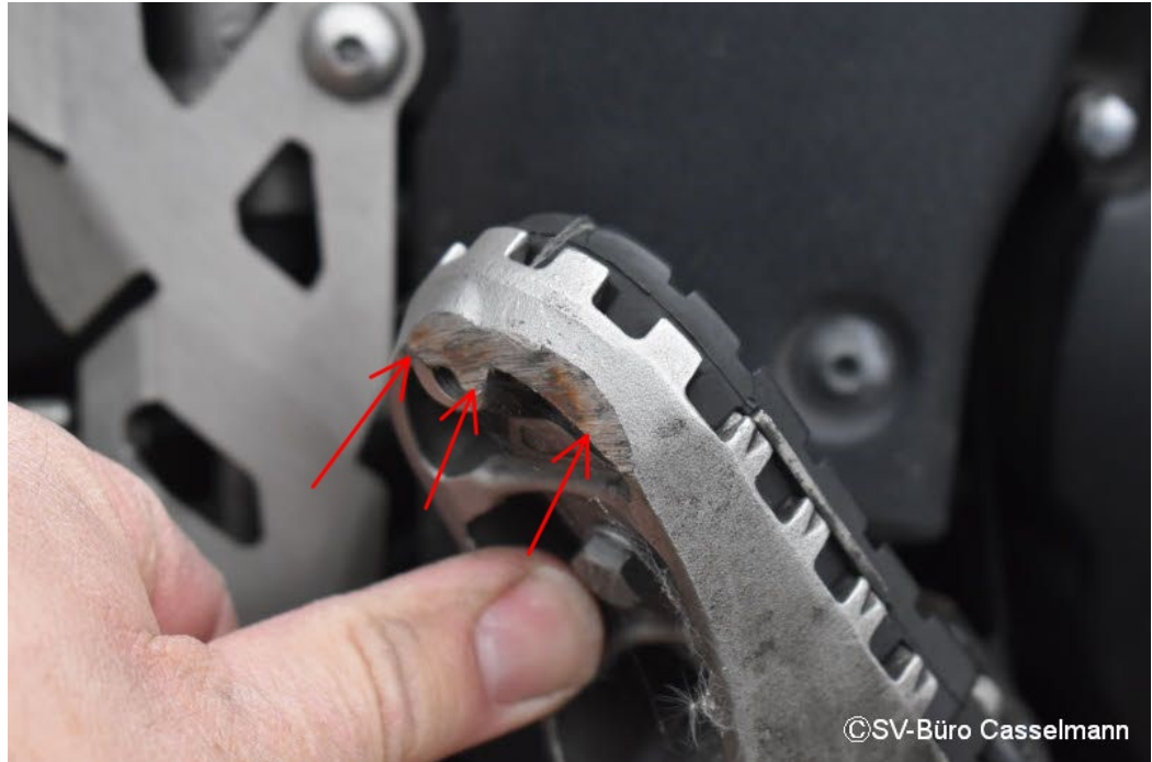
Altschaden: Fußraste VR Schrammspuren mit Materialabtrag