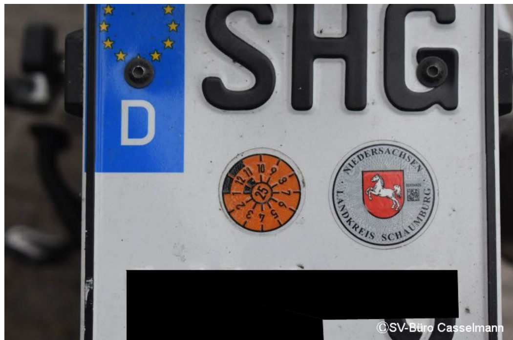
Altschaden: HU seit 10.2025 überfällig