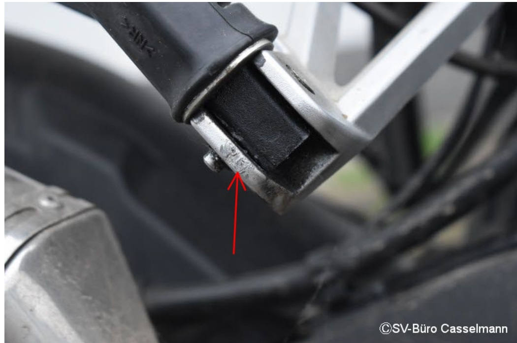
Altschaden: Fußraste HR Schrammspuren mit Materialabtrag