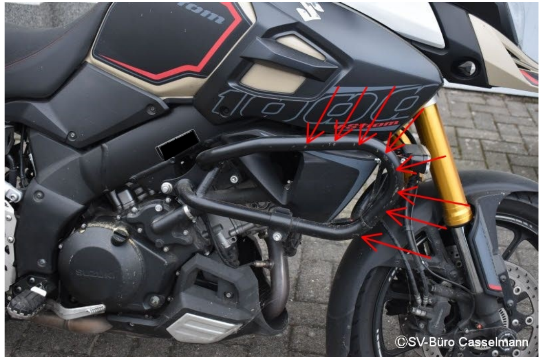
Altschaden: Sturzbügel VR Schrammspuren mit Materialabtrag