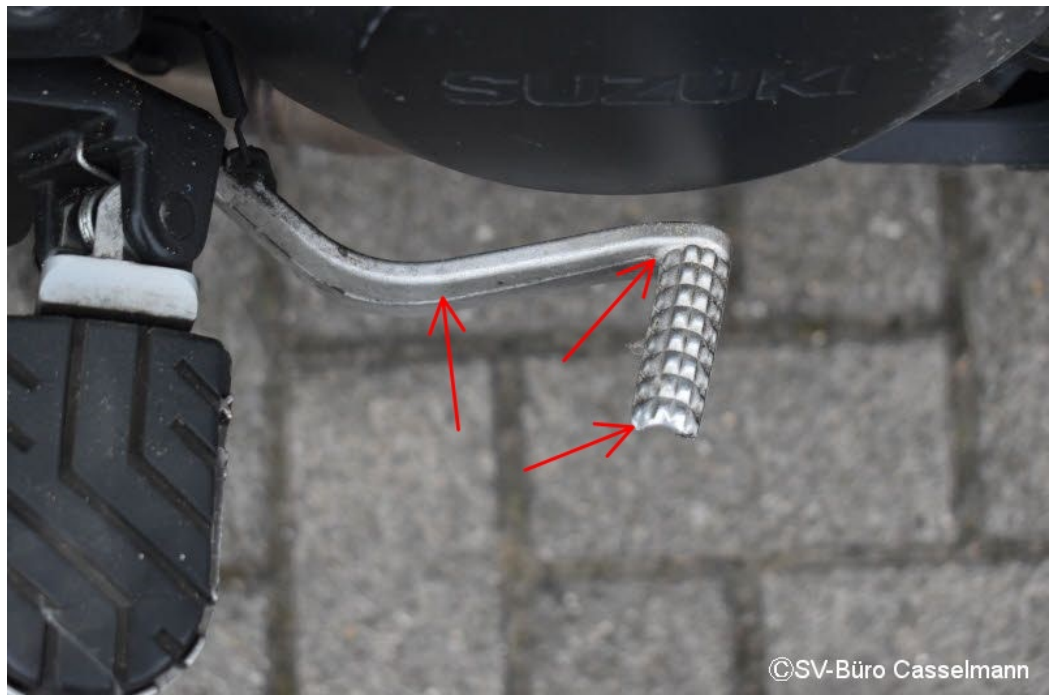
Altschaden: Fußbremshebel rechts Schrammspuren mit Materialabtrag und verbogen,