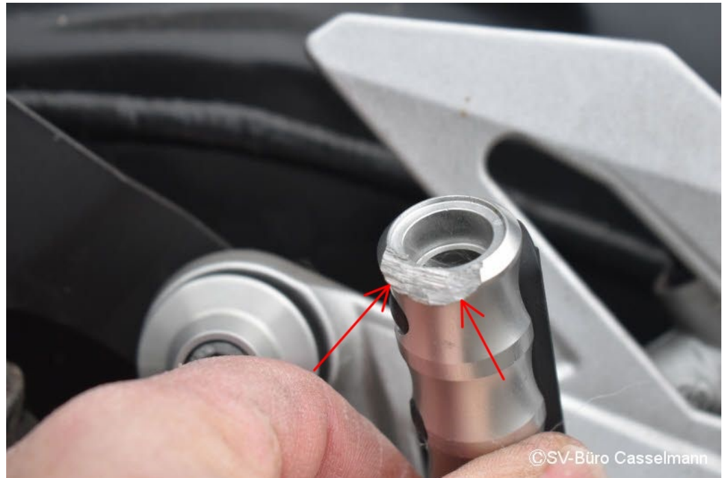
Altschaden: Fußraste VR Materialabtrag (Abgeschliffen)