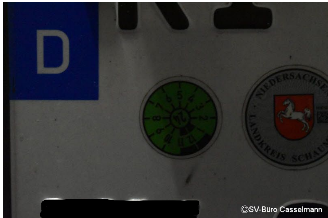
Altschaden: HU seit 05.2024 Überfällig