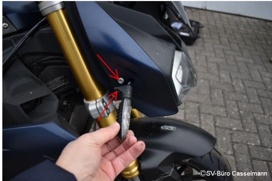
Altschaden: Blinker VR gebrochen