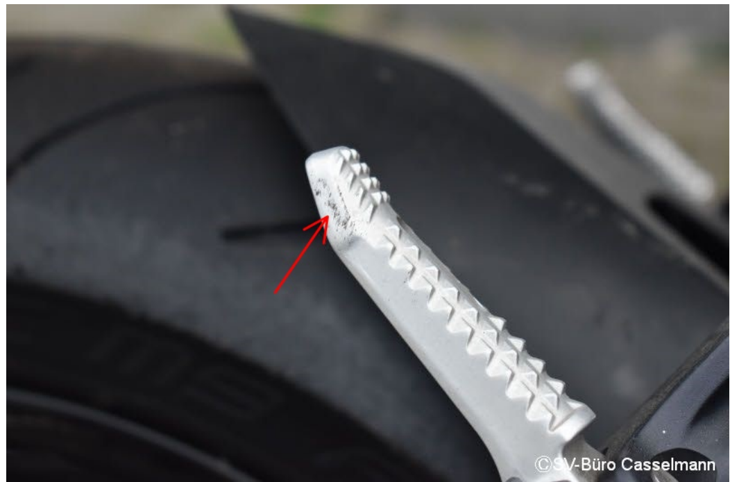
Altschaden: Fußraste HR Materialabtrag (Abgeschliffen)