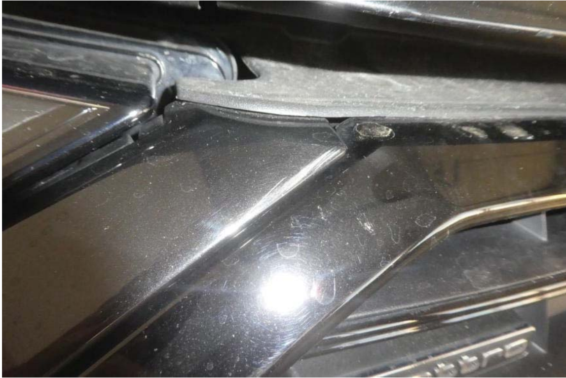
Lackschaden Stoßfänger vorn und Steinschlagschaden Windschutzscheibe