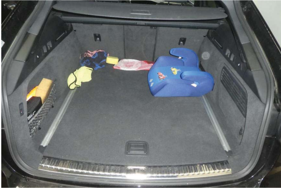
Kofferraum und Motorraum