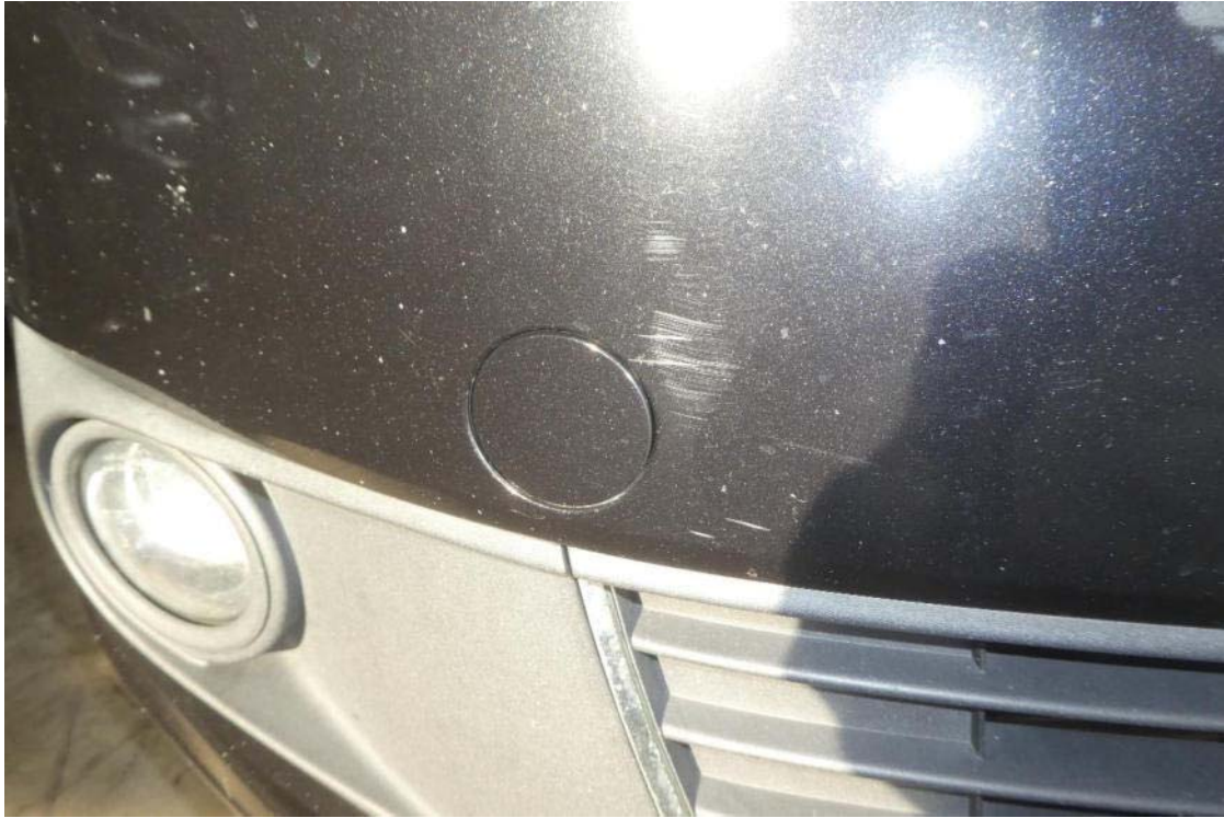
Schäden Stoßfänger vorn