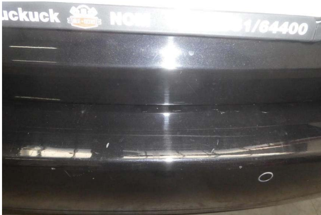
Schäden Stoßfänger hinten und Schäden Spiegel