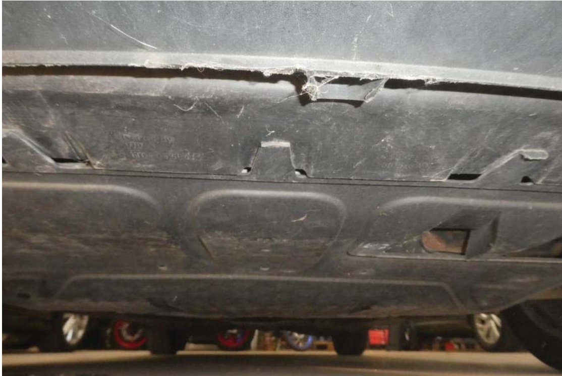
Ansichten von unten