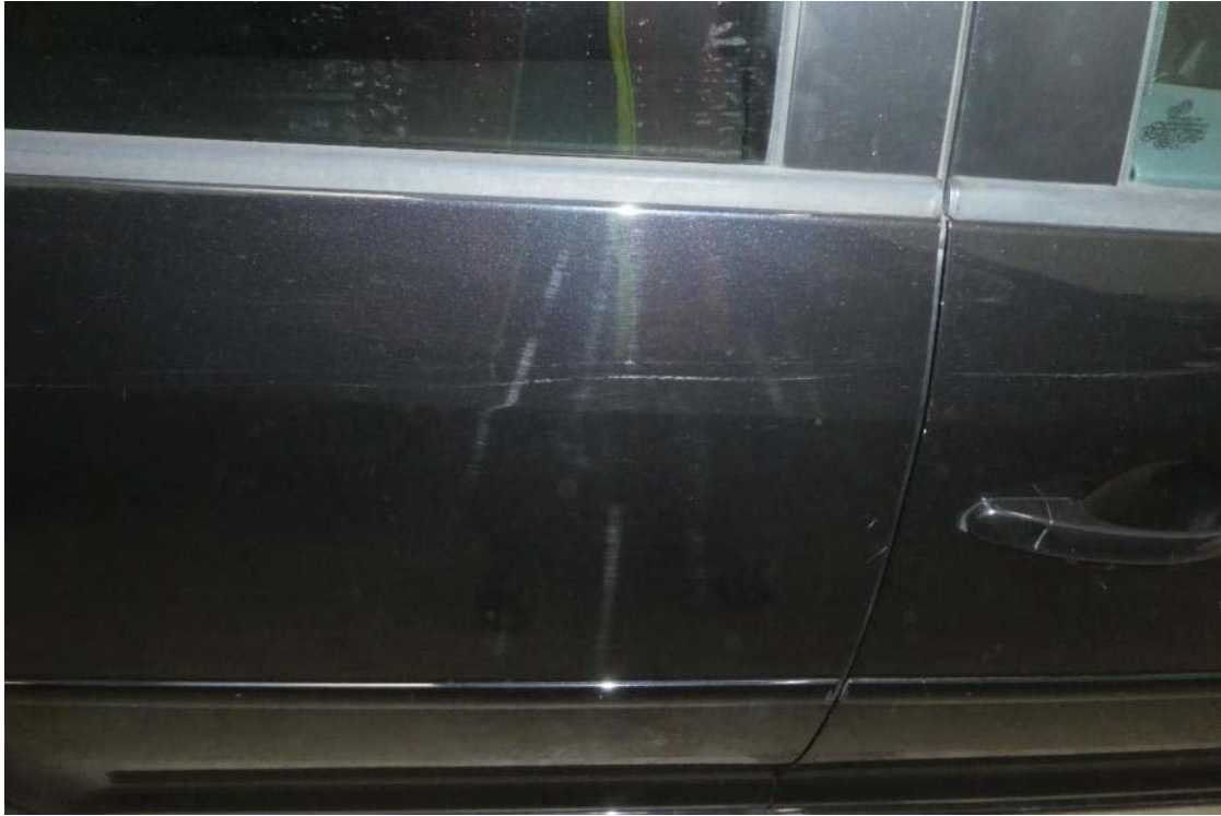
Lackschäden Türen rechts und Beschädigte Verkleidung Tür hinten rechts