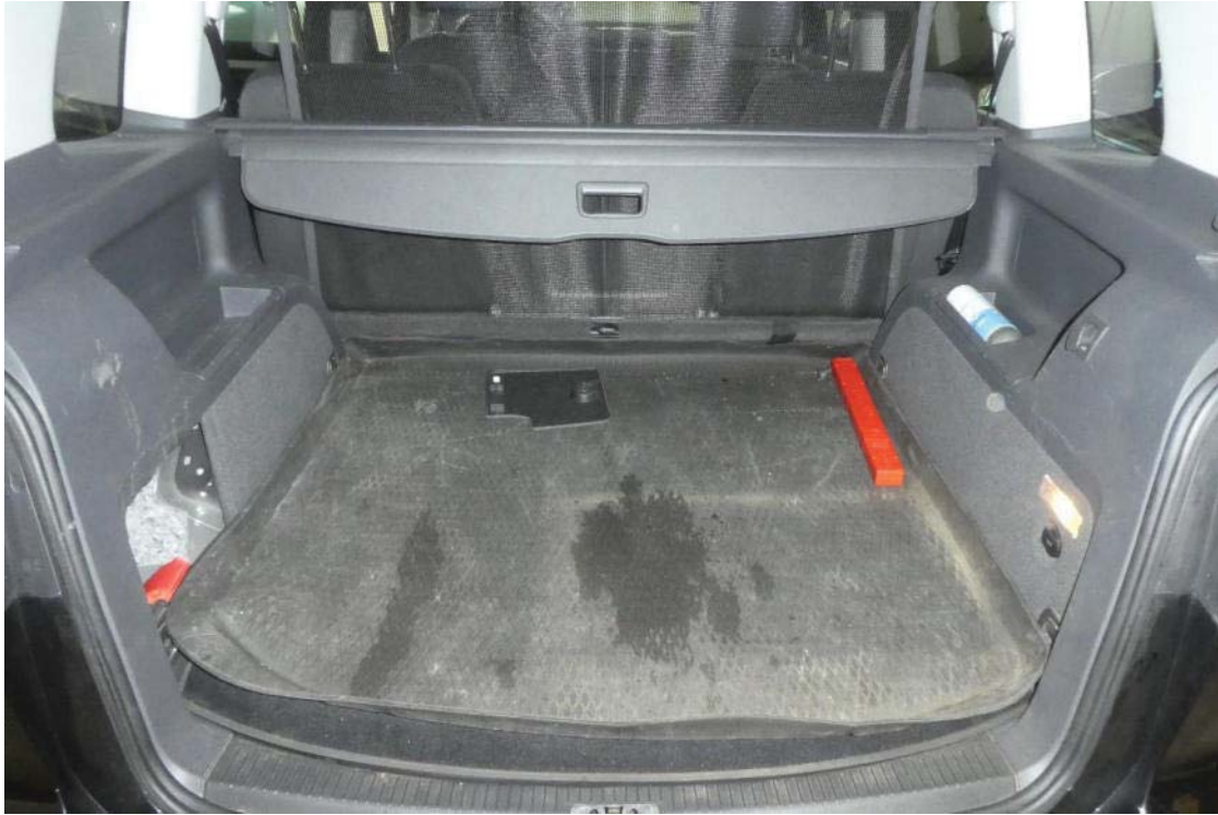
Kofferraum und Motorraum