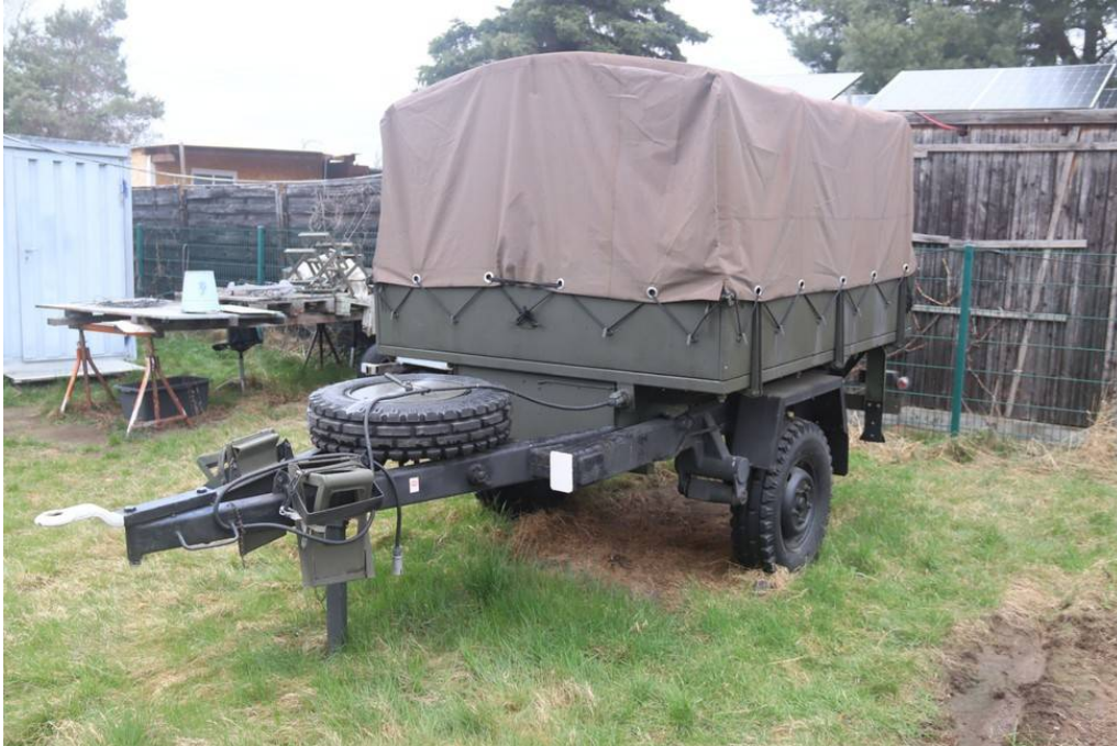
Ansicht vorne links