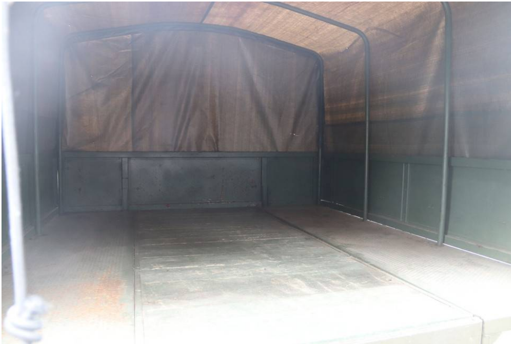
Laderaum bei geöffneter Plane