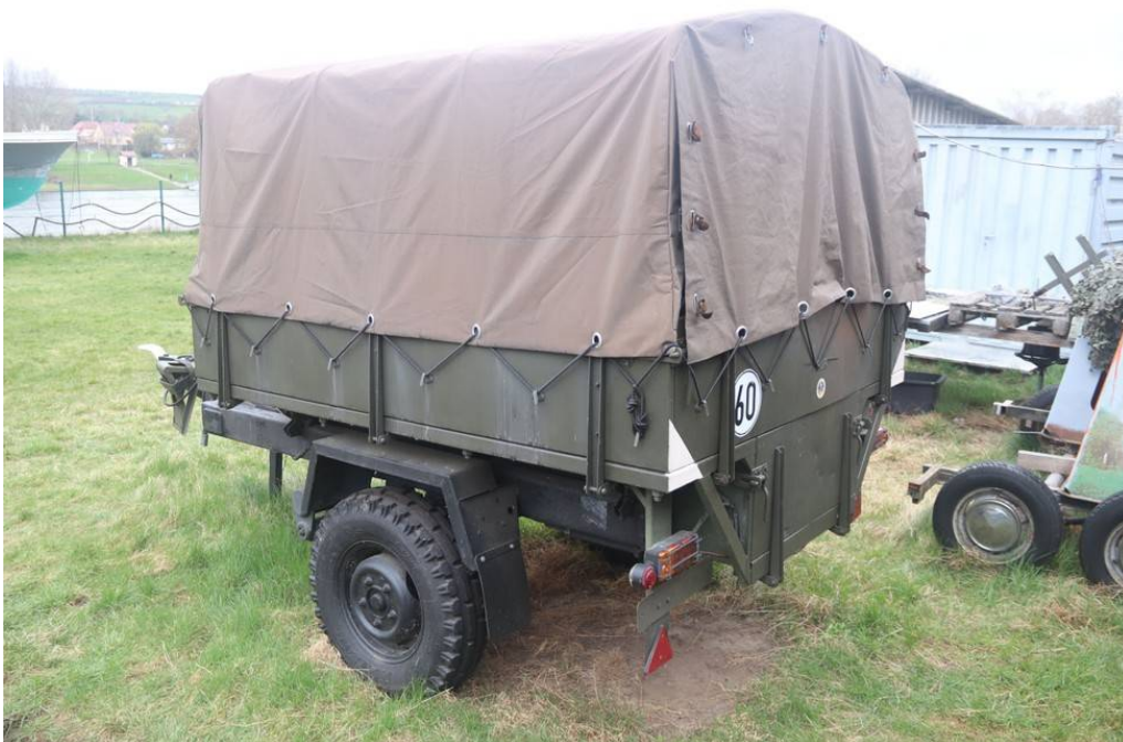
Ansicht hinten links