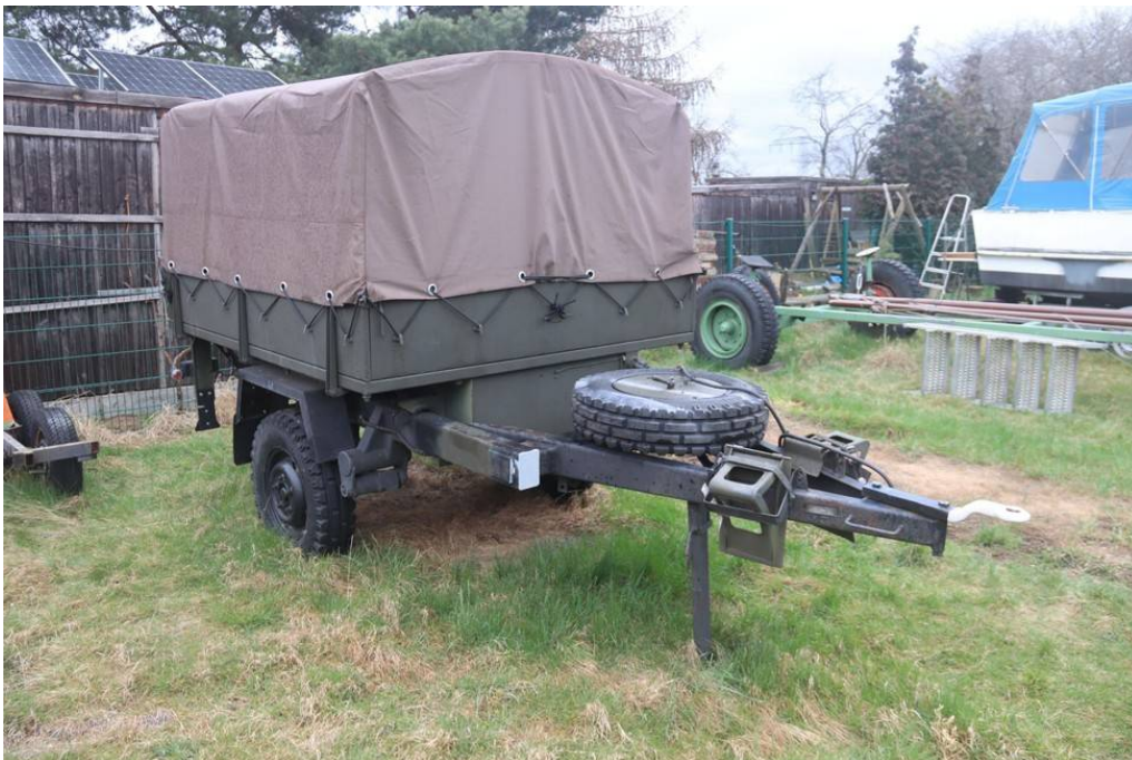
Ansicht vorn rechts