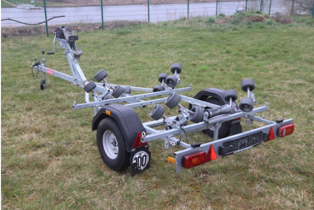
Ansicht hinten links