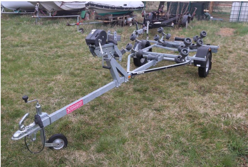
Ansicht vorne links