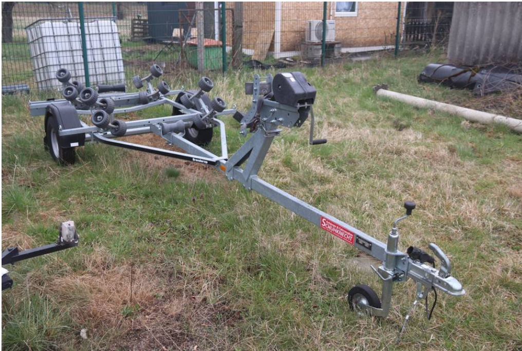
Ansicht vorn rechts