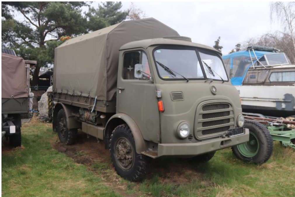
Totale des Fahrzeuges diagonal von vorne rechts