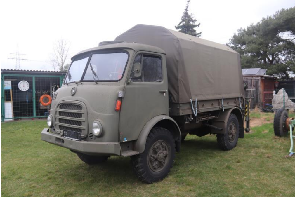
Totale des Fahrzeuges diagonal von vorne links