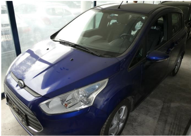
Der gegenständliche PKW Ansicht – vorne links