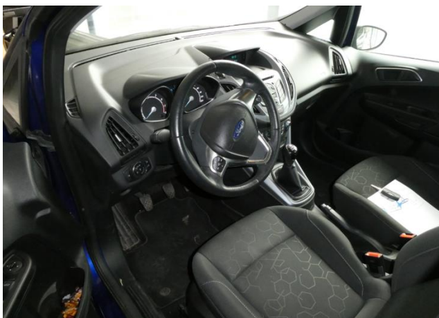
Der gegenständliche PKW Ansicht – Innenraum