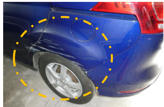
Der gegenständliche PKW Ansicht – hinten links