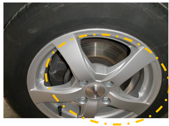
Der gegenständliche PKW Ansicht - Vorderrad