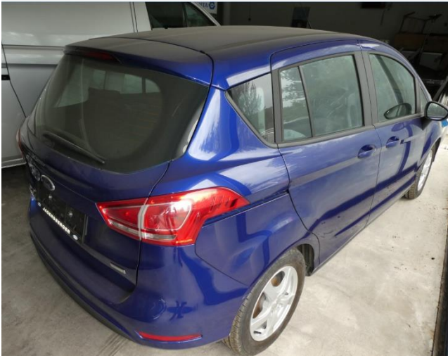
Der gegenständliche PKW Ansicht – hinten rechts