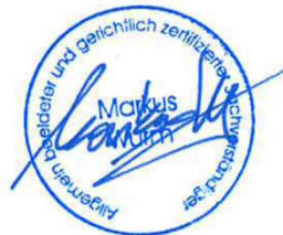
Markus Wurm A-8054 Seiersberg-Pirka, Gewerbering 1

Für die Richtigkeit der Feststellungen und die Objektivität der Auswertung