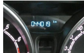
Der gegenständliche PKW Ansicht – Fahrgestellnummer und Kilometerstand